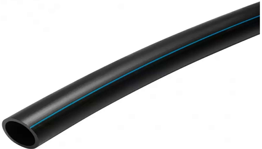
Kuvio 3. Paineputki PE80 PN12,5 SDR 11 (Meltex 2024)

Vesijohdot ovat putkistoja, jotka kuljettavat vettä rakennusten tai kaupunkien välillä. Ne ovat olennainen osa vesihuoltojärjestelmää ja varmistavat, että puhdasta vettä on saatavilla asukkaille ja yrityksille. Vesijohto on yleensä muovia ja sen tunnistaa mustasta tai sinisestä kuoresta, jossa on valkoisia tai sinisiä viivoja. Vesijohdon voi tunnistaa myös hitsausmuhvista, jolla putket ovat liitetty toisiinsa.