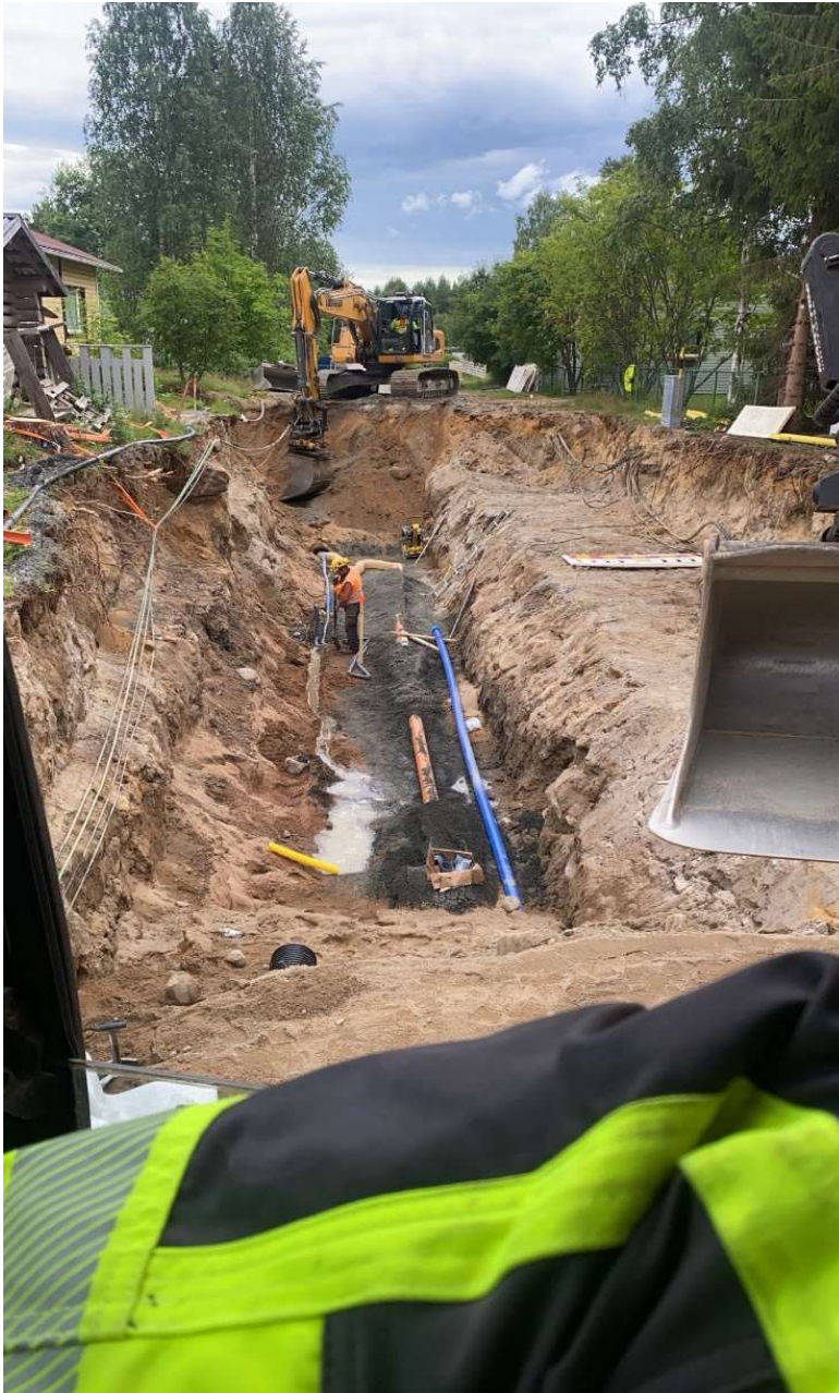
Kuvio 9. Erätien katusaneeraus

Putkitöiden tekemisen osalta tässä työssä käytetään esimerkkinä muutamaa eri katusaneerauskohdetta Rovaniemen alueella. Useassa kuvassa näkyvä Erätien katusaneeraus toteutettiin kesällä 2022 (kuvio 9).