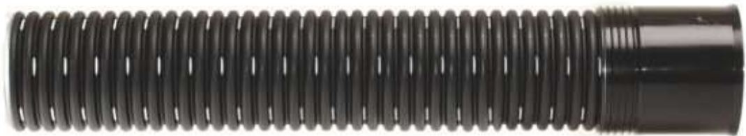
Kuvio 5. Tupla salaojaputki kiinteällä muhvilla (Pipelife 2020)

Salaojaputket ovat maan alle asennettuja putkistoja, joiden tarkoituksena on johtaa pois sade- ja sulamisvedet rakenteiden läheltä. Salaojaputket ovat tärkeä osa rakenteiden ja maaperän kuivana pitämistä.