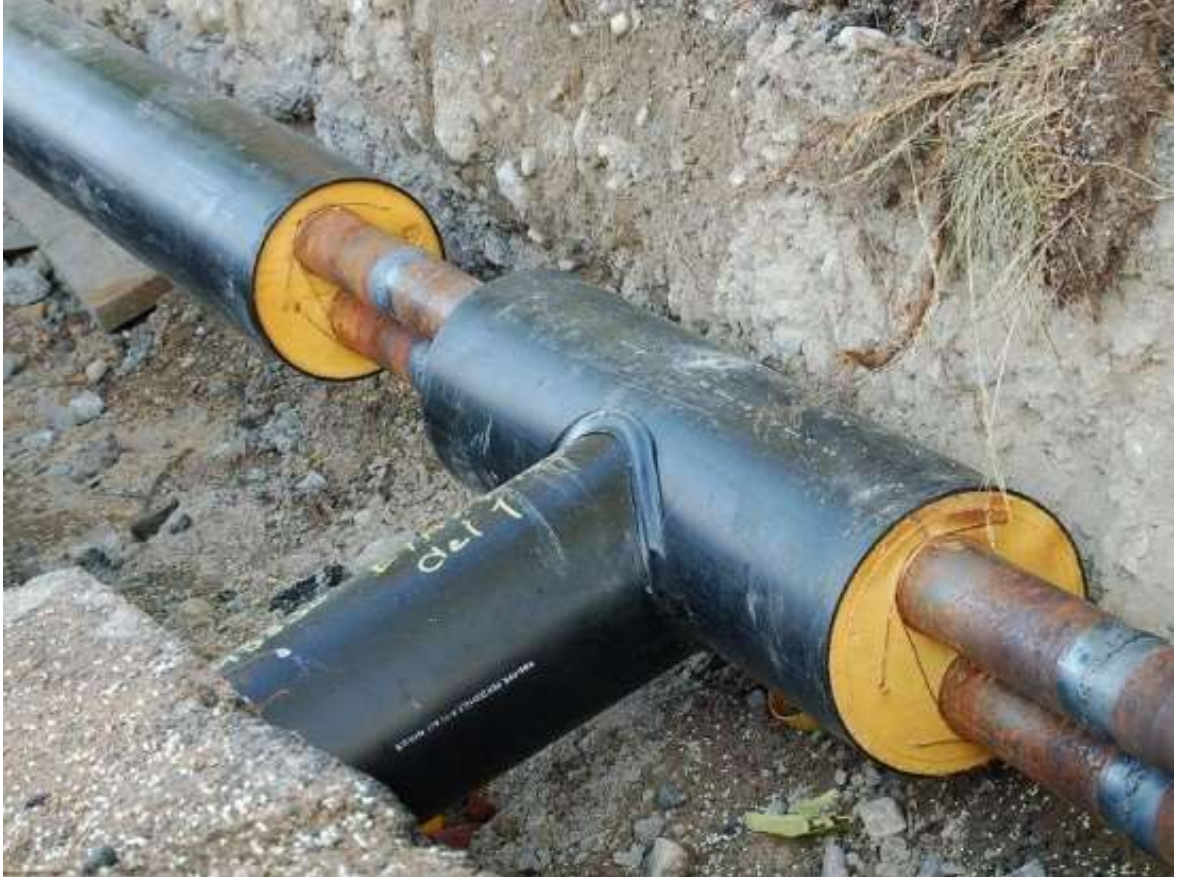
Kuvio 6. MPUK-Kaukolämpöputkijärjestelmä (Kiwa 2024)

Kaukolämpöputkisto koostuu yleensä pääputkesta ja sivuhaaroista, jotka vievät lämpöä eri asiakkaille. Putket ovat yleensä varustettu eristyksellä, joka vähentää lämmön häviämistä siirron aikana. Lisäksi putkisto sisältää erilaisia venttiilejä ja säätölaitteita, jotka ohjaavat lämmön jakelua eri asiakkaille.