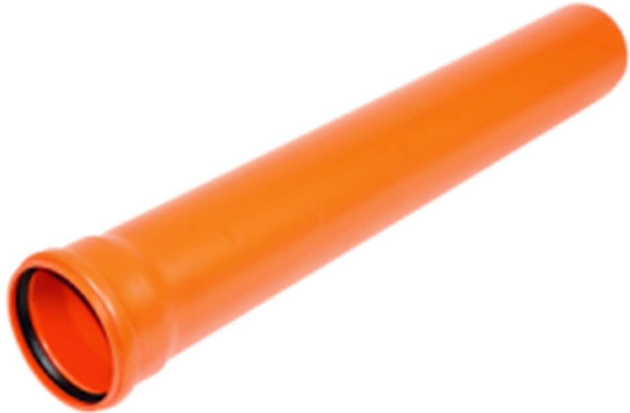
Kuvio 2. PVC-muovista valmistettu maaviemäriputki tiivisteellisellä liitosmuhvilla

Jätevesiviemärit ovat jäteveden keräämiseen ja kuljettamiseen tarkoitettuja putkistoja ja rakenteita. Ne keräävät käytettyä vettä ja muita nesteitä, jotka poistuvat rakennuksista ja muista kiinteistöistä. Jätevedet kulkeutuvat viemäriputkistoja pitkin jätevedenpuhdistamolle, josta ne puhdistusprosessien jälkeen johdetaan takaisin ympäristöön.