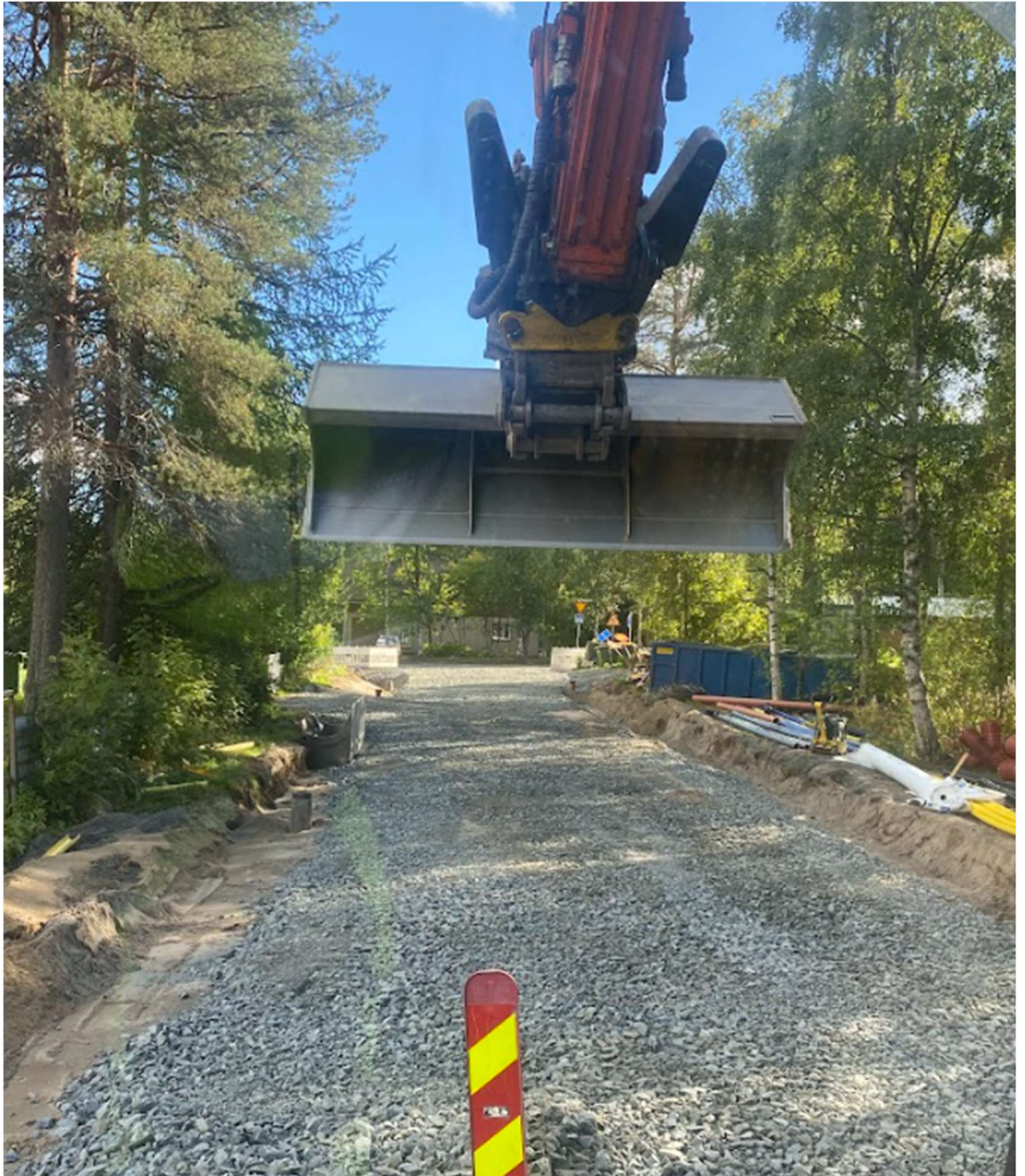
Kuvio 12. Valmista jälkeä Erätiellä

Kuvion 12 mukaisessa tilanteessa ollaan katusaneeraustyömaan loppumetreillä. Katu on saatu läpiajettavaan kuntoon, ja jäljelle jää viimeistelytyöt kuten ojaluisien muotoilu ja multaaminen, asfalttipäällyste, sekä katuvalaistuksen asentaminen. Kyseisessä kohteessa viimeistelytyöt jäivät seuraavan kesän töiksi.