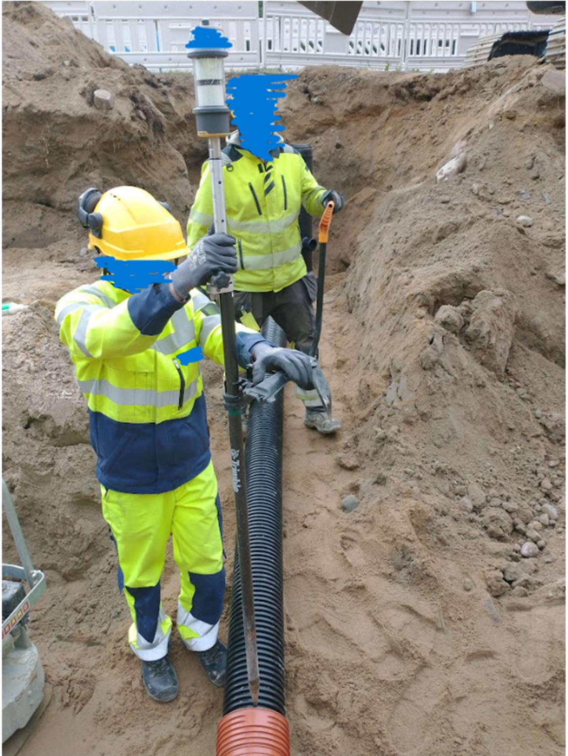
Kuvio 13. Mittamies tekemässä tarkemittausta (Ylinampa 2022)

Kaikkien putkien, kuten jätevesiviemäreiden, vesijohtojen, hulevesiviemäreiden laadunvarmistukseen kuuluu sijainnin toteaminen. Viemäreiden sijainti todetaan