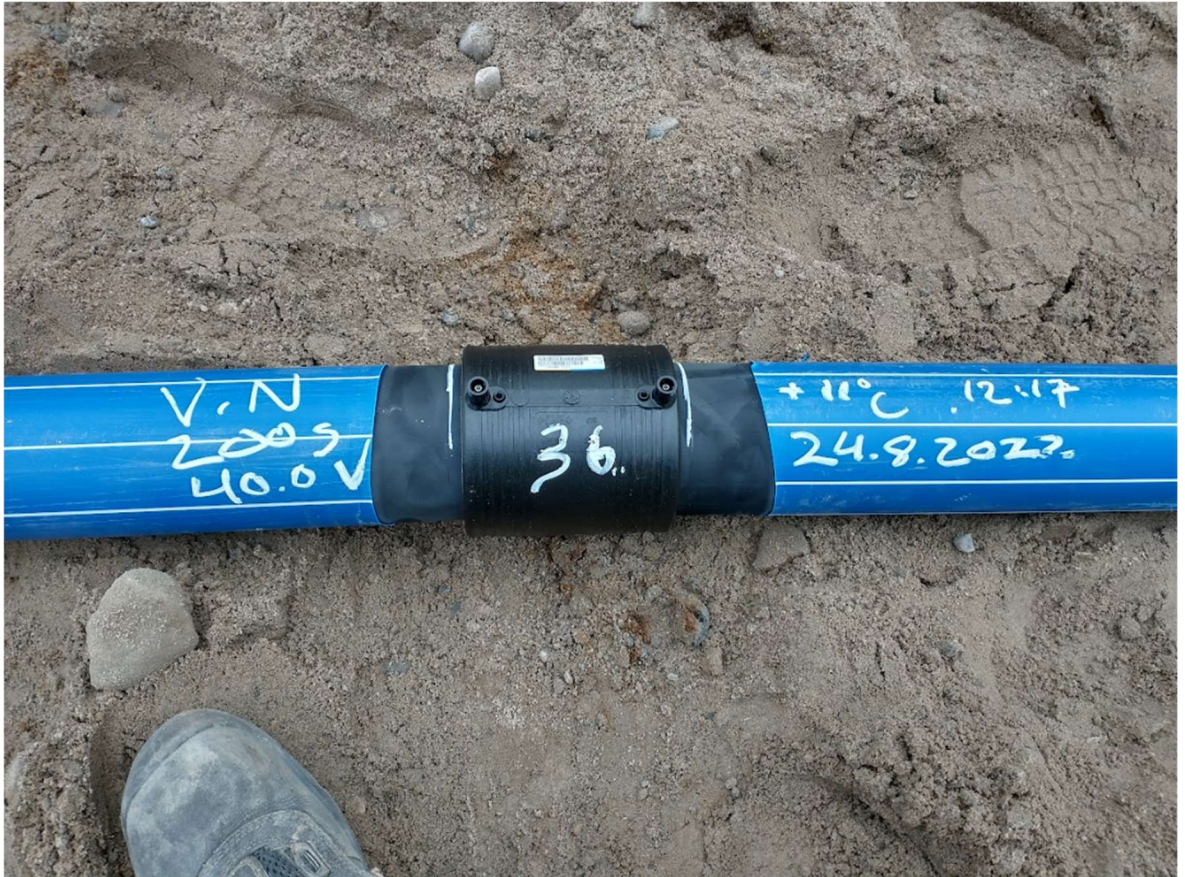
Kuvio 10. Merkitty putkihitsausliitos (Ylinampa 2022)

Hitsattavaan putkeen, hitsausosaan tai hitsausilmaisimiin ei saa koskea hitsauksen aikana, sekä hitsausta on valvottava koko hitsauksen ajan. Jäähdytysaikana käytetään sähköhitsausosan valmistajan määrittämää kyseisen osan sähköhitsauksen jäähdytysaikaa. Hitsattavaan putkeen, hitsausosaan tai hitsausilmaisimiin ei saa koskea jäähdytyksen aikana. Jäähdytysajan päätyttyä suuntaustuet poistetaan ja hitsaus tarkastetaan. Lopuksi merkitään hitsausliitos hitsauksen päivämäärällä, hitsaajan tunnuksella ja jäähdytysajan päättymisen kellonajalla (kuvio 10). (Muoviteollisuus Ry 2023.)