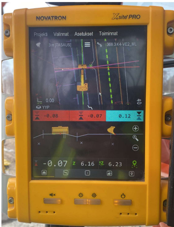
Kuvio 8. Novatron 3D-koneohjausjärjestelmä

3D-koneohjausjärjestelmillä (kuvio 8) varustelluiden kaivinkoneiden myötä kaivuutyön tekeminen helpottuu ja mittamiehen tarve työmaalla vähenee. Koneohjausmallista käyvät ilmi asennettavien putkien korot, kaivojen korot, rakennekerroksien paksuus ja korot. Lisäksi koneohjausjärjestelmällä kuljettajat ottavat tarkemittauksia, joka on yksi laadunvarmistusmenetelmistä.