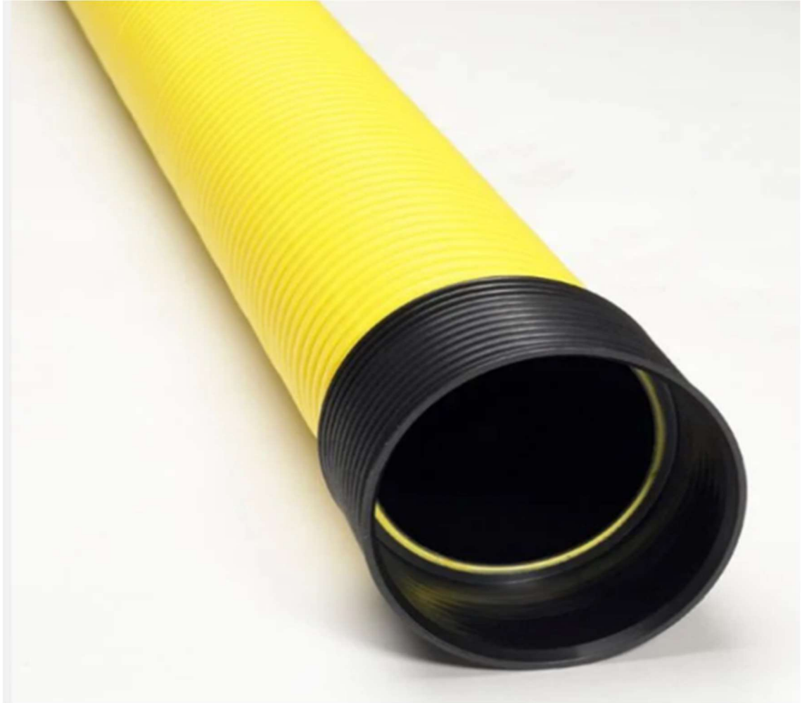
Kuvio 7. 110 mm Kaapeliputki SN8 (Byggmax 2024)

Kaapeliputkia käytetään suojaamaan kaapeleita ja johtoja maan alla tai rakennusten rakenteissa. Kaapeliputket ovat valmistettu PVC-muovista. Niitä käytetään yleisesti sähkö-, tietoliikenne- ja vesiputkien suojaamiseen.