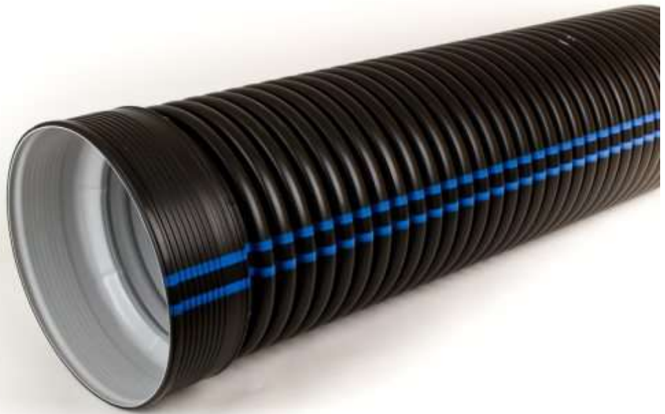
Kuvio 4. Raineo tuplavahva sadevesiputki sadevesi- ja hulevesien johtamiseen (Pipelife 2020)

Hulevesiputket on asennettava oikein, jotta vesi pääsee virtaamaan esteettömästi ja mahdolliset tukokset voidaan välttää. Putket on yleensä asetettu maan alle ja niiden on oltava riittävän syviä ja kaltevia, jotta vesi virtaa tehokkaasti pois kohteesta.