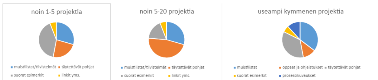
Kuva 4. Vastauksista saadut piirakkadiagrammit työkalun osalta.

Isoimpia eroja projektitoimijoiden kokemukseen nähden nousi juuri työkalua koskien. Uudempien projektitoimijoiden keskuudessa nousi hieman enemmän tarvetta valmiille esimerkeille, kun taas kokeneimpien projektitoimijoiden keskuudessa nousi täytettävät pohjat ja muistilistat, joiden avulla voi vain tsekata nopeasti muistaako oikeita asioita. Kuitenkin taustalla on sama tarve, eli halu suunnitella ja keskittyä juurruttamiseen samantyyppisillä kuin esimerkiksi viestintään.