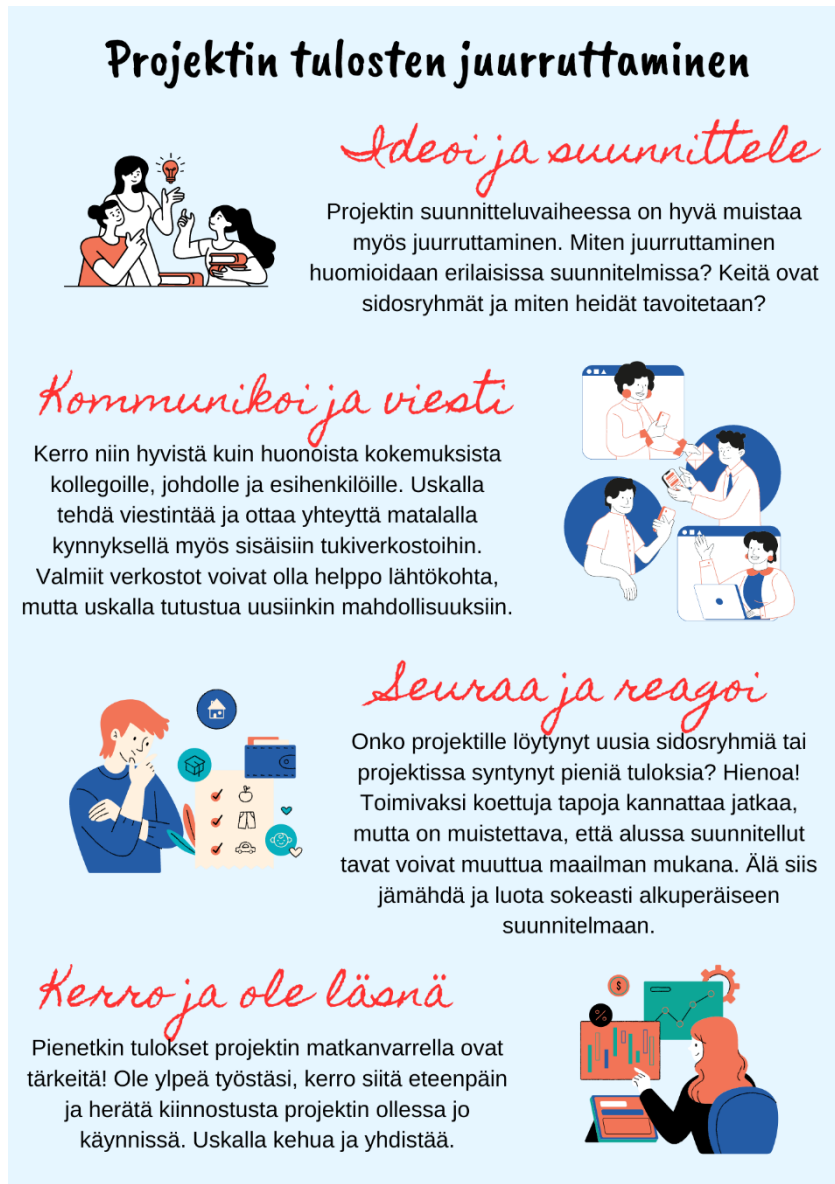
Kuva 5. Projektitoimijoiden ajatukset projektityöskentelystä.

Tredun projektitoiminnassa on ollut jo vuosia käytössä projektipäälliköille ”huoneentaulu”-nimellä kuva, johon on liitetty kaikki tärkeimmät muistettavat asiat. Tästä jo käytössä olevasta työkalusta heräsi ajatus luoda samanlainen myös juurruttamistyöstä. Kuva toimii johdatuksena ja on tehty vahvasti projektitoimijoiden ajatusten pohjalta.