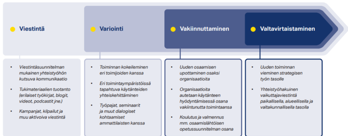
Kuva 2. Viestintä on tärkeä pohja onnistuneelle projektille (Halonen, 2021b)

Viestintä on tärkeä pohja kohti vakiintuneita käytänteitä, joita projekteilla pyritään luomaan. Ilman toimivia keskusteluyhteyksiä ja viestintäkanavia ei voida luoda avointa keskustelua variointiin tai lähteä vakiinnuttamaan tuloksia. (Halonen, 2021b)