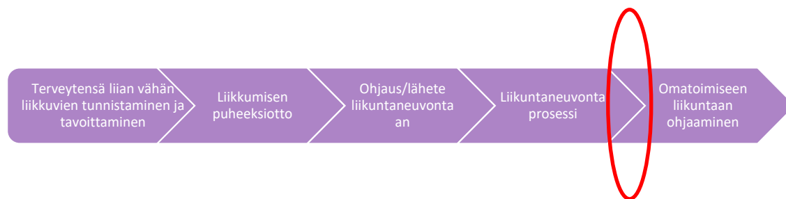
Kuva 1. Liikuntaneuvonnan palveluketju. (Liikuntaneuvonnan asiantuntijaforumi 2021, 16).

Asiakkaan siirtyessä liikuntaneuvonnasta omaehtoiseen liikkumiseen, voi palvelun järjestäjä olla myös yksityinen liikuntapalveluita tarjoava yritys tai potilasjärjestö. Tässä opinnäytetyössä keskityttiin liikuntaseuroihin siirtymisen palvelupolkuun toimeksiantajan tarpeesta ja asiakasryhmäksi valikoitui aikuisliikkujat, koska liikuntaneuvonnan tyypillisin asiakas on keski-ikäinen aikuinen ja liikuntaseuroissa aikuisliikkujien määrä on tulevaisuudessa vähentymässä (Leppä ym. 2022, 10; Törmä ym. 2021, 9–10).