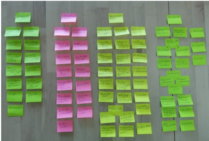
Kuva 1: Aivoriihityöskentelyn post-it-lappu tuotos

Aivoriihityöskentelyn jälkeen analysoin ja yhdistelin tunnistettuja riskejä muodostaen lopulta 16 merkittävintä riskiä ja riskikokonaisuutta. Kehittämistyössä jatkokäsiteltäväksi otetut riskit on esitetty taulukossa 1. Huomioin prosessissa myös teemahaastattelun avulla saadun tiedon. Tarkoituksena oli poistaa toistoa ja varmistaa, että kehittämissä keskitytään liiketoiminnan kannalta olennaisimpiin riskeihin mahdollistaen myös resurssien tehokkaan kohdistamisen.