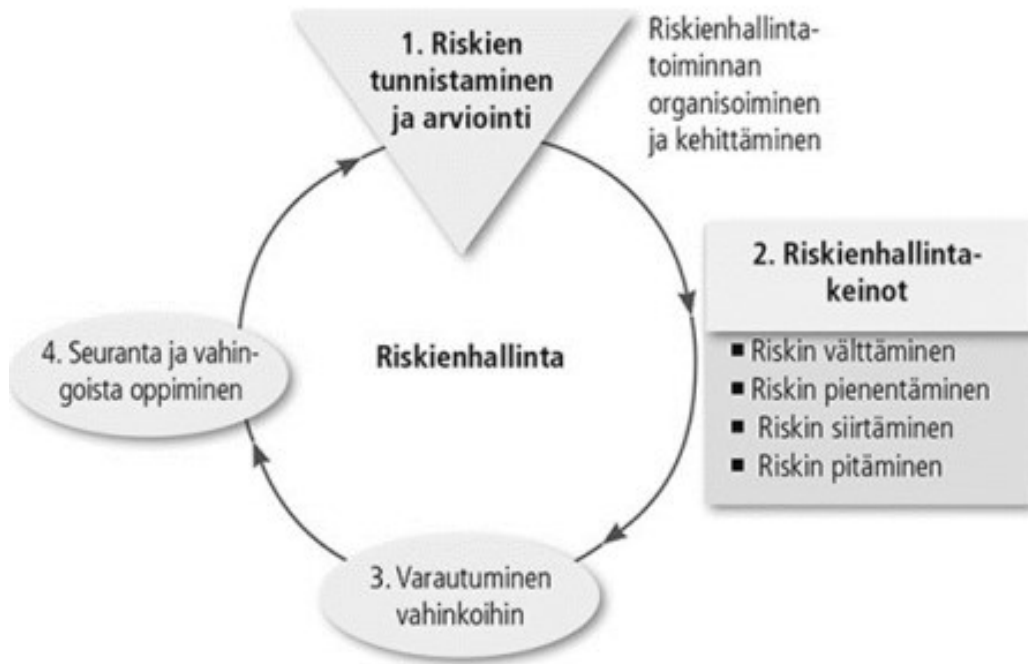
Kuvio 1: Riskienhallintaprosessi (Viitala & Jylhä 2013, luku 20)