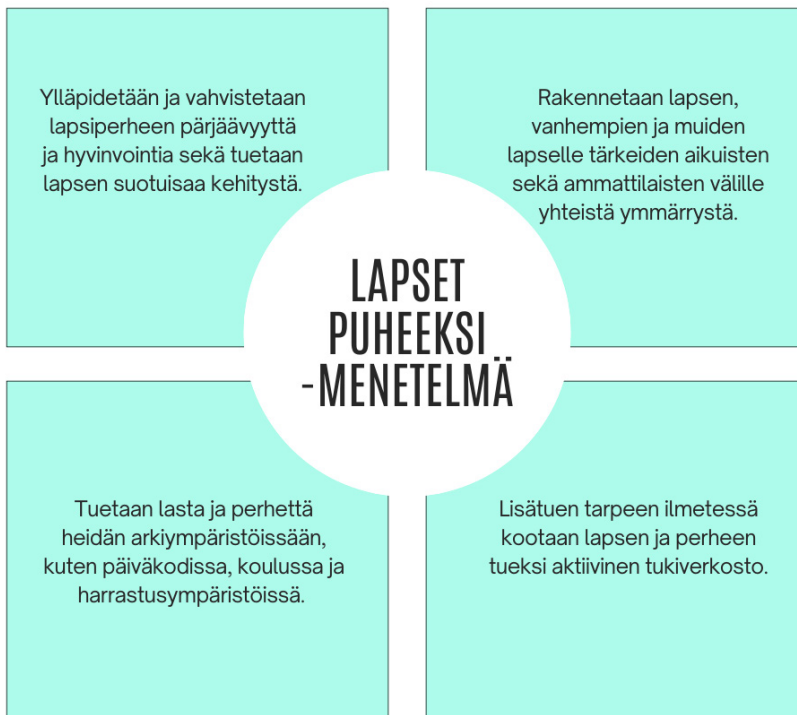
KUVA 1. Tietokooste Lapset puheeksi -menetelmästä. (Kasvun tuki – Varhaisen tuen tietolähde 2007; Suomen mielenterveys ry, julkaisuaika tuntematon.)

Lapsiperheiden kotipalvelu on osa Pohjois-Savon perhekeskuksen eli monialaisen palveluverkoston lapsiperheille suuntaamaa varhaisen tuen palvelupalettia. Perhekeskustoiminnassa hyödynnetään vanhemmuuden tukemiseksi erilaisia vahvaan näyttöön perustuvia, ennaltaehkäiseviä menetelmiä, työkaluja ja toimintamalleja. Paikallisen perhekeskuksen vanhemmuuden työkalupakkiin on valittu yhdeksi välineeksi Lapset puheeksi -menetelmä. (Pohjois-Savon hyvinvointialue julkaisuaika tuntematon b.) Alla olevaan kuvaan on koostettu tietoa Lapset puheeksi -menetelmästä (Kuva 1).