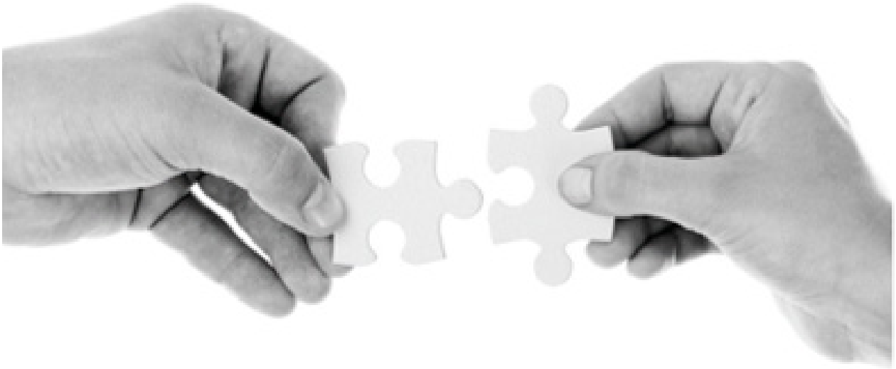
Kuva 2. Pixabay

Median luoma kuva lastensuojelusta vaikuttaa myös perheiden haluun vastaanottaa matalan kynnyksen tukea kotiin, sillä pelkona on usein se, että lapset viedään pois, jos työntekijä havaitsee haasteita perheessä. Lastensuojelulaissa (417/2007, 3a§) säädetään ehkäisevästä lastensuojelusta. Sen tarkoituksena on muun muassa tukea vanhemmuutta sekä edistää ja turvata lapsen kehitystä. Lain mukaan ehkäisevää lastensuojelullista tukea annetaan esimerkiksi varhaiskasvatuksessa. Varhaiskasvatuksen perheohjaus on tärkeä työmuoto ennaltaehkäisevässä lastensuojelutyössä ajatellen varhaiskasvatuksen toimintaympäristöä.