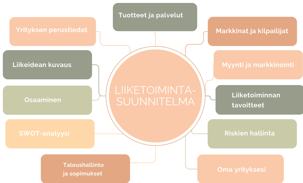
Kuvio 1: Liiketoimintasuunnitelman rakenne (Mukaillen Uusyrittyskeskus 2022).