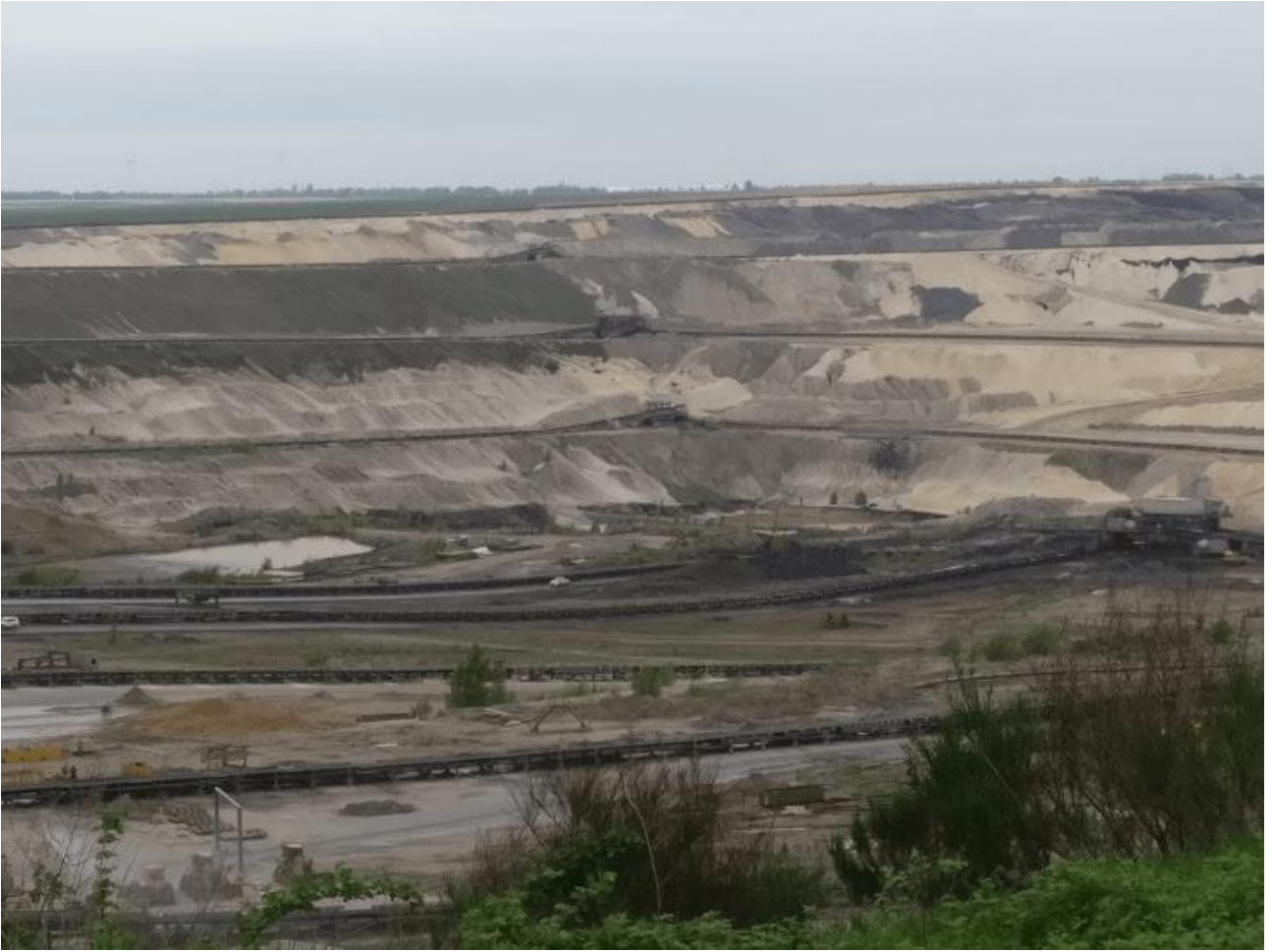
KUVA 5. Vuonna 2030 suljettava ruskohiiltä tuottava avolouhos