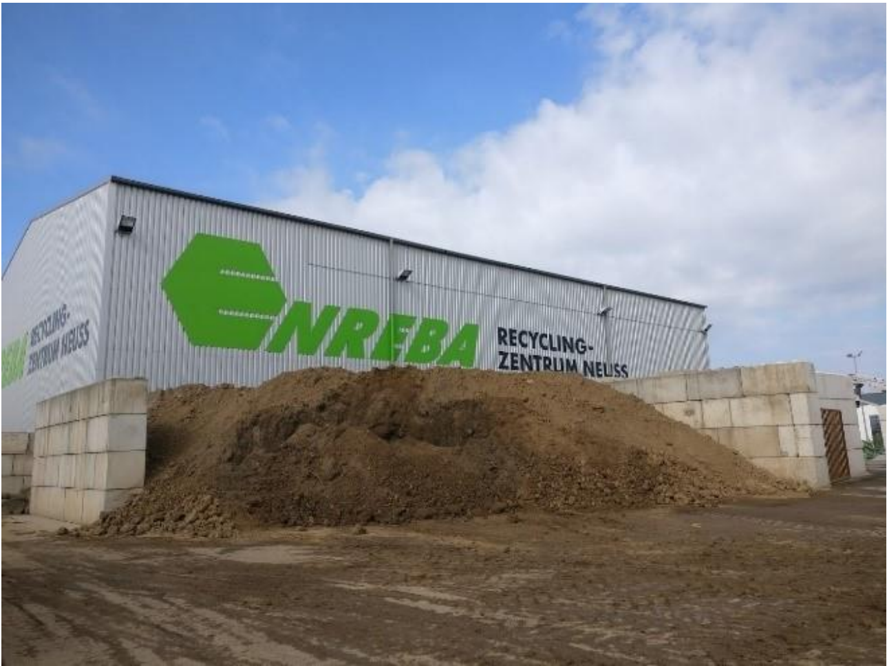
KUVA 1. Enreba Neuss on sertifioitu saksalainen mineraalisten rakennusjätteisiin kierrätykseen ja hyötykäyttöön erikoistunut yritys

Vuosittainen rakennusjätteiden käsittelymäärä on 250 000–300 000 tonnia, josta noin kaksikolmasosa menee tietyömaiden raaka-aineeksi. Materiaalien hyötykäyttöaste on yli 99 prosenttia. Jättemateriaalien toimitussäde on 60–70 kilometriä. Enreba ottaa vastaan myös viherjätettä, puuta ja pilaantuneita maita, mutta ne välitetään sellaisenaan jatkokäsiteltäväksi partnerille.