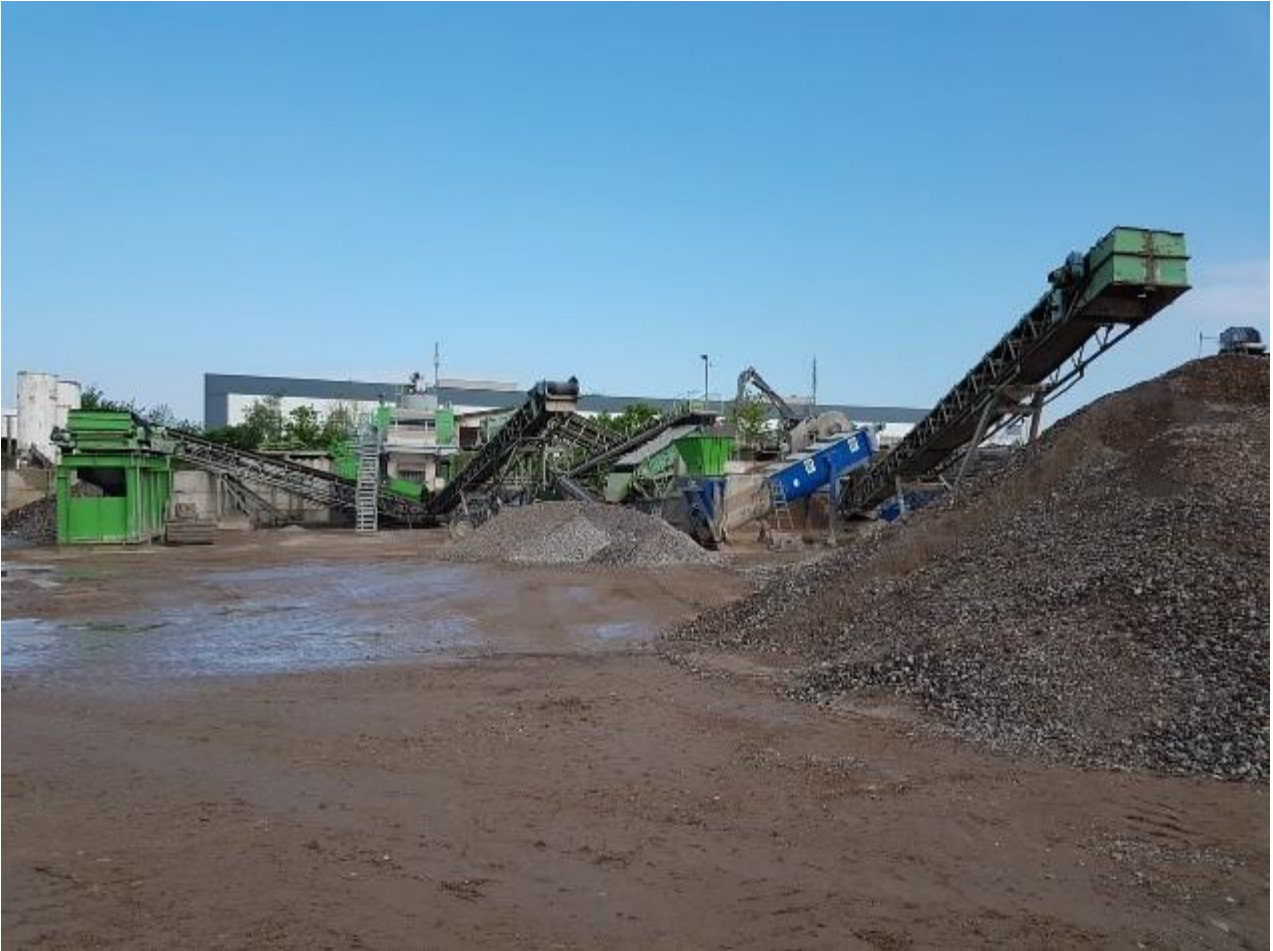
KUVA 2. Enreban sivujakeiden käsittelylaitteistoa

Materiaalien vastaanotossa käsiteltävät jakeet mitataan, analysoidaan, testataan ja luokitellaan käyttötarkoituksen tai lopputuotteen mukaisesti. Luokittelun perusteella jätejakeet joko käsitellään Enreban omassa kierrätyslaitoksessa tai ohjataan eteenpäin sertifioiduille toimijoille. Seulonnassa maa-ainekset erotellaan eri kokoluokkiin. Alle 4 mm materiaalit analysoidaan tarkemmin ja tuloksen mukaan määritellään niiden käyttötapa.