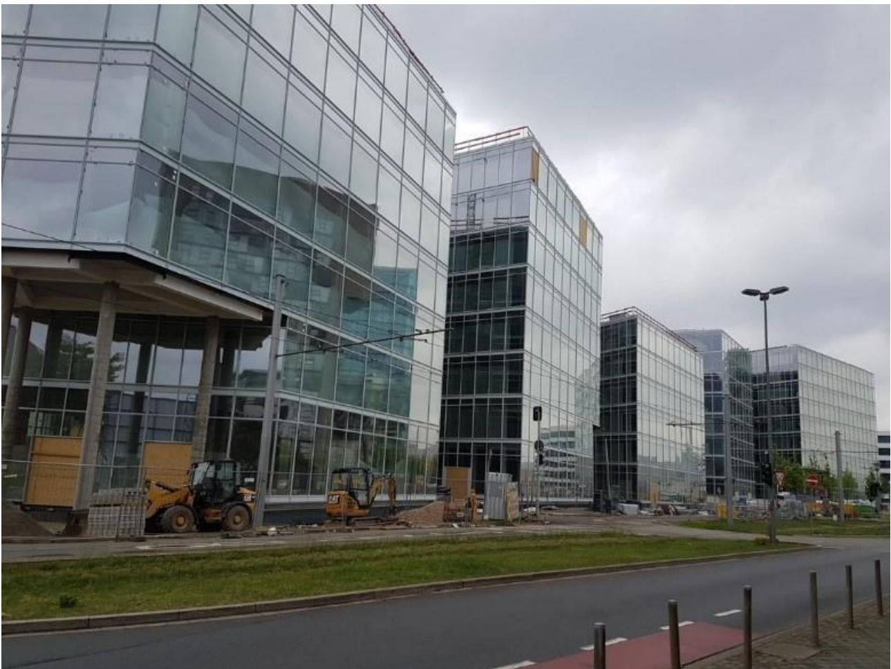
KUVA 9. Rakenteilla oleva kuuden kerrostalon toimistokortteli, jonka jätehuollon organisoinnista vastaa SiteLog GmbH

Vierailukohteena oli rakenteilla oleva kuuden toimistorakennuksen kokonaisuus (kuva 9), jossa kerrostalot on yhdistetty toisiinsa kulkusilloin.