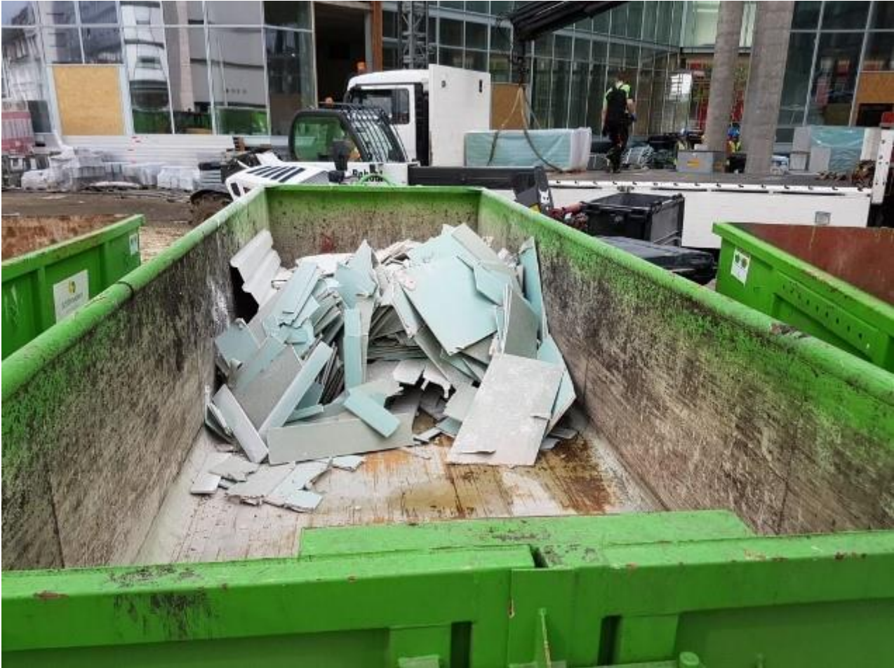
KUVA 11. Rakennustyömaan kipsilevyn kierrätyspiste

Tämä rakennuttaja oli valinnut palvelutason kaksi. Rakennusyritys tuo jätejakeet työmaan keskitetylle jäteasemalle, joka sijaitsee tontille vievän kapean tien päässä. Rakennusyritys lajittelee jätteet ja erottelee eri jätejakeet itse. Lisäksi työmaan siivouksesta huolehtii rakennusyritys. SiteLog GmbH pitää yllä jätejakeiden tilastointia ja dokumentointia.