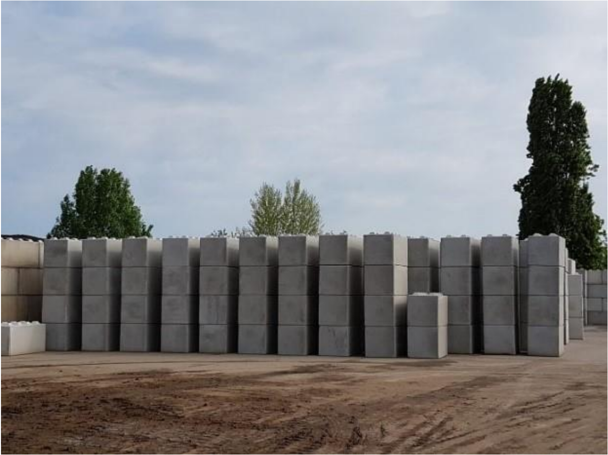
KUVA 4. Kierrätysbetonista valmistettuja rakennuspalikoita

Yhden rakennuspalikan paino on 2,3 tonnia. Yhden kierrätysmateriaalista valmistetun rakennuspalikan hinta on 60 euroa, kun taas neitseellisestä materiaalista valmistetun tuotteen hinta on 80–90 euroa.