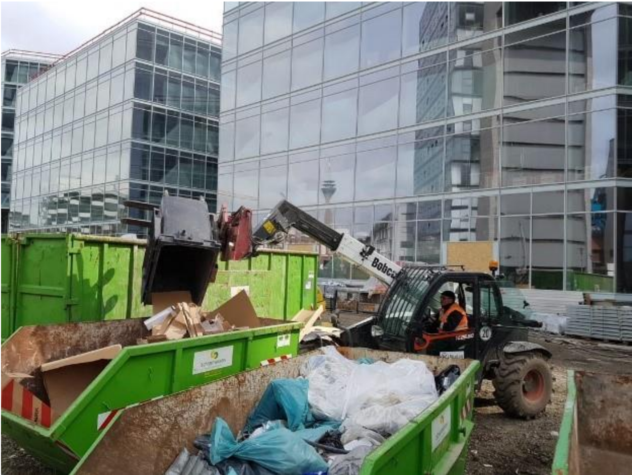
KUVA 10. Rakennustyömaan jäteasema

SiteLog GmbH:n vastuulla tässä projektissa on muun muassa ollut henkilöstön ja kuljetuskaluston määrän arviointi, rakennustyömaa-alueen logistiikan suunnittelu sekä tarvittavien nostolaitteiden, jätekonttien, varastointi- ja työskentelytilan määrien laskenta ja järjestelyt. (Kuva 10.)