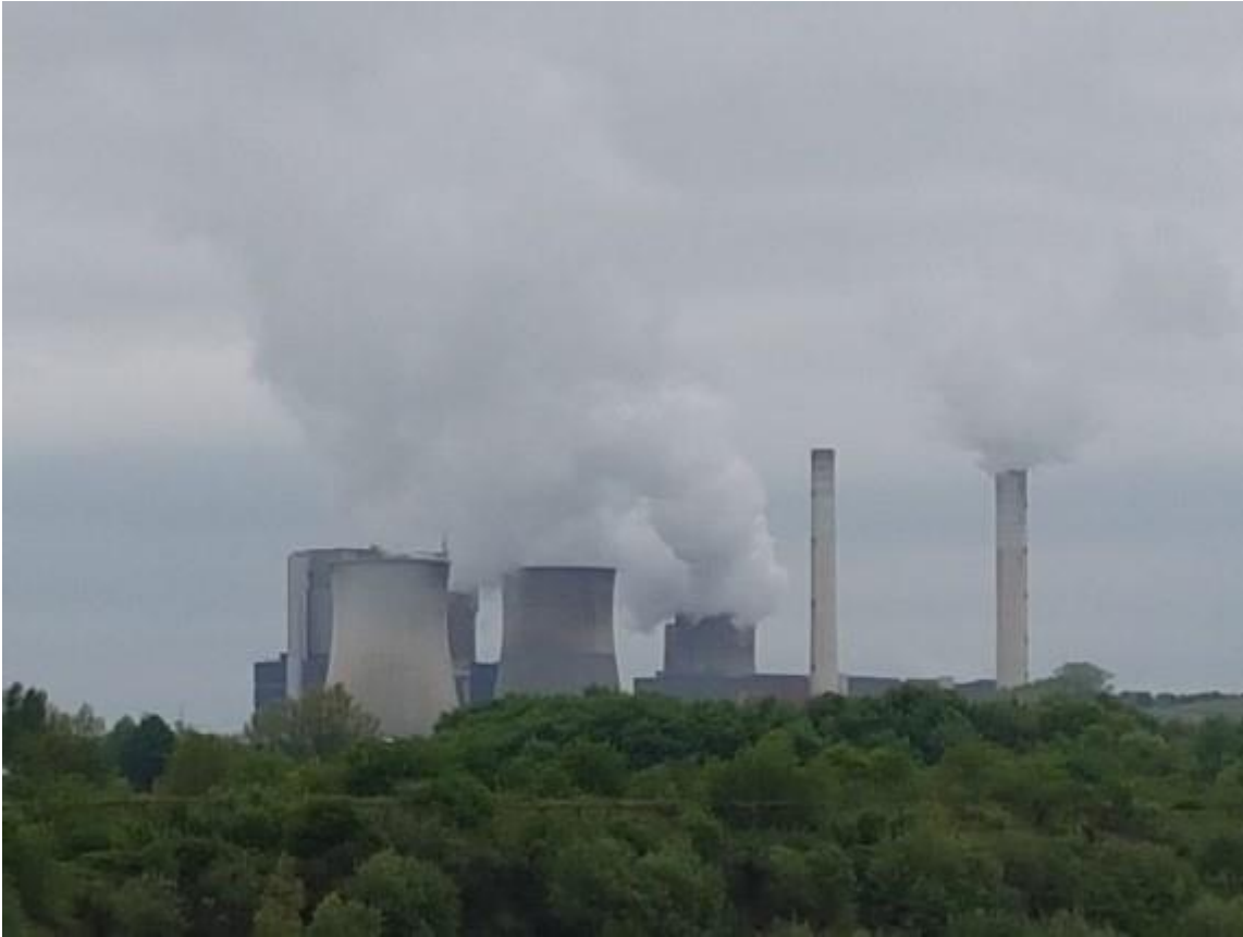
KUVA 6. Saksa on luopumassa hiilivoimaan perustuvasta energiantuotannosta

Alueen kolmesta ruskohiilikaivoksesta ensimmäinen suljetaan vuonna 2030. Kahden muun louhoksen sulkemisajankohtaa ei ole vielä päätetty.