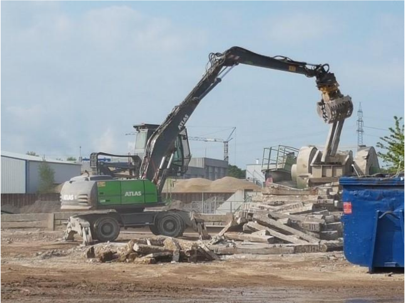
KUVA 3. Ratapölkkyjen käsittelyä erikoismurskaimella

Ratapölkkyjen murskaamiseen käytetään järeitä erikoismurskaimia, koska pölkkyjen tukirakenne on jännitetyllä sinkillä lujitettu.