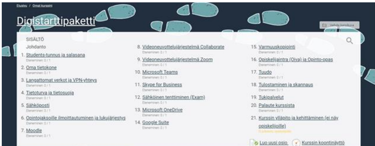
KUVA 1. Digistarttipaketti Moodlessa