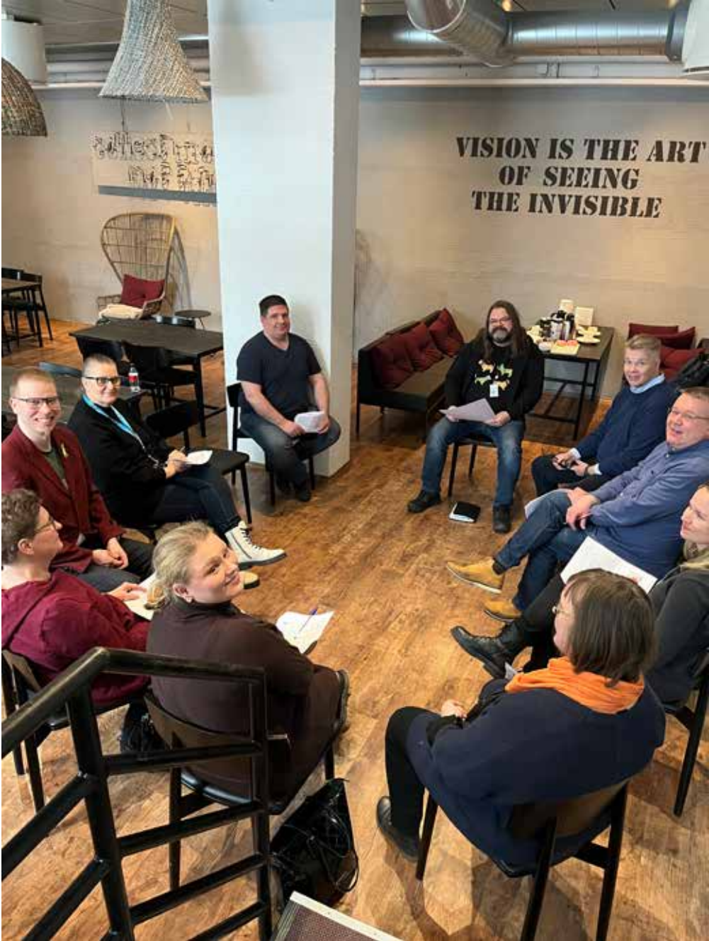
Kuva 2. Työskentelyä työpajassa.