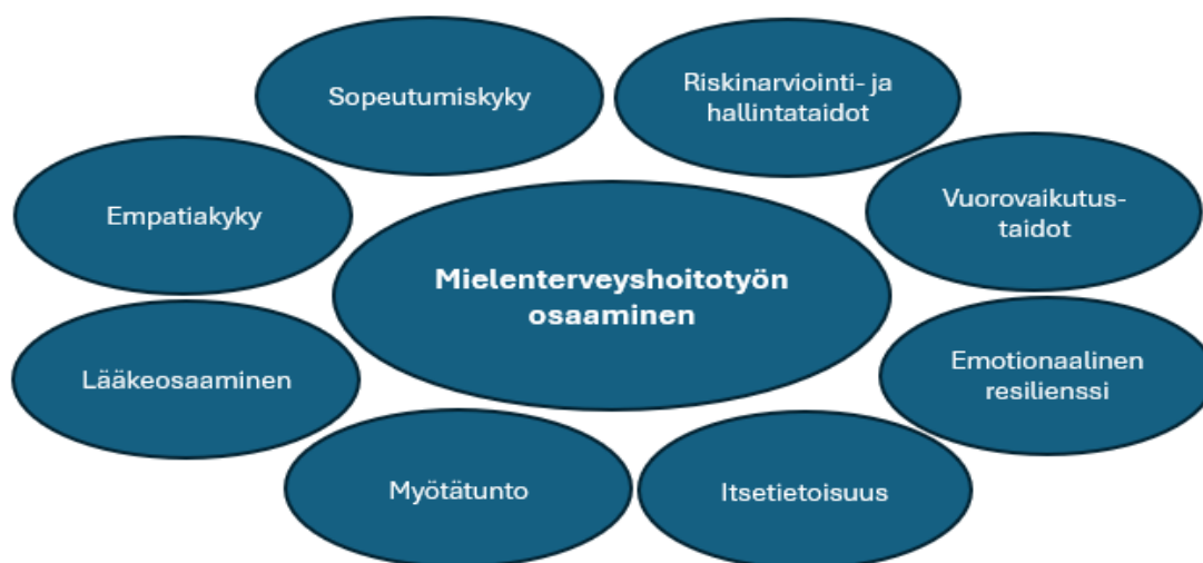
Kuvio 1. Mielenterveyshoitotyön osaaminen (NHS England 2024 mukaillen).

Mielenterveyshoitotyö edellyttää vahvoja analyyttisiä ja loogisen päättely taitoja, jotka auttavat havaitsemaan potilaan ajattelussa ja käyttäytymisessä asioita, joiden perusteella työdiagnosi tehdään. Luova ongelmanratkaisukyky on olennainen osa mielenterveyshoitotyötä. (Bradley University.) Riskien arviointi- ja hallintataitoja pidetään tärkeimpänä taitona mielenterveyshoitotyössä. (Moyo & Jones & Gray 2022; kuvio 1). Sosiaali- ja terveysalan tiedot ja menetelmät minimisisältöihin kuuluu mielenterveysongelmien, itsetuhoisuuden, alkoholin ja huumeidenkäytön varhainen tunnistaminen, niiden puheeksi ottaminen ja lisäksi tuen piiriin ohjaaminen (Terveyden ja hyvinvoinnin laitos 2024). Itsensä vahingoittamisen riskin arviointi on osa mielenterveyshoitotyötä (Moyo ym. 2022; Terveyden ja hyvinvoinnin laitos 2024).