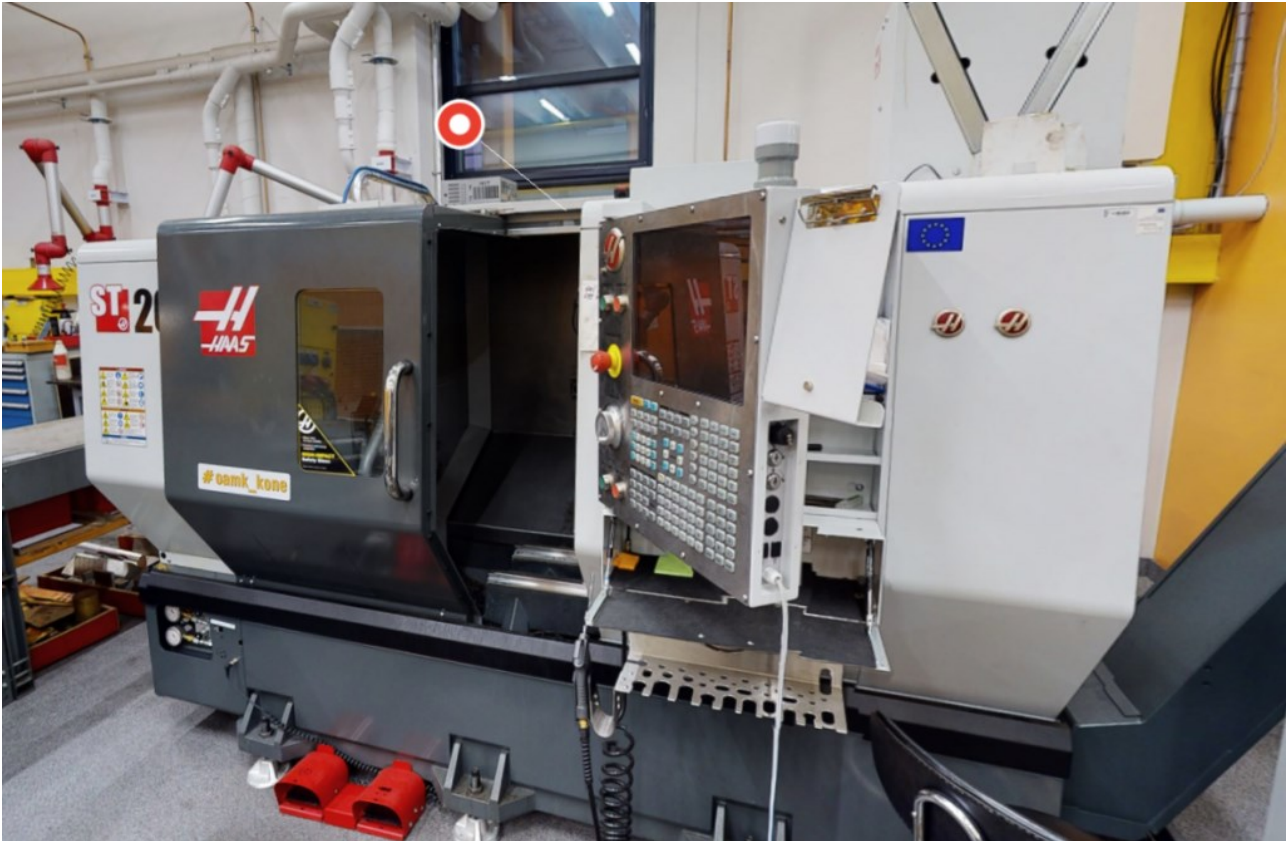
KUVA 2. ST20-25 metallisorvi Linnanmaan konepajalla.

Tavoitteena pelissä on opettaa opiskelijalle CNC-sorvin turvallista ja oikeaa käyttöä. CNC-sorvilla (kuva 2) voidaan työstää erilaisia metallikappaleita asettamalla metallikappale koneeseen ja syöttämällä työstöohjelma tietokoneelle. Koneen käyttö vaatii teknistä osaamista ja turvallisten työtapojen hallintaa.