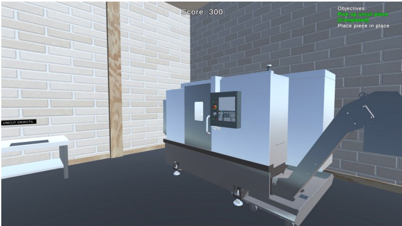
KUVA 1. CNC-sorvi virtuaalisella konepajalla.