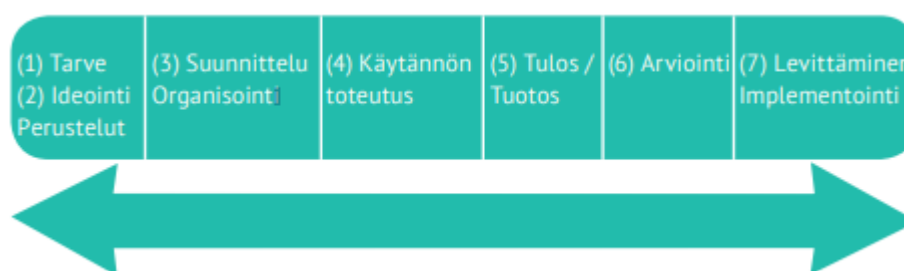
Kuvio 1. Lineaarinen malli (Salonen ym. 2017, 52)

Opinnäytetyön lineaarisen mallin mukaiset työvaiheet ovat nykykäytännön kehittämistarpeiden tunnistaminen (selvitetään millaisena kotihoidon henkilökunta näkee kuntoutumista tukevan hoitotyön), suunnitteluvaihe (osallistava työpaja, joissa kotihoidon henkilökunnan kanssa kehitetään miten kuntoutumista tukevaa hoitotyötä voi kehittää), toteutusvaihe, tulos/tuotos (osallistava työpaja, jossa luodaan prosessikaavion muutos arviointijaksoon kuntoutumista tukevan hoitotyön näkökulmasta), arviointi ja päätösvaihe (Salonen ym. 2017, 52).