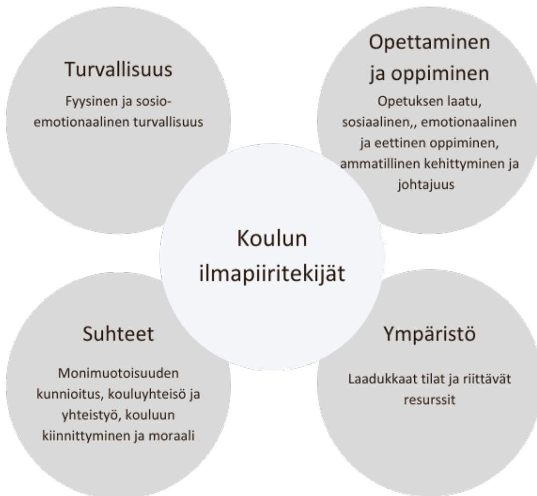
Kuvio 1. Oppilaitoksen ilmapiiritekijät (Cohen ym. 2009 mukailten)

Oppilaitoksen ilmapiiri muodostuu useista tekijöistä. Eri tutkimusten pohjalta on päädytty neljään oppilaitoksen ilmapiiriä keskeisesti muokkaavaan tekijään. (Cohen 2006; Cohen ym. 2009; Thapa ym. 2012). Näitä ovat opettaminen, oppiminen, turvallisuus, suhteet ja ympäristö. Koulun ilmapiiri tekijät kuvataan kuviossa 1.