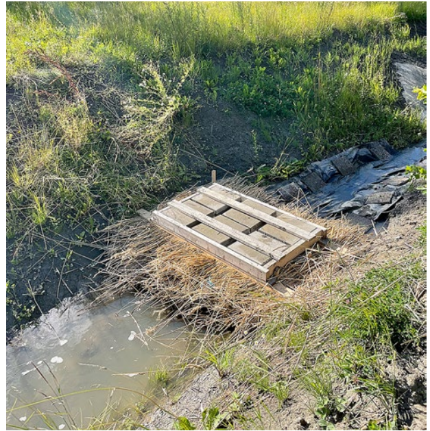
Kuva 2. Otetuissa vesinäytteissä ei havaittu kiintoaineen pidättymistä rakenteeseen.

taa selvitettiin näytteenotoin neljän eri sadetapahtuman aikana. Otetuissa vesinäytteissä ei havaittu kiintoaineen pidättymistä rakenteeseen. (Kuva 2).