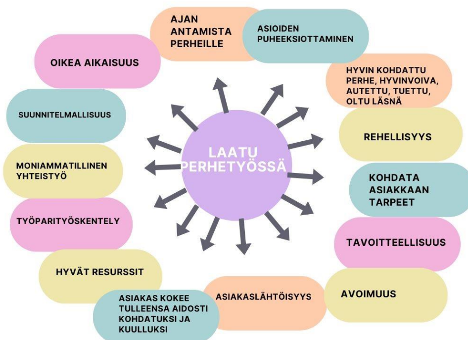
Kuvio 4. Laatu perhetyössä (Perälä & Uusi-Hakimo, 2024).

Mennään sillä lailla neutraalisti perheisiin. Kohdataan kaikki ihmiset saman arvoisina ja kaikki ihmiset ihmisinä eikä yritetä laittaa niitä johonkin muottiin valmiiksi.