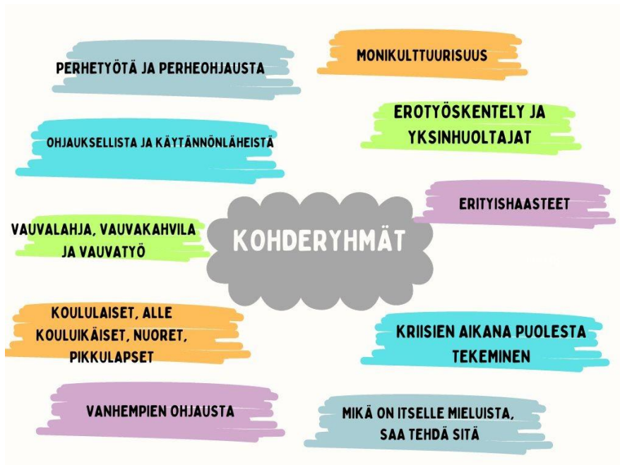
Kuvio 3. Työskentelytapoja ja asiakaskohderyhmiä (Perälä & Uusi-Hakimo, 2024).

mukaan. Kävi ilmi, että jokaisella oli silti joku mieluinen asiakaskohderyhmä. Todettiin, että perhetyö voi olla ohjauksellista tai enemmän käytännönläheisempää ja joskus jopa samalla kerralla molempia. Asiakkaiden mahdollisten kriisien aikana autetaan asiakkaita enemmän ja saatetaan tehdä enemmän puolestakin asioita. Kolmas taustakysymys oli kysymys työvuosista. Työntekijät olivat työskennelleet perhetyössä kolmen vuoden ja kymmenen vuoden välillä. Seuraavaan kuvioon on avattu tarkemmin työntekijöiden työskentelytapoja ja asiakaskohderyhmiä (kuvio 3).