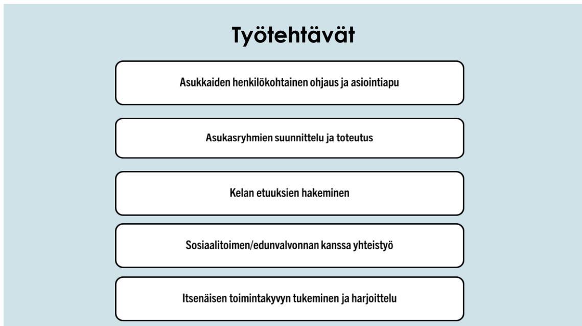
Kuvio 3: Työtehtäväni sosionomina mielenterveyskuntoutujien asumispalveluissa (Pietilä 2024)

Tavoitteenani on tämän PONT:n aikana viikkoraportoinneissani paneutua työtehtävieni kehittämiseen ja samalla reflektoida omaa osaamistani sekä ammatillista kehittymistäni. Lähdemateriaali on tukenani sosionomin ammattihenkilön laadukkaan työn kehittämässä.