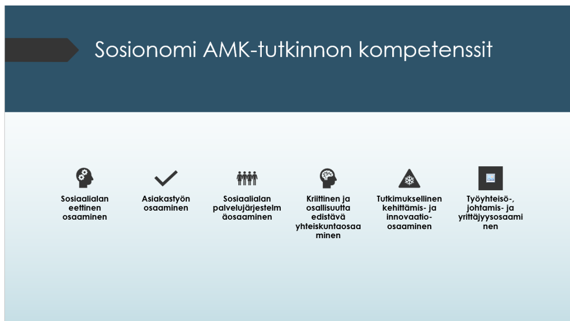
Kuvio 2: Sosionomi AMK-tutkinnon kompetenssit (SOAMK 2023)

Kompetenssi tarkoittaa valmiuksia, kykyä, ominaisuuksia ja taitoja, joiden avulla asetetuista tehtävistä voi suoriutua. Kuviossa 2, on esitetty sosionomi AMK-tutkinnon tuottamat kompetenssit (kuvio 2). Organisaatiospesifit kompetenssit liittyvät tiettyyn organisaatioon, johon tiedot ja taidot riittävät. Metakompetenssi kuvaa taitoja, joita voidaan käyttää yli työ- ja tehtävärajojen. (Mäkinen ym. 2011, 17-18.)