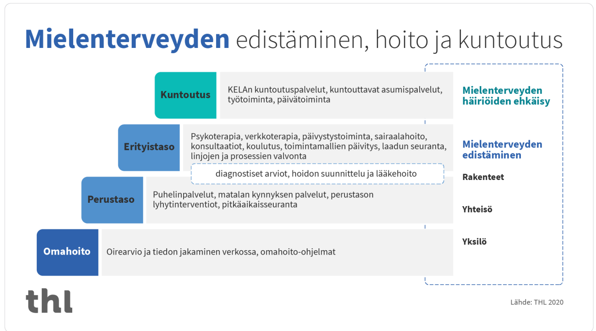
Kuvio 1: Perus- ja erityistason mielenterveyspalvelut (THL 2024a).