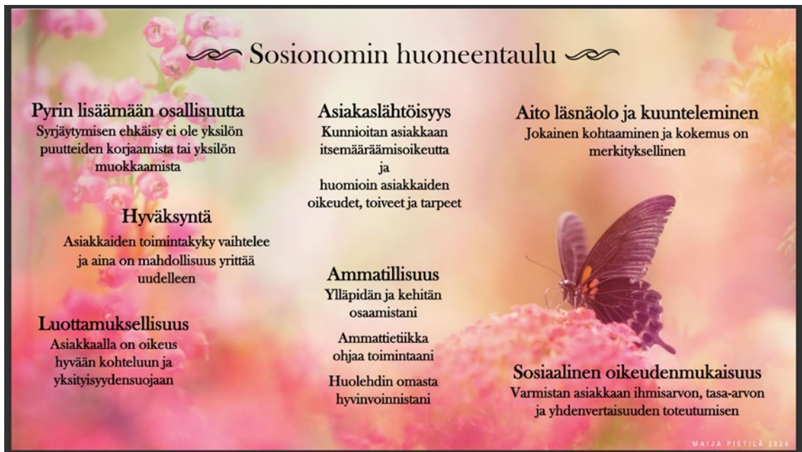
Kuvio 5: Sosionomin huoneentaulu (Pietilä 2024)

Viikon oivallukseni liittyy jokaisen hetken merkityksellisyyteen. Jokainen kohtaaminen ja kokemus luo mahdollisuuden niin henkilökohtaiselle kuin ammatillisellekin kasvulle.