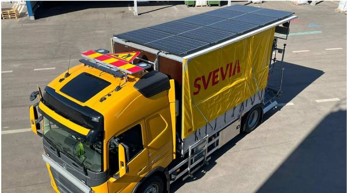
Kuva 8 Tiemerkintäauto, jossa käytetään aurinkoenergiaa tiemerkintöjen te- koon (24).

Tiemerkintöjen päästöjä voidaan vähentää myös vaatimalla urakoitsijaa uusi- maan koneita ja laitteita, joilla ei ole päästöluokituksia. Uudet koneet ovat yleensä energiatehokkaampia ja ympäristöystävällisempiä. Seuraavaan kilpailu- tukseen voitaisiin sisällyttää laatupisteitä aurinkoenergian käytöstä tiemerkintä- autoissa. (24.)