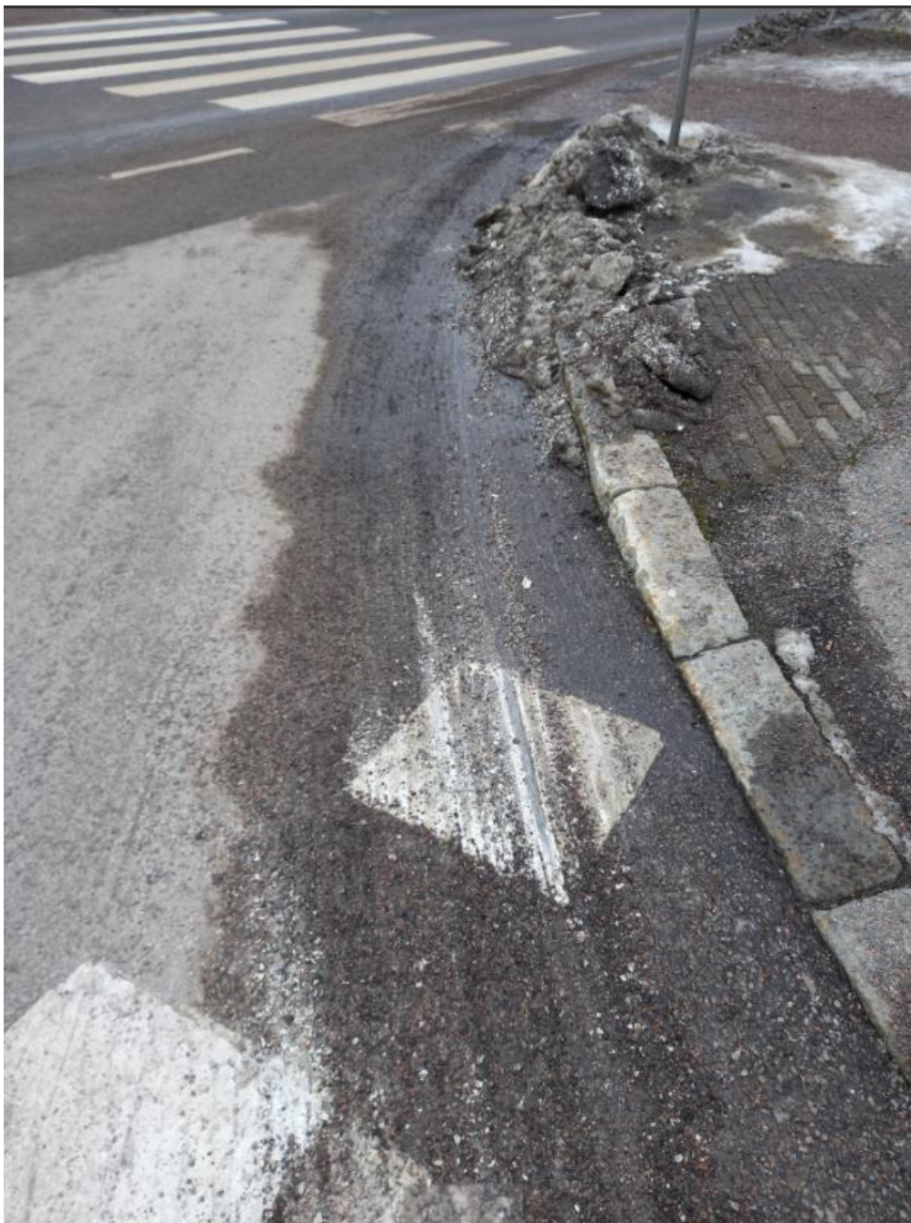
Kuva 6 Höylä tai alusterä raapinut tiemerkintää.