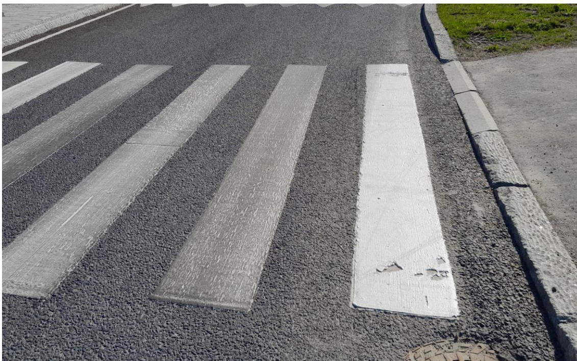
Kuva 4 Suojatiemerkinä, jossa on laatupoikkeuma

Tien pinnalla olevat epäpuhtaudet heikentävät massan tarttumista asfalttiin, mikä voi johtaa siihen, että tiemerkinä irtoaa asfaltista paloina ja kuluu nopeammin. Kuvassa 4 tiemerkinämässä ei ole tarttunut kunnolla, koska tien pinta on ollut mahdollisesti likainen merkinnän teon aikana. (15.)