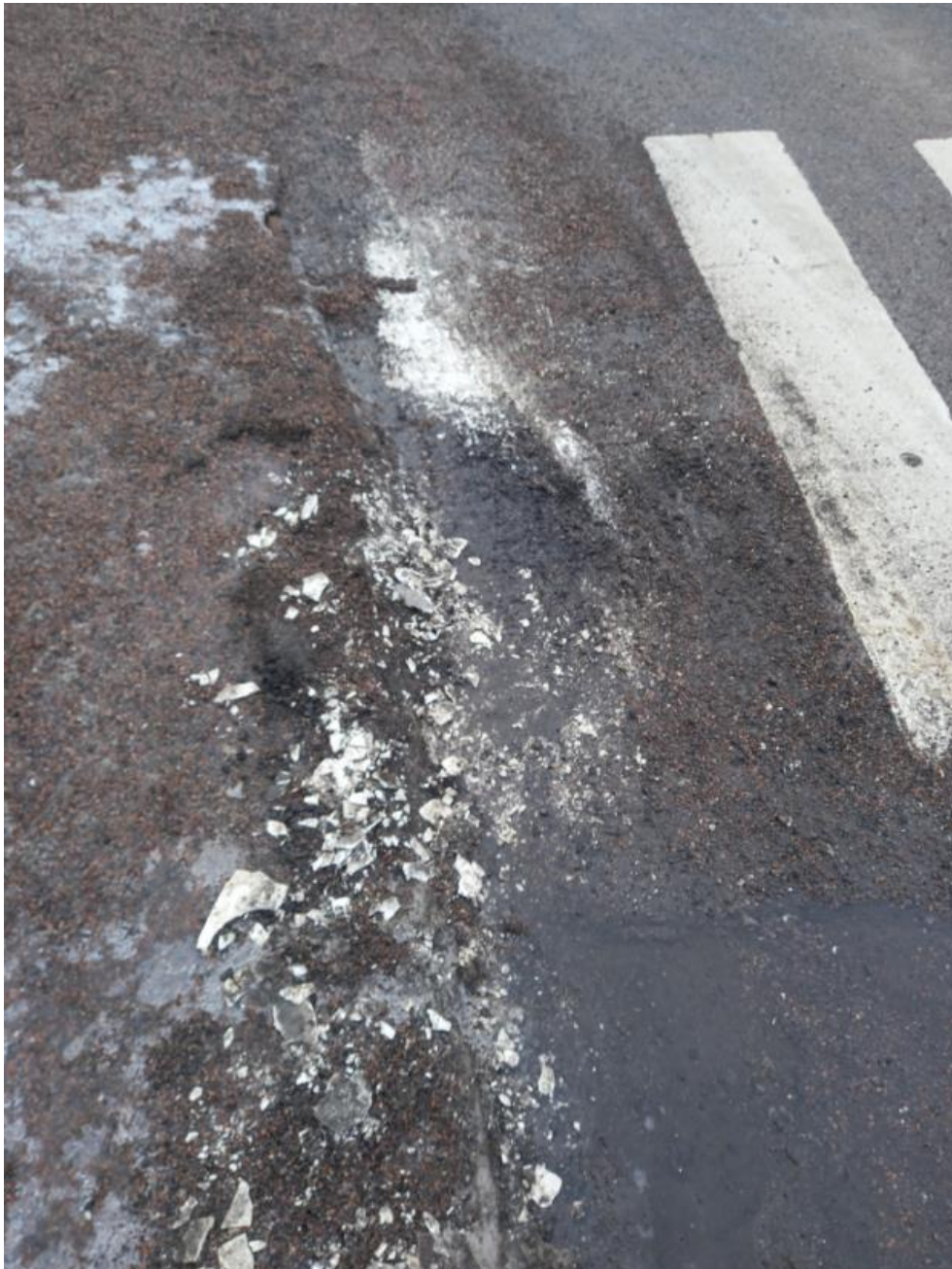
Kuva 3 Tiemerkinästä irronneita massan palasia

Kuvassa 3 höylä tai alusterä on repinyt tiemerkinästä palasia, jotka kulkeutuvat veden mukana hulevesiverkoston.