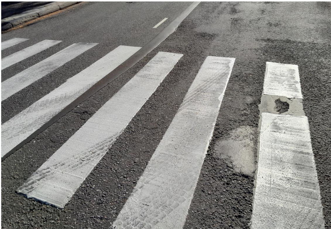
Kuva 5 Tiemerkinä, jota ei ole voitu tehdä kokonaan huonon tien kunnon vuoksi.

tien pinnan tasaisuus, jos pinnassa on kuoppia, sula massa valuu epätasaisesti, mikä heikentää merkinnän laatua. Kuvassa 5 näkyy, miten epätasainen tienpinta vaikuttaa heikentävästi tiemerkin laatuun. (15.)