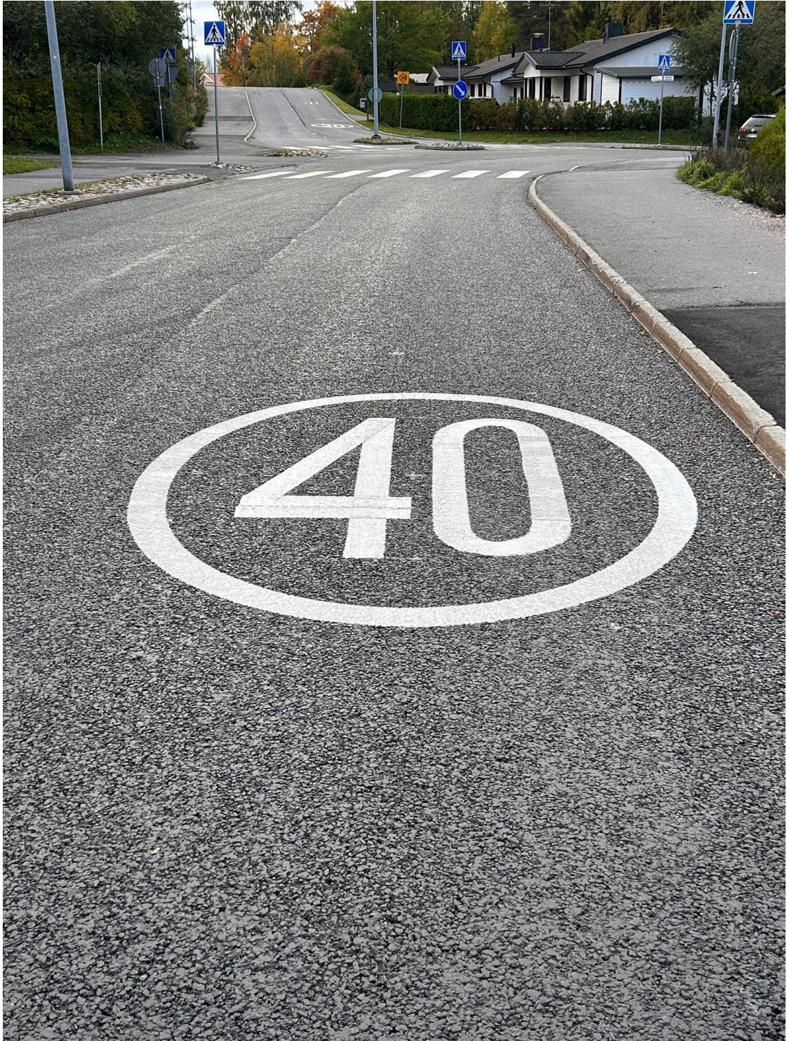
Kuva 1 Tiemerkinä, joka on tehty tiemerkinämässalla.

Massamerkinöihin voidaan lisätä lasihelmiä parantamaan heijastavuutta, erityisesti pimeällä ja märissä olosuhteissa. On kuitenkin huomioitava, että