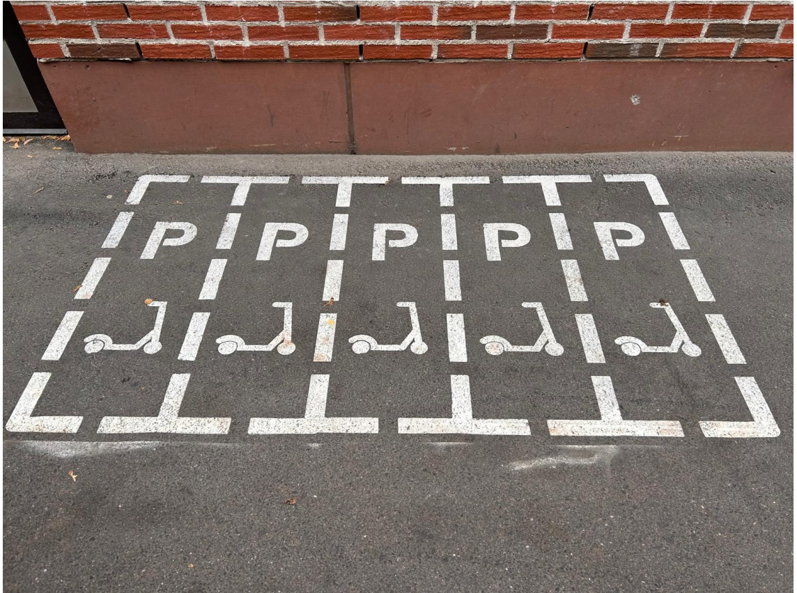
Kuva 2 Tiemarkintämaalilla tehdyt potkulautojen pysäköintiruudut.