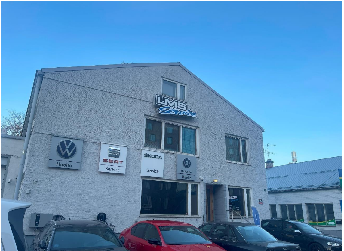
Kuva 3. LMS-Servicen toimipiste

Tässä kappaleessa käydään läpi laadittu suunnitelma autonhoito-osaston perustamisesta LMS-Servicen turun toimipisteen yhteyteen.