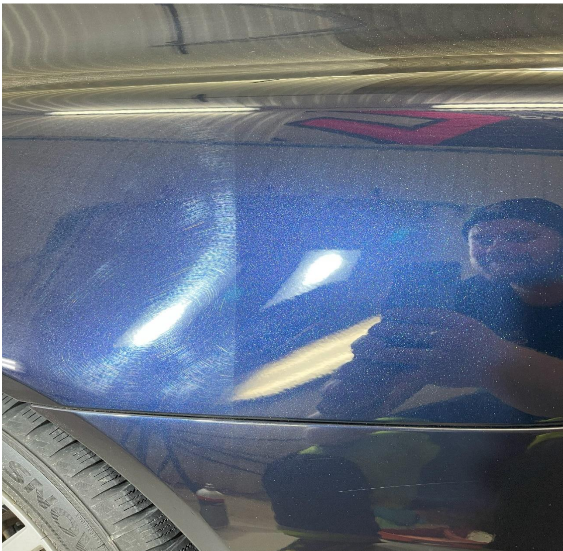
Kuva 1. Auton maalipinta ennen (vas.) ja jälkeen (oik.) kiillotuksen.