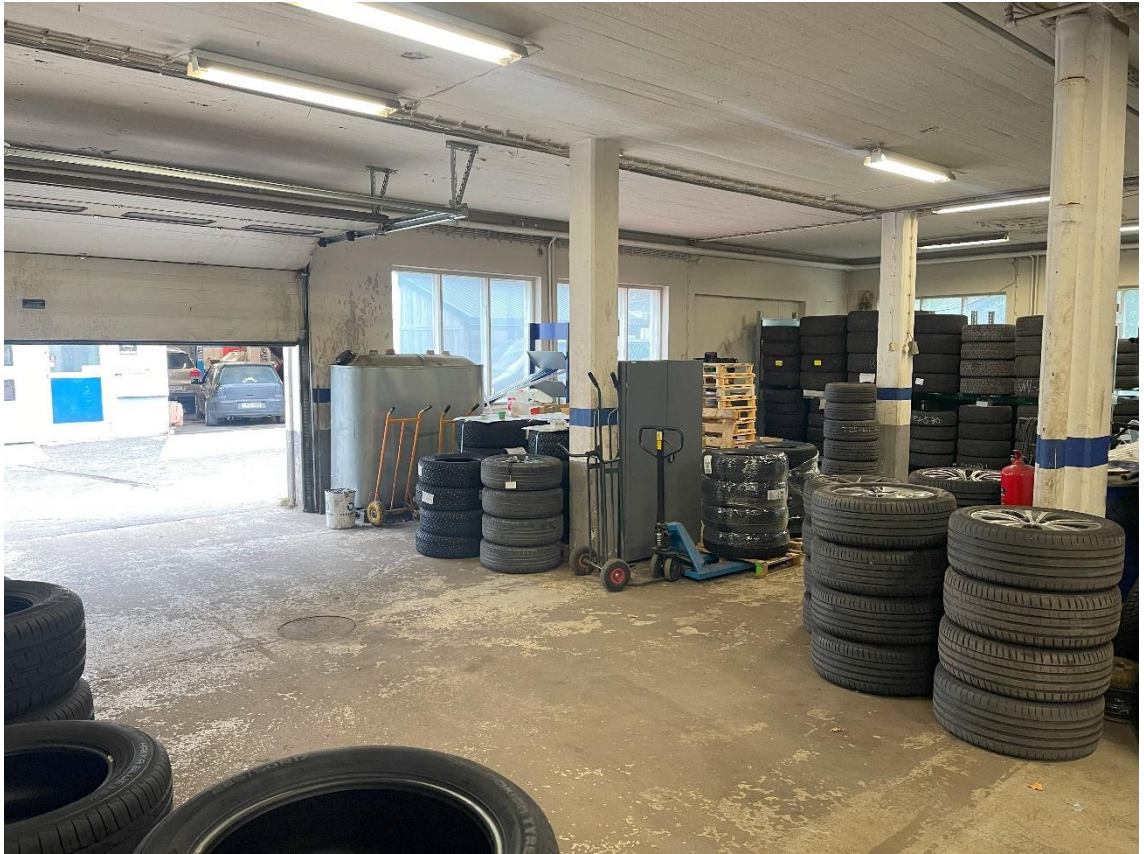
Kuva 4. Autonhoitopuolen käyttöön kaavailtu tila nykyhetkellä

Alla olevassa kuvassa on suunnitelma siitä, miten tila tullaan käyttämään hyödyksi. Pesupaikka tulee olemaan heti oven edessä. Työpisteelle voidaan ajaa ajoneuvo esimerkiksi kiillotusta tai sisustan puhdistusta varten ja pesupaikka jää vielä vapaaksi, mikäli tulee tarve saada toinen auto sisään. Tilassa olevien tukitolppien takia työpisteelle ajettava auto pitää ajaa vinoon. Pesupaikan edessä on kuitenkin tyhjää tilaa, joten pesupaikalla olevaa autoa voidaan siirtää hetkellisesti eteenpäin, mikäli työpisteeltä tarvitsee ajaa auto ulos. Pesupaikan ja työpisteen väliin on tarkoitus asentaa sivuun vedettävä pressuverho eristämään pesupaikka muusta tilasta, jottei roiskuva vesi haittaa työpisteen toimintaa.