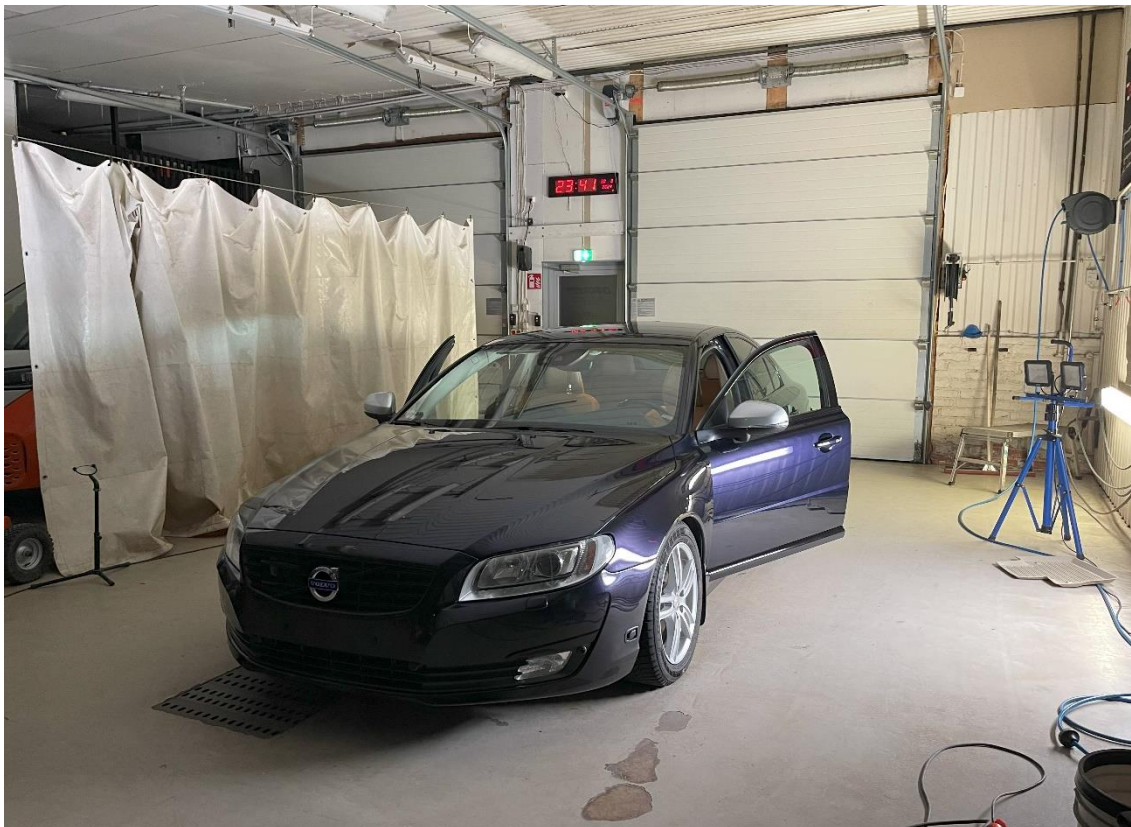
Kuva 2. Kiillotettu ja keraamisella pinnoitteella suojattu auto.

Näin ajoneuvon maalipinta on saatettu takaisin alkuperäiseen loistonsa ja suojattu asianmukaisesti.