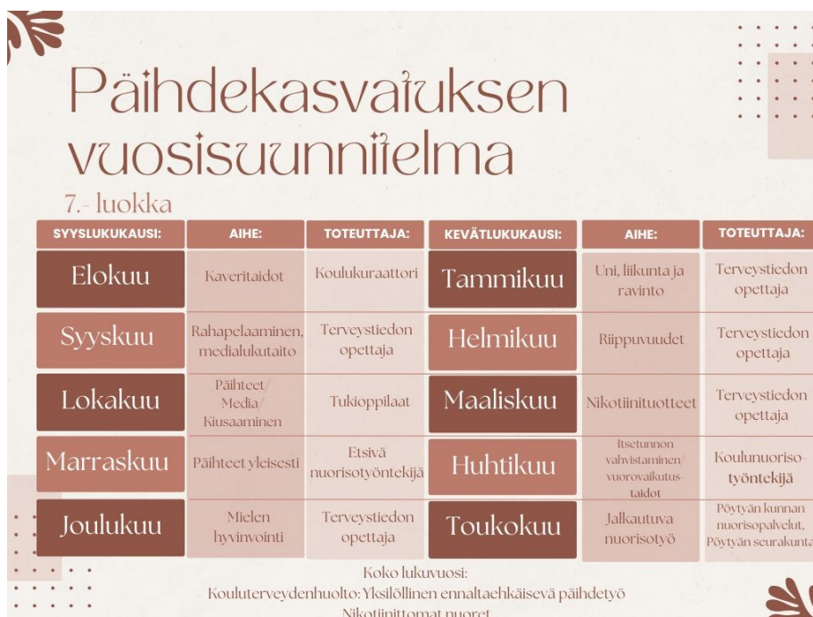
Kuva 1. Päihdekasvatuksen vuosisuunnitelma 7.-luokalle.

Kehittämistyömme tuotoksena syntyi päihdekasvatuksen vuosisuunnitelma Elisenvaaran yhtenäiskoulun Elisenvaaran yksikölle (Liite 4.). Kehittämistyön tuotoksen tarkoitus oli luoda yhtenäinen, selkeä ja jatkuva päihdekasvatussuunnitelma koulun sisäisille- ja ulkoisille toimijoille. Tuotoksesta jokainen toimija näkee selkeästi omat vastualueensa sekä aikataulun päihdekasvatuksen toteutukseen (Kuva 1.). Tuotos toteutettiin Canva työkalua käyttäen. Tuotos on tehty tulostettavaksi, sekä helposti muokattavaksi vuosittaisia resursseja ajatellen. Tuotoksessa on huomioitu myös visuaalinen näkökulma. Tuotos on tehty Canvan ilmaisversiolla. Canvan ilmaisversio saa tekijänoikeuksien mukaan käyttää kolmansille osapuolille jaettavissa asiakirjoissa (Canva 2024). Jaamme käyttöoikeuden pohjaan toimeksiantajalle. Toimeksiantajalta olemme saaneet tuotoksesta hyvän palautteen.