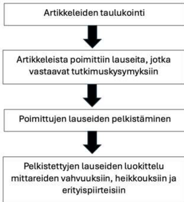
Kuvio 7. Aineiston analyysin kulku.

tähän opinnäytetyön, sillä aineistoista löytyvää tietoa pystyttiin soveltamaan aiheeseemme sopivaksi. Tämän lisäksi sepsiksestä löytyi paljon eri aineistoja ja taulukointi, ryhmittely ja organisointi helpottivat kerätyn aineiston hallintaa ja analysointia.