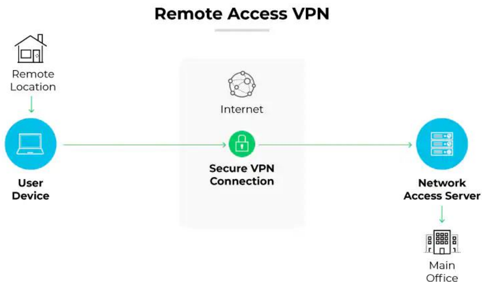
Kuva 2. VPN-etäyhteys (Palo Alto Networks)

Yritykset käyttävät VPN-yhteyksiä suojattujen etäyhteyksien luomiseen työntekijöilleen. Tämä on erityisen tärkeää etätyön yleistyessä, sillä VPN mahdollistaa työntekijöille turvallisen pääsyn yrityksen sisäisiin verkkoihin ja työkaluihin. Kuva 2 esittää etäyhteyden työntekijän sijainnin ja työpaikan välillä. VPN-yhteys salaa kaiken yrityksen ja työntekijän välillä kulkevan liikenteen, mikä vähentää tietovuotojen ja kyberhyökkäysten riskiä. (Microsoft.)