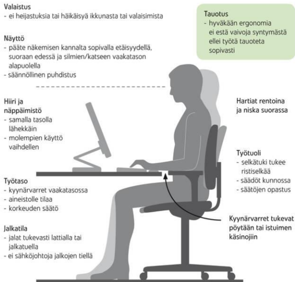
Kuva 4. Hyvä näyttöpäätetyöpiste istuen

Ergonomian huomioiminen työpaikalla parantaa työntekijöiden hyvinvointia ja vähentää sairauspoissaoloja. Hyvin suunniteltu työympäristö ja ergonomiset työvälineet auttavat työntekijöitä suoriutumaan tehtävistään tehokkaammin ja mukavammin. Tämä ei ainoastaan paranna työntekijöiden terveyttä, vaan myös lisää työn tuottavuutta ja työtyytyväisyyttä. (Pihlajalinn 2024.)