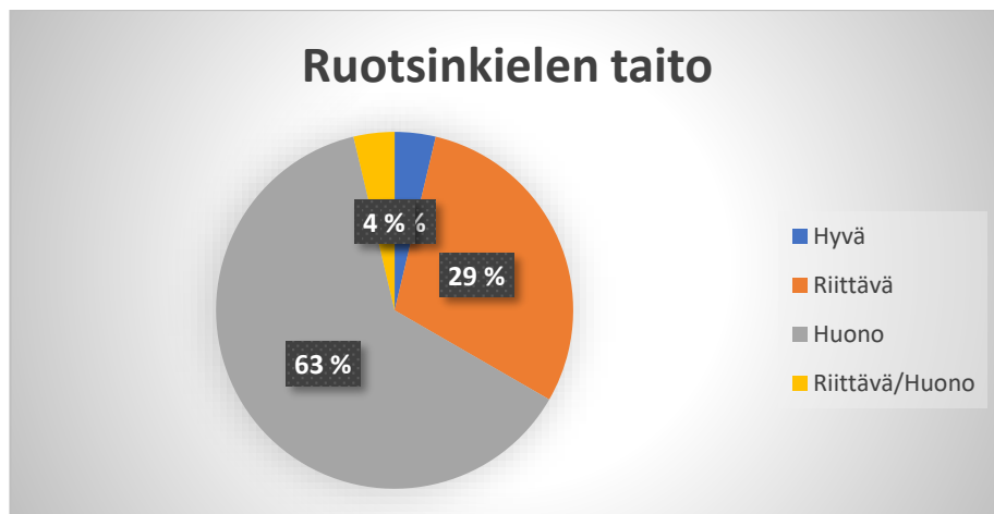
Kuvio 1. Ruotsin kielen taito (%-osuus)

Vastaajista 17, eli suurin osa, ilmoitti ruotsin kielen taitonsa olevan huono, yksi ilmoitti sen olevan hyvä, koska hänen äidinkieltensä on ruotsi, 8 ilmoitti sen olevan riittävä ja yksi ilmoitti sen olevan riittävä/huono. Alla olevassa kuviossa on vastaukset esitelty prosentiosuuksina, mistä selvästi näkee, että suurin osan vastaajista (63 %) ilmoittaa, että heidän ruotsin kielen taitonsa on huono (kuvio 1).