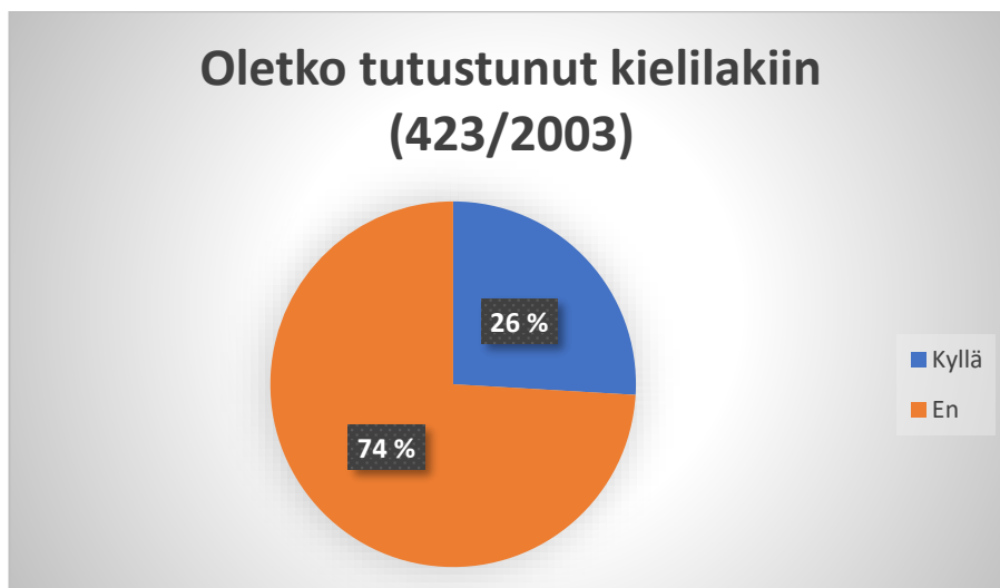
Kuvio 5. Oletko tutustunut kielilakiin (423/2003) (%-osuus)

Vastanneista eli 20 kpl vastasi, ettei ole tutustunut kielilakiin ja vain 7 kpl ilmoitti, että on tutustunut kielilakiin. Alla olevassa kuviossa on vastaukset esiteltä prosenttiosuuksina, mistä selvästi näkee, että suurin osan vastaajista (74 %) ilmoittaa, että ei ole tutustunut kielilakiin (kuvio 5).