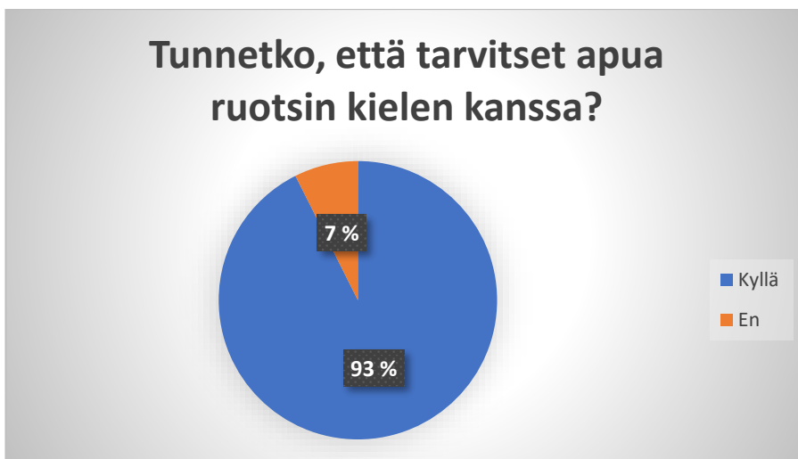
Kuvio 2. Tarvitseeko apua ruotsin kielen kanssa (%-osuus)

Kysymys 2 a) Jos vastasit edelliseen kysymykseen kyllä, osaatko sanoa, että minkälaista apua kaipaisit?