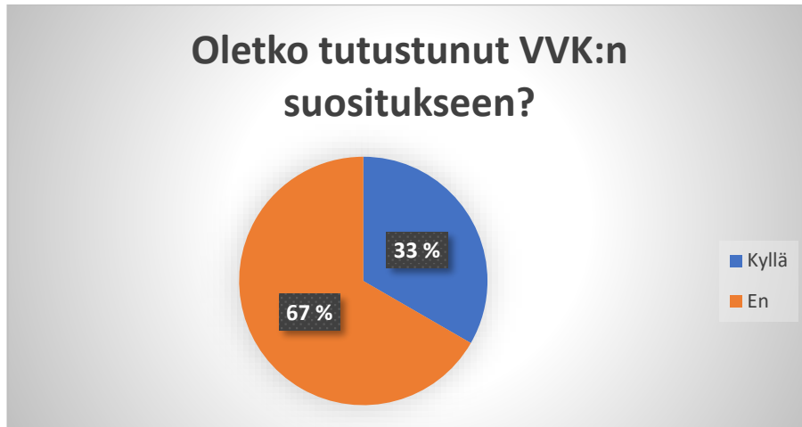
Kuvio 3. Oletko tutustunut VVK:n suositukseen? (%-osuus)

myynti-ilmoituksia julkaistaessa. Alla olevassa kuviossa on vastaukset esitelty prosenttiosuuksina, mistä selvästi näkee, että suurin osan vastaajista (67 %) ilmoittaa, ettei ole tutustunut VVK:n suositukseen (kuvio 3).