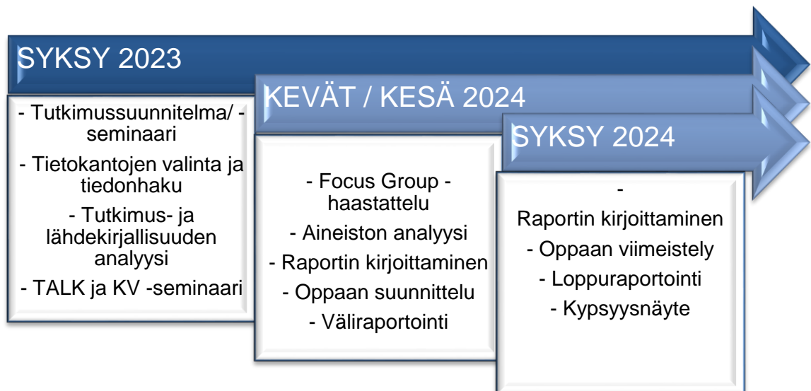
Kuvio 2. Opinnäytetyön aikataulusuunnitelma.

Projektiviestintä oli projektipäällikön eli opinnäytetyön tekijän vastuulla, hänen tehtävä oli pitää työelämän edustaja sekä opettajatuutori ajan tasalla projektin etenemisestä sekä mahdollisista muutoksista projektin aikana. Viestintä toteutettiin sähköpostin välityksellä sekä Teams -tapaamisilla, joita järjestettiin tarpeen mukaan.