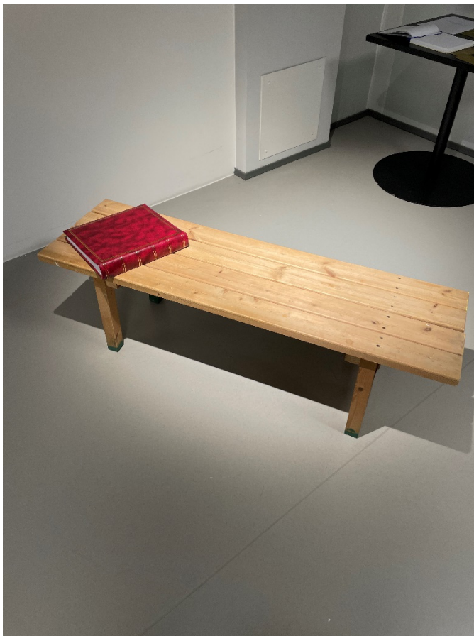
Kuva 10. Saunalaudepenkki ja valokuva-albumi

Olen halunnut tuoda näyttelytilaan saunan kiireettömyyttä saunalaudepenkillä, johon katsoja voi rauhassa istahtaa selaamaan valokuva-albumia (Kuva 10). Aluksi valokuvien piti olla seinällä ruskeisiin kehyksiin ripustettuina, mutta kaipasin kokonaisuuteen jotain inttiimpää vivahdetta. En halunnut, että katsoja voi kävellä galleriatilaan ja silmäillä ympärilleen, minkä jälkeen lähteä. Ei siinäkään ole tietysti mitään vikaa. Halusin kuitenkin saada katsojan pysähtymään jonkin asian äärelle ja niin, että hän voisi tarkastella asiaa itsekseen rauhassa omaan tahtiin. Näin sain idean valokuva-albumista ja vielä stereotyyppisen näköisestä isosta punaisesta valokuva-albumista, joita löytää vanhempien luota kirjahyllystä, johon on kerätty lapsuuskuvia.