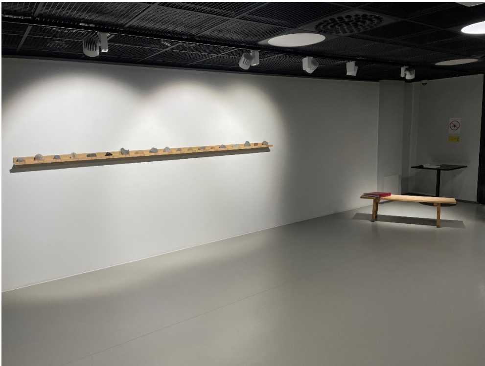
Kuva 8. Yleiskuva teoksesta Galleria NOSTE:lla

ei voi galleriatilaan nähtäville tuoda. Koen kuitenkin dokumentaarisen osion osaksi teosta. Hyllyillä rivissä olevat eri saunoista kerätyt kiuaskivet kuvassa 9, kertovat katsojalle miten erilaisia kiuaskiviä on, mutta samalla myös miten erilaisia saunoja on. Erilaisiin saunoihin ja niiden kiukaisiin soveltuvat erilaisia kiuaskivet.