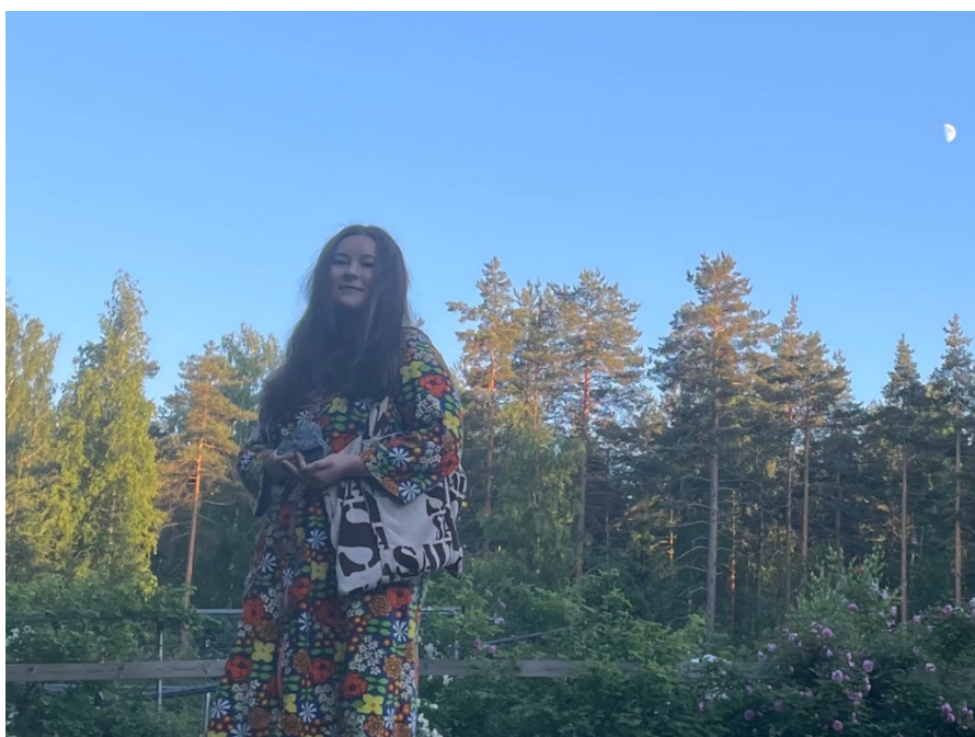
Kuva 4. Valmiina saunaan

Olin aina varautunut äkkinäisiin saunakutsuihin. Minulla oli saunakassi aina valmiina eteisessä tohveleineen, pesuaineineen, pyyhkeineen ja juomapulloineen. Mukana oli myös uima-asu ja kukkainen kylpytakki. Kyseinen kylpytakki on suosikki "saunavaatteeni" (Kuva 4). Usein saunajuomana kassissa oli pillimehua. Saunoja kiertäessä kohtasin paljon erilaisia ihmisiä, mitä pidän itse saunojen lisäksi suurena rikkautena. Stereotypia hiljaisista suomalaisista, jotka eivät pidä "small talkista" ei päde millään lailla saunaan. Uskon, että aion jatkossakin ottaa irtiotoja arjesta menemällä erilaisiin saunoihin saunomaan.