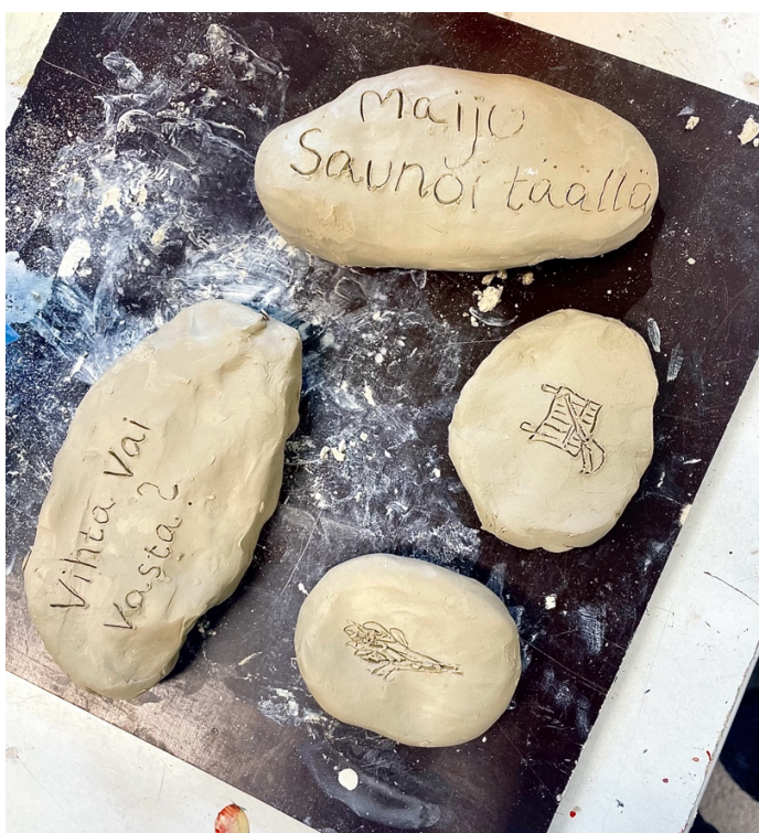
Kuva 5. Saviluonnokset

Oli kuitenkin haikeaa hyvästellä idea erilaisten asioiden kaivertamisesta, mutta aikataulujen puitteissa se ei ollut mahdollista ja halusin ehtiä eri saunoihin sen sijaa, että olisin palannut aina viemään kiven. Jos minulla olisi ollut enemmän aikaa tai olisin vähentänyt saunojen määrää, olisin voinut toteuttaa idean. Janosin kuitenkin päästä saunomaan mahdollisimman moneen eri saunaan.