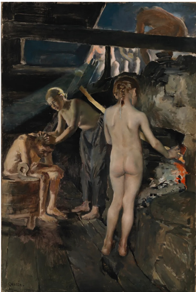
Kuva 1. Akseli Gallen-Kallela, Saunassa, 1889