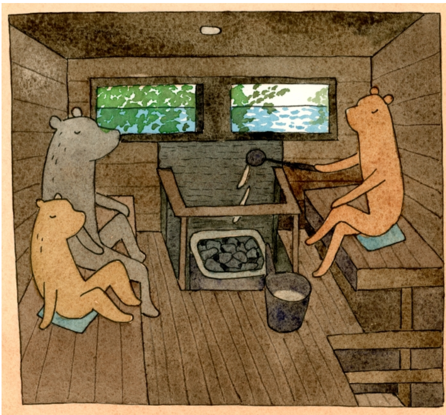
Kuva 3. Pive Toivonen, Aamusauha Örössä, 2022 (Toivonen 2024)