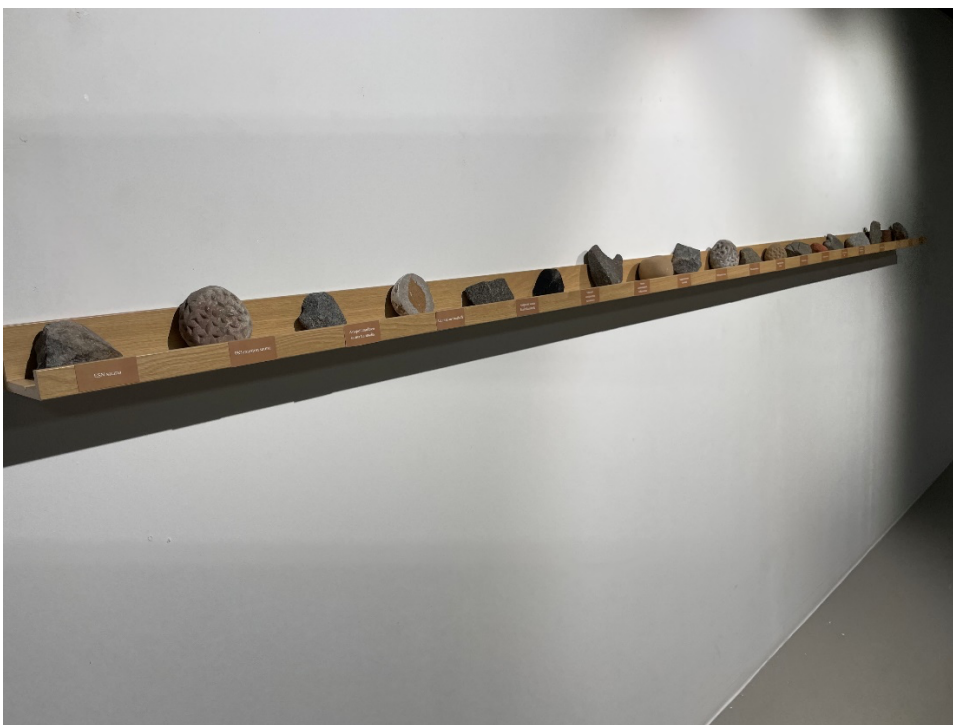
Kuva 9. Lähikuvaa kivistä