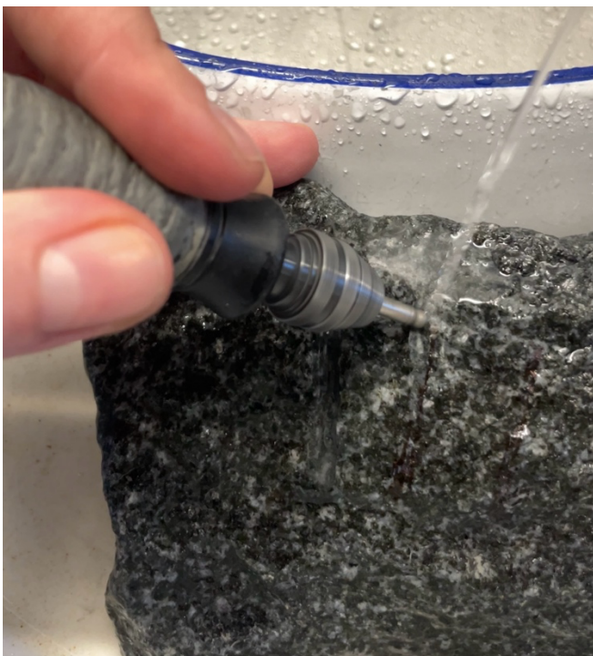
Kuva 6. Kaivertaminen veden avulla monitoimityökalulla

Myöhemmin kohtasin uuden arvoituksen, kun huomasin timanttiterien kuluvan nopeasti puhki. Sen huomaa siitä, kun terästä katoaa timanttipinnoite ja jäljelle jää sileää metallia. Ensin ajattelin sen olevan kiinni itse tekijästä, minusta, mutta kysyin varmuuden vuoksi neuvoa ohjaajaltani. Olen kuitenkin kaivertanut kiveä samalla työkalulla useita kertoja tuhoamatta yhtäkään terää. Ohjaajani ehdotti syyn olevan timanttiterien laadussa. On olemassa edullisia timanttiteriä, joissa on karheudeltaan ohuempi ja sileämpi kerros timanttipäällystettä. Ne eivät kestä kovaa kiveä samalla tapaa, kuin kalliimmat timanttiterät, joissa on karheampi ja paksumpi timanttipäällyste. Lähdin etsimään uusia teriä. Oli kuitenkin hankalaa löytää pyöreäpäisiä timanttiteriä, kun valtaosa oli teräväkärkisiä, mutta onneksi rautakau-pasta löytyi lopulta sopivia. Ne toimivat kestävästi ja täydellisesti opettaen samalla minulle, että joskus on ihan hyvä panostaa työkalujensa laatuun, eikä aina etsiä halvimpia vaihtoehtoja.