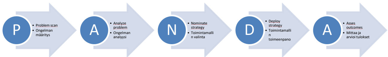
kuva 1. Ratcliffe, 2023, sivu 30,

PANDA - crime reduction model on yksi tietojohdantamisen toimintamalli (kuva 1). Malli on sovellettavissa kaiken rikollisuuden torjuntaan. Ihmiskauppa on usein piilorikollisuutta ja sen torjunnassa joudutaan huomioimaan laajojakin kokonaisuuksia, jotka kaikki eivät edes ole niin sanotusta perinteisestä poliisitoiminnasta riippuvaisia. Siihen liittyvä projektinhallinta on vaativaa ja sen vastaisessa toiminnassa on mukana useita eri toimijoita, joten PANDAn kaltainen jäsennelty ajattelumalli on hyödyllinen myös siinä. Näillä perusteilla päädyin sisällyttämään PANDAn teoreettiseen viitekehykseeni päälle liimatun oloisten määritelmien sijasta. Esittelen tässä luvussa PANDAn yleisemmällä tasolla ja hyödynnän sitä soveltuvin osin opinnäytetyöni johtopäätöksissä.