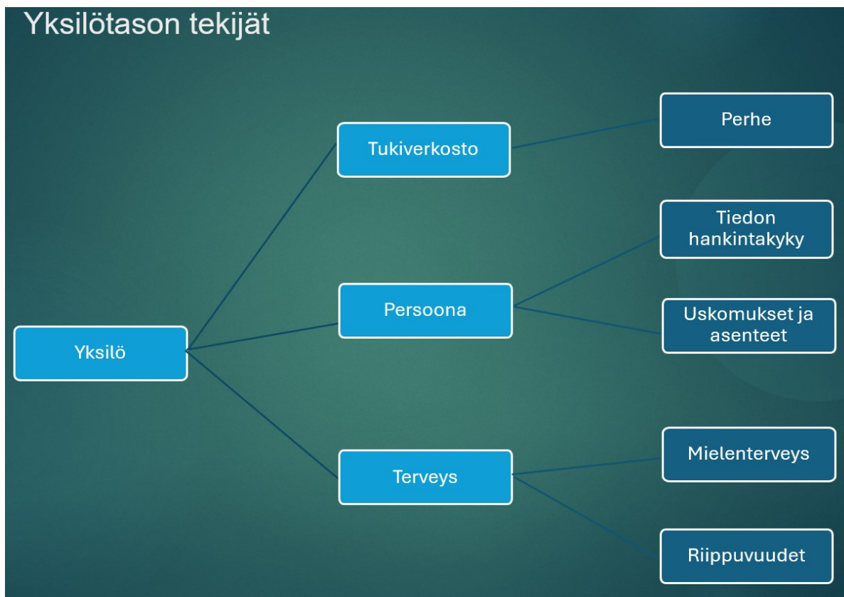
Kuva 4. Yksilötason tekijät

Kyselytutkimuksessa nousi esille kolme nuorten velkaantumiseen liittyvää merkittävintä yksilötason tekijää. Näitä tekijöitä olivat: tukiverkosto, persoona sekä terveys. (Kuva 3.) Tässä kappaleessa näitä yksilötason tekijöitä selitetään tarkemmin.