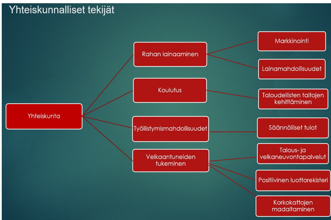
Kuva 5. Yhteiskunnalliset tekijät

Kyselytutkimuksessa nousi esille neljä yhteiskunnallista tekijää, jotka vaikuttavat nuorten velkaantumiseen. Nämä keskeiset tekijät ovat: rahan lainaaminen, koulutus, työllistymismahdollisuudet sekä velkaantuneiden tukeminen (Kuva 3).