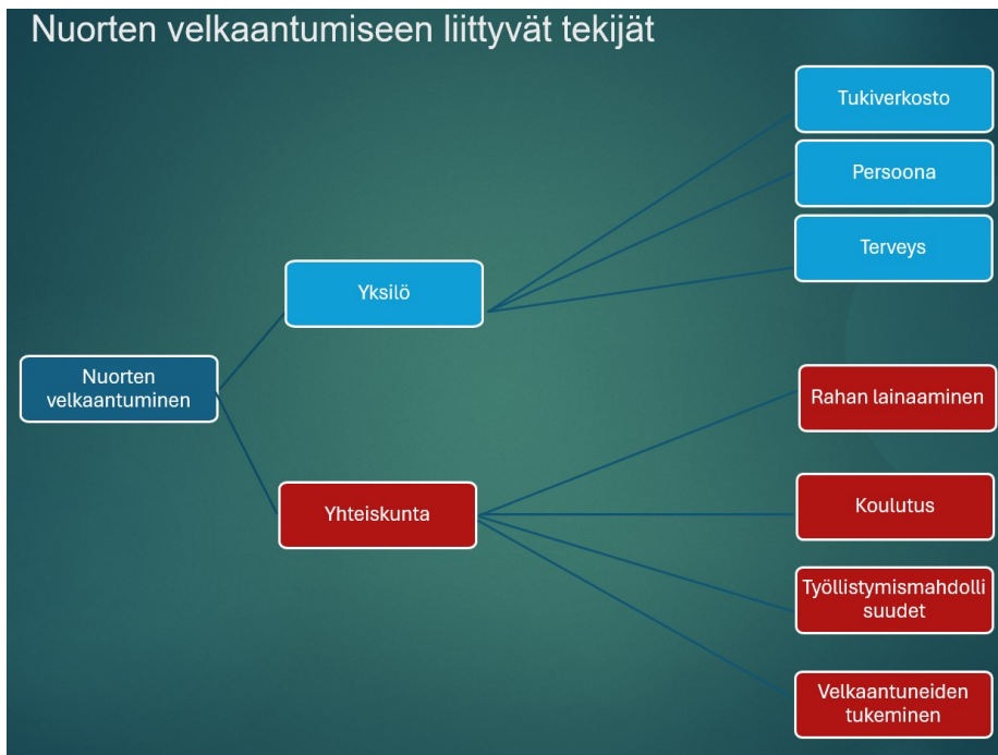
Kuva 3. Nuorten velkaantumiseen liittyvät tekijät

Vastauksien pohjalta luotiin kolme kaaviota liittyen nuorten velkaantumiseen. Kaaviot muodostettiin kyselytutkimuksen vastauksien pohjalta luoduista luokista. Näiden kaavioiden avulla pyritään yhdistämään kyselytutkimuksen eri vastaukset loogiseksi kokonaisuudeksi.