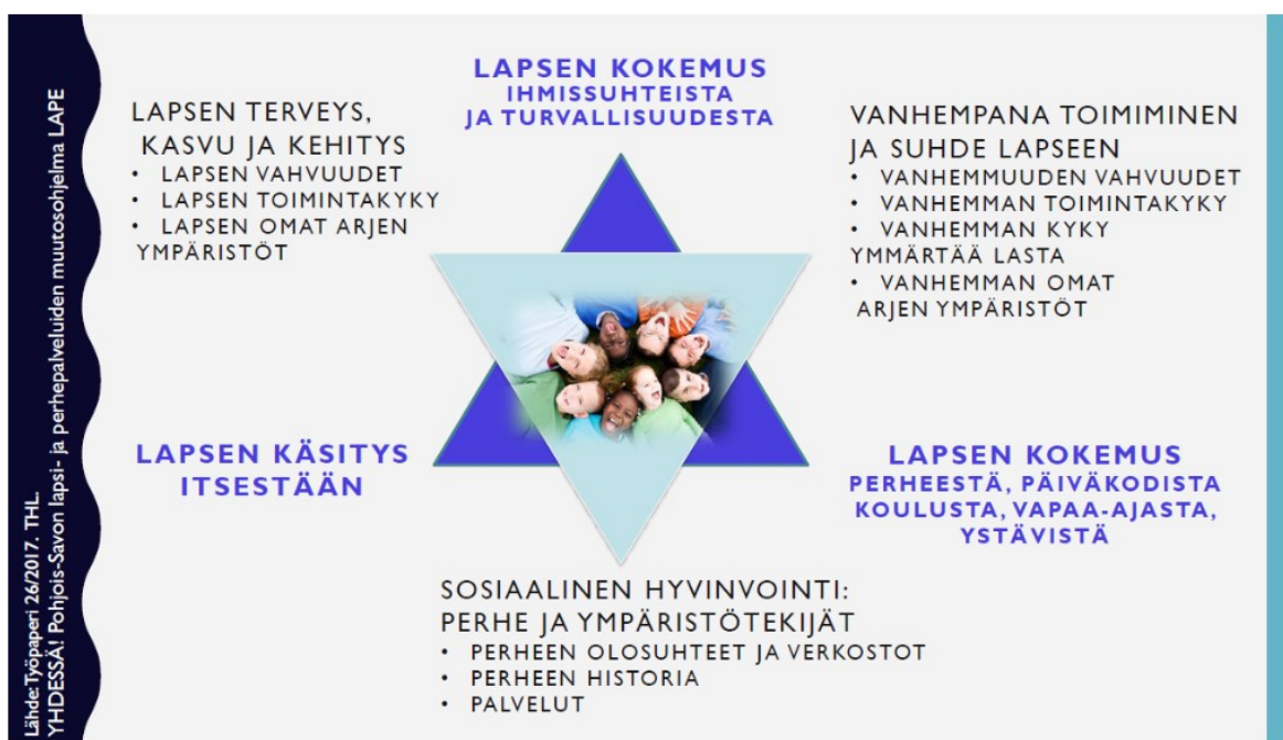
Kuva 2. Hyvinvoinnin tähti (Pohjois-Savon liitto, Lape-hanke 2018)

Yhtenä työkaluna Yhdessä aika -menetelmän käytössä on hyvinvoinnin tähti -arviointimalli (kuva 2). Sen avulla on mahdollista kartoittaa kaikkien osallisten, niin perheen kuin ammattilaistenkin käsitys kokonaistilanteesta. Sen sakaroihin on koottu arviointia helpottavia osioita kahdesta näkökulmasta, joista tummansinisen kolmion kärjet on tarkoitettu kartoittamaan lapsen kokemusmaailmaa ja vaaleansinisen kolmion kärjet taas auttavat ammattilaisia hahmottamaan koko perheen tilannetta. Hyvinvoinnin tähti on tarkoitettu kaikkien niiden käyttöön, jotka työskentelevät lasten ja perheiden kanssa. (Pohjois-Savon Liitto, Lape-hanke 2018.)