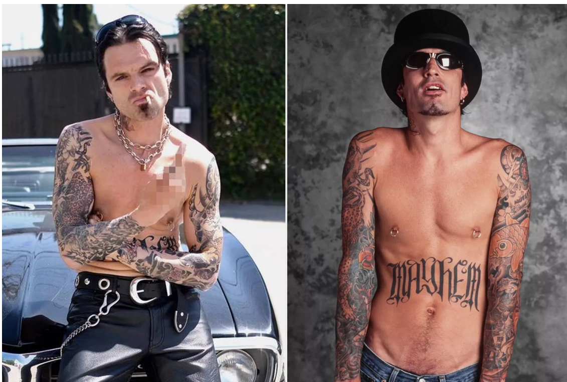
Kuva 5. Vasemmalla Sebastian Stan ja oikealla Tommy Lee (Gibson 2022).

Sebastian Stan esittää Pam & Tommy -sarjassa (2022) Tommy Leetä. Myös Stan on vahvasti meikattu ja hänelle on maskeerattu tatuoidut kädet (kuva 5). Stanin tunnistaa esittävän Leetä, mutta täydellinen kopio hän ei kuitenkaan ole. Sarjan katsoneena tunnistan, mistä Andersson puhuu: jotkin kohtauksista ovat myös ulkopuoliselle katsojalle todella ääripäähän vietyjä. Hyvien eettisten tapojen mukaan olisi ollut suotavaa antaa Anderssonin ja Leen vaikuttaa sarjaan ja sen sisältöön. Vaikka kyseessä on julkisesti käsitellyssä ollut tapahtuma, aiheuttaa se edelleen harmia tapahtuman osapuolille. Tästä herääkin kysymys, ovatko julkisuuteen nousseet tapahtumat eettisesti vähempiarvoisia vai tulisiko kunnioittaa sitä vähäistä yksityisyyttä, joka henkilöillä on?