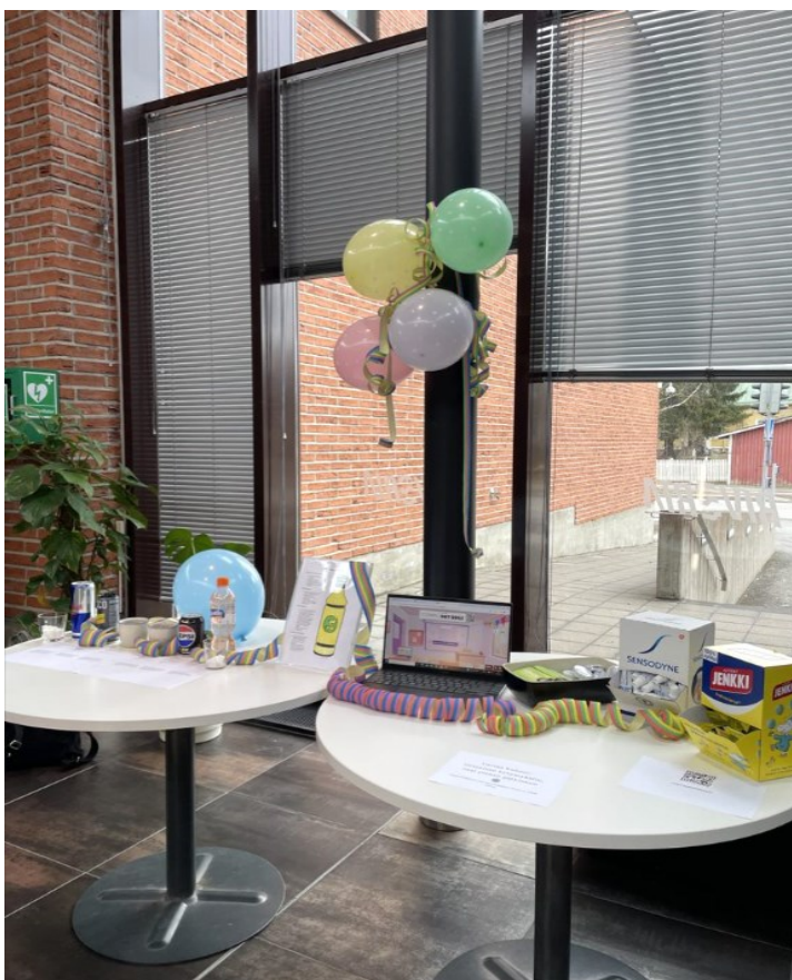
Kuva 1. Pop up -piste ennen tapahtuman alkua

Kun pisteellä jaettavat tuotteet olivat tiedossa, saimme suunnitelman lopullisesta pop up -pisteen toteutuksesta valmiiksi melko nopeasti. Osallistujia päätettiin osallistaa Kahoot-tietovisalla (liite 1), joka tehtiin työn teoriapohjan perusteella. Pop up -pisteelle tuotteet ostettiin kaupasta sekä kerättiin kotoa. Pop up -pistettä päätettiin koristella, jotta se olisi näyttävämpi ja houkuttelevamman näköinen. Koristelu toteutettiin vapputeeman mukaisesti ilmapalloin ja serpentiineillä (kuva 1).