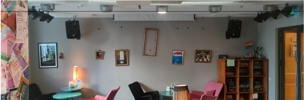
Kuva 3 Perehdytyskansion kansilehti