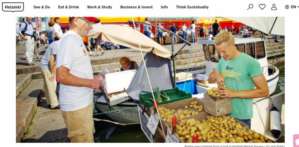
Kuva 3. Kauppatori kesällä (My Helsinki s.a.)

Kuvia eri vuodenaikojen ja sesonkien tuotteista oli muutamia. Näissä tuotteet olivat selkeästi kuvan pääpointti. Mansikat, sienet sekä uudet perunat näyttävät houkuttelevilta My Helsinki-verkkosivujen kuvissa. Kuvassa 2 näkyy kesäinen Kauppatori, jossa torimyyjä on myymässä uusia perunoita.