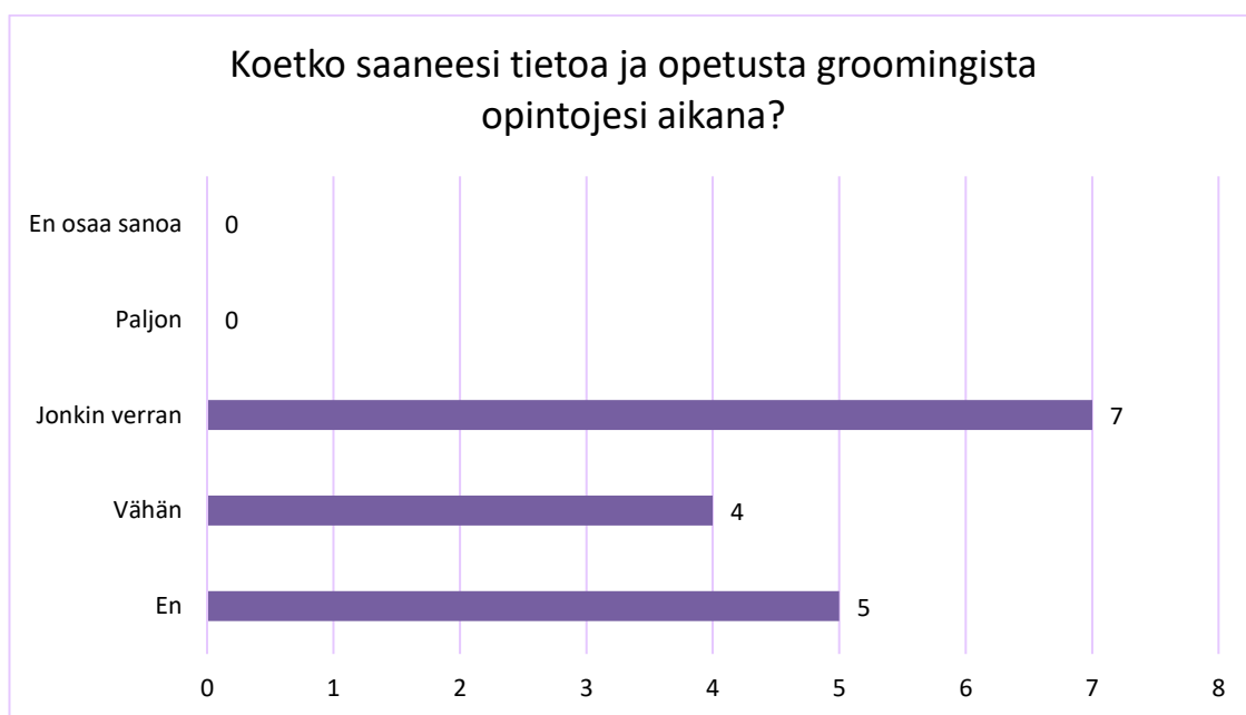
KUVIO 4. Sosionomiopiskelijoiden kokemus tiedon saannista opintojen aikana groomingiin liittyen (n = 16).

Opinnäytetyömme kohdejoukkona olleet TAMK:n sosionomiopiskelijat saivat kertoa kyselyn (Liite 1) viimeisessä osiossa (kysymys 4.1.) kokemuksiaan liittyen opintojensa aikana saamiinsa tietoihin groomingista. Kuviosta 4 käy ilmi, että seitsemän (7) vastaajista kokee saaneensa tietoa jonkin verran, neljä (4) vähän ja viisi (5) ei koe saaneensa tietoa.