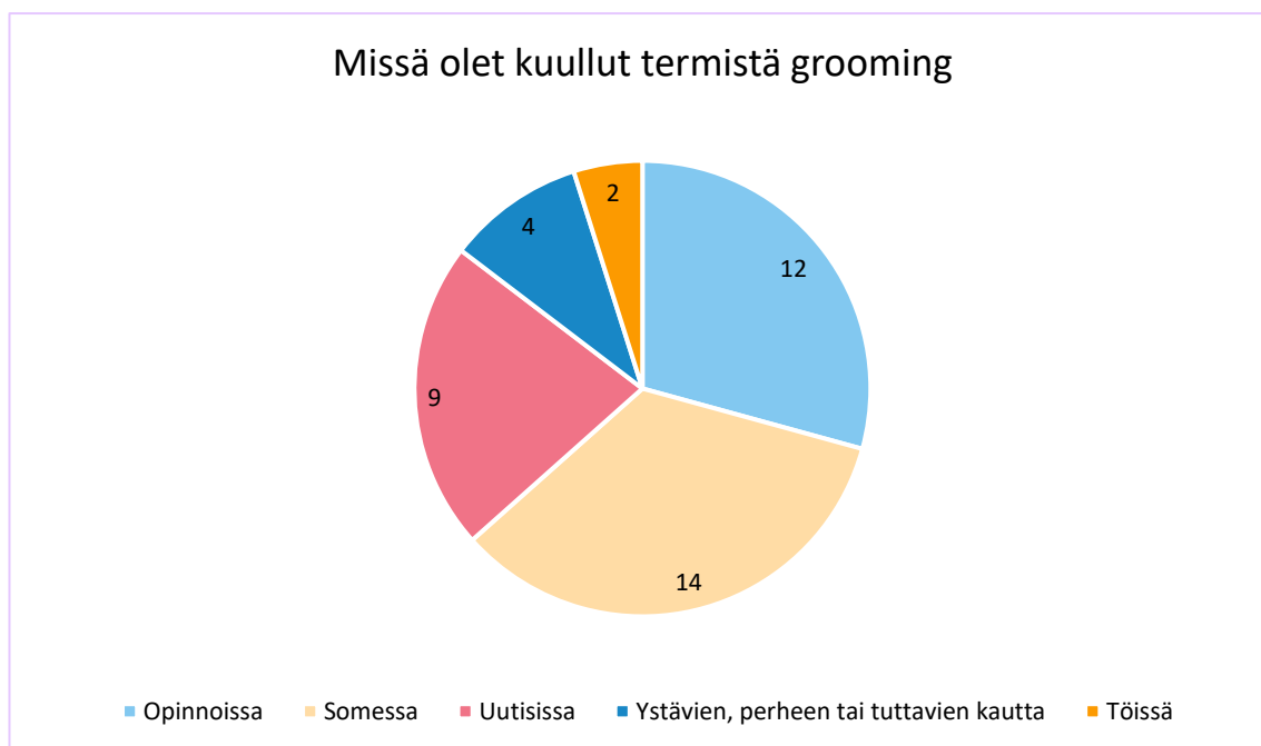
KUVIO 2. Vastaajien tietolähde grooming-termiin (n = 16).

Yleisesti voidaan siis todeta, että termi on tuttu sosionomiopiskelijoiden keskuudessa. Nykypäivänä grooming-termi on sosionomiopiskelijoiden keskuudessa tunnettu, mutta sisällöllisesti sitä ei osata selittää tai kuvata sen tarkemmin. Yksi (1) vastaajista on vastannut tietävänsä termin ja osaavansa kertoa siitä paljon (Kuvio 1).