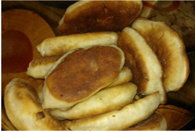
KUVA 6. Perinteisiä ukrainalaisia leivonnaisia. (Lappalainen 2013.)

Lasten siirtyessä toiseen tilaan kahvittelun jälkeen leikkimään jatkoimme keskustelua suvun perinteistä ja samalla jaoimme vanhemmuuteen liittyviä huolia. Keskustelun tarkoituksena oli lisätä kasvatustietoisuutta siitä, mitä perinteitä omalta perheeltä ja suvulta tahtoo siirtää omille lapsilleen. Voimavaraympyrä oli toisella toimintakerralla koettu toimivaksi menetelmäksi, joten ajattelimme hyödyntää sitä palautteen keräämisessä kehittämiskohdeympyrän muodossa. Koska viimeisellä toimintakerralla kävijöistä puuttui suurin osa, päätimme jalostaa ideaa palautteen keräämisestä pidemmälle.