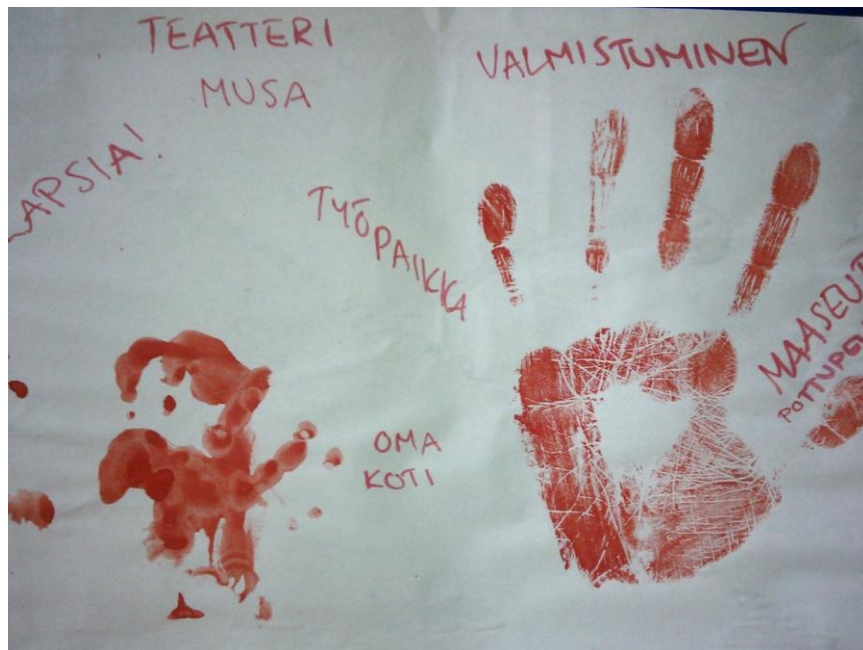
KUVA 2. Unelmakartta. (Lappalainen 2013.)

Työvaiheisiin kuului käsimaalauksen liimaaminen kartongille ja omien unelmien nimeäminen ja kirjaaminen ”unelmakarttaan”. Lopuksi unelmakartasta sai kertoa haluamiaan asioita, kaikkea ei ollut pakko kertoa. Käsite ”unelma” ei ollutkaan niin yksinkertainen selittää ymmärrettävästi. Tämän olimme havainneet jo viime kerralla ”voimavara”-teeman kohdalla ja se nousi esiin joka kerralla. Toimintakerta oli rauhallinen ja ilmapiiri mukava ja avoin. Selvisimme suomen kielellä, molemmin puolin oli rohkeutta selvittää väärinkäsityksiä.