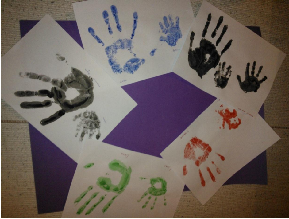
KUVA 1. Äiti-lapsiryhmän maalauksia. Äidit maalasivat vesivärillä oman ja lapsensa käden. (Lappalainen 2013.)

Haasteeksi porrastetussa toiminnassa muodostui ohjaamisen selkeys. Kaikille oli tärkeää antaa samat yksityiskohtaiset ohjeet. Ohjeistuksen antaminen ymmärrettävällä suomeksi ja englanniksi oli yllättävän haastavaa. Tämä nousi esiin ryhmätapaamisten myöhemmässäkin vaiheessa. Valmis malli pöydällä ohjaajan käden kuvasta antoi vinkkiä, mitä tehdään. Mallittaminen toimi yhtenä keinona, kun sanat eivät riittäneet luomaan yhteisymmärrystä. Useimmat äideistä tarvitsivat rohkaisua ”sotkemisessä” ja myös apua maalauksessa esimerkiksi vauvan käsien pesemisessä tai sylittelemisessä. Tämä vei ohjaajan huomion. Toimintapisteillä, joissa ohjaaja ei ollut koko ajan läsnä, olisi ollut hyvä olla kirjalliset ohjeet, joiden avulla äidit olisivat päässeet itsenäisesti työskentelemään ohjaajan puuttuessa. Kaikki äidit saivat työt tehtyä lastensa kanssa, mutta touhun lomassa jäi joillekin äideistä kertomatta, mihin työtä jatkossa käytetään.