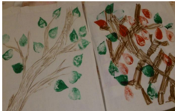
KUVAT 4 ja 5. Lapsi työn touhussa. Kangaskassien askartelua kerhossa. (Lappalainen 2013.)

Kankaanpainannon jälkeen päätimme jatkaa kahvitelulla ja maistelemalla perinneruokia, mitä olimme itse kukin tuoneet pöytään. Kuvan 6 leivonnaiset olivat varsin maistuvia perinteisiä ukrainalaisia leivoksia.