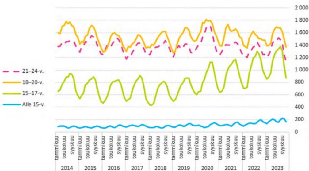
Kuva 1. Rikoslakirikoksista epäillyiksi kirjatut nuoret ikäryhmittäin 100 000 ikäryhmään kuuluvan kohden kuukausi tasolla 2014–2023, 3 kk liukuva (Kuva: Sutela 2024, 29).

Alla (kuvassa 1) on esitelty rikoslakirikoksista epäillyn asemaan kirjattujen nuorten määrä ikäryhmittäin 100 000 ikäryhmään kuuluvaa kohden kuukausi tasolla vuodesta 2014 lähtien. Kuviosta on todettavissa, että alle 21-vuotiaiden kolmessa eri ikäryhmässä sekä 21–24-vuotiaiden nuorten ryhmässä rikollisuuskehitys on pysynyt aika tasaisena vuoteen 2020 saakka. Koronapandemian alussa 21–24-vuotiaiden nuorten ryhmän osalta on nähtävissä selkeä hetkellinen nousu. Samalla on todettavissa, että sekä alle 15-vuotiaiden että 15–17-vuotiaiden ryhmässä kasvava suunta on alkanut kehittyä viimeistään koronapandemian aikaan vuonna 2020. Jokaisen ikäryhmän kohdalla kuvasta on hyvin nähtävissä rikosepäilyjen kausittainen luonne. (Sutela 2024, 29.)