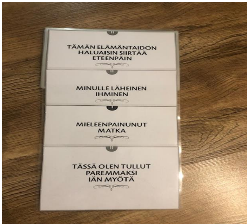
Kuva 9. Myönteisen muistelun kortit