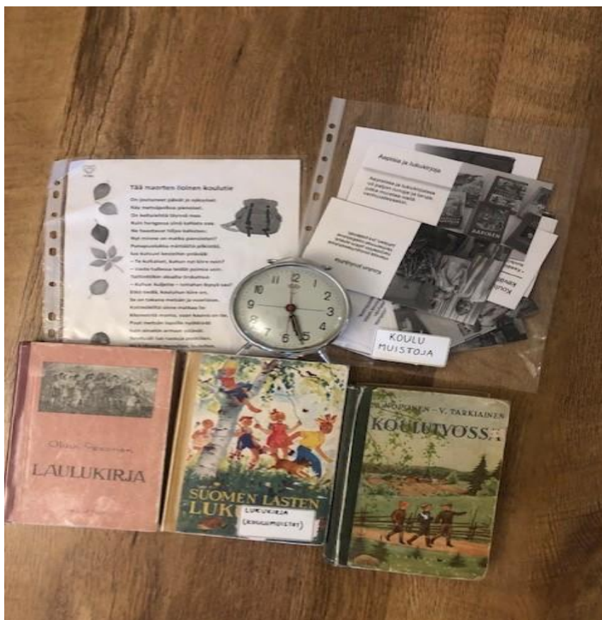
Kuva 7. Koulumuistoja-tuokio.