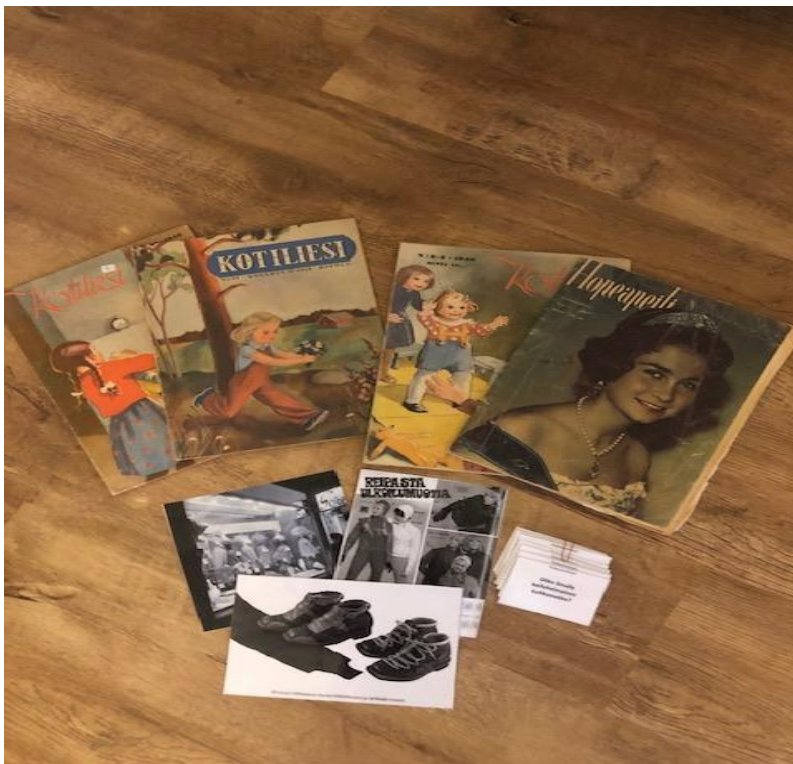
Kuva 6 .Pukeutuminen ja muoti- tuokio. Valokuvat (Vahvike)