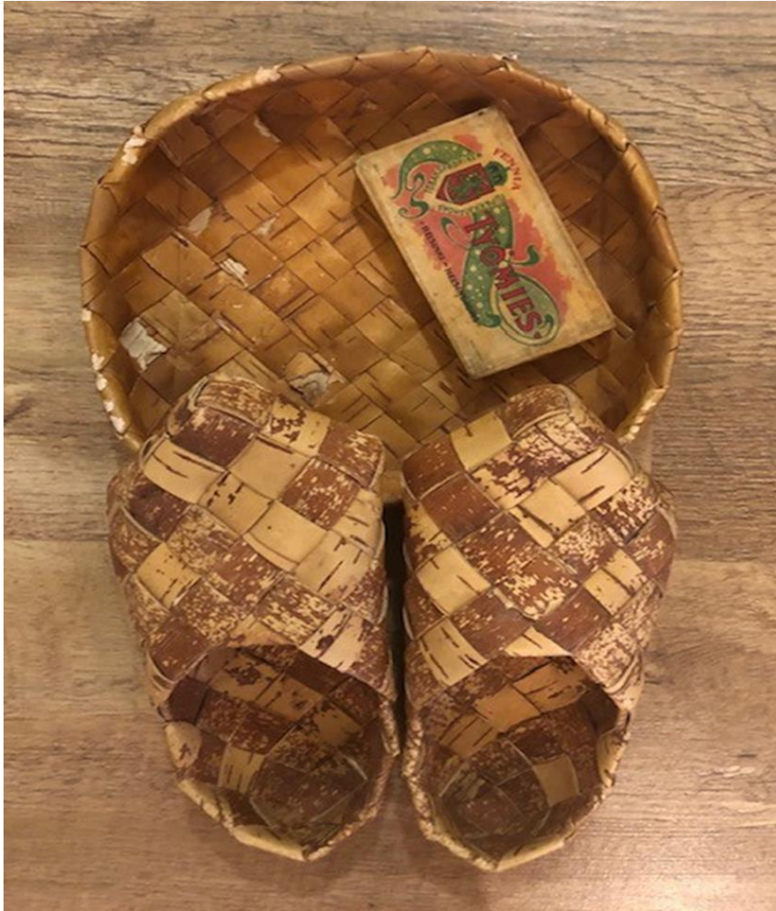
Kuva 3. Tuohitavarat ja tupakka-aski

Lisäksi laukku sisältää laminoidut myönteisen muistelun kortit, sekä kiiltokuvien koristellun muisteluvihkon, johon voi muistella ja kirjoittaa ohjaajan avustuksella muistamiaan värssyjä tai muita muistoja. (liite 6) Laukussa on paljon Vahvikkeen sivuilta tulostettuja ja laminoituja valokuvia entisajalta.