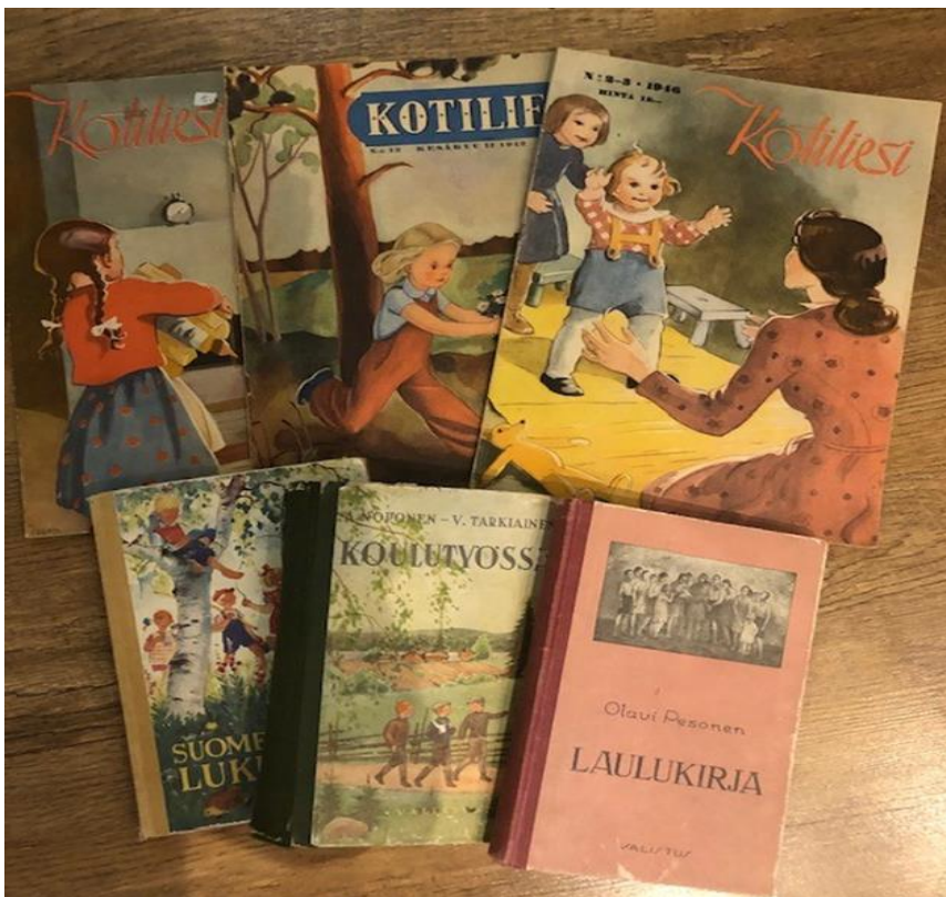
Kuva 2. Koulukirjoja ja vanhoja lehtiä

Pukeutuminen ja muoti entisaikaan tuodaan laukussa esille vanhojen valokuvien kautta. Myös Kotiliesi- lehdissä tulee esille 1940- ja 1950- luvuilla eläneiden ihmisten pukeutumistavat ja -tyylit. Keskustelua voi johdatella aiheeseen sopivien kysymyskorttien avulla.