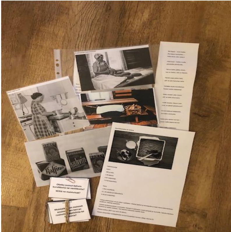
Kuva 5 .Ruokamuistojen muistelutuokio.