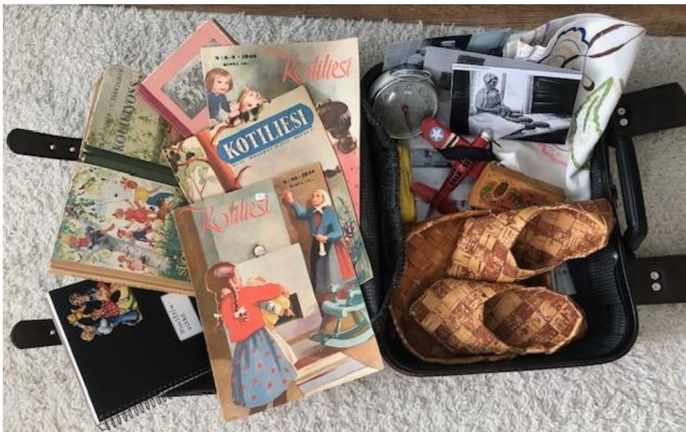
Kuva 1. Muistelulaukun sisältöä

Valmis tuotos, muistelulaukku, sisältää erilaisia valmiita muistelutuokioita (kuva 1). Kotia, perhe-elämää ja entisajan arjen askareita voi muistella vanhoja valokuvia ja Kotiliesi-lehtiä katsellen ja lukien (kuva 2). Vanhat lelut, tupakka-aski, käsin kirjailtu pyyhepeitto ja tuohitavarat sekä runot vievät ikäihmisten ajatukset lapsuuden kotiin ja perheeseen. Kysymyskortteilla voi johdatella keskustelua ja monipuolistaa tuokioita.