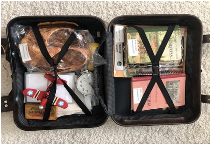
Kuva 4. Muistelulaukku pakattuna.