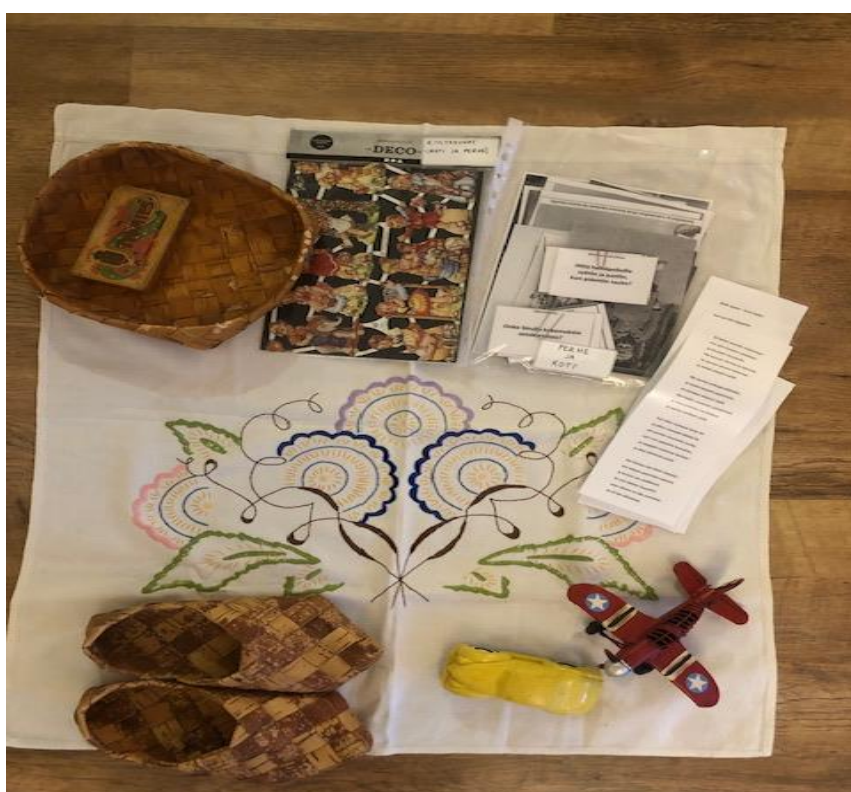
Kuva 8 Koti- ja perhemuistojen tuokio