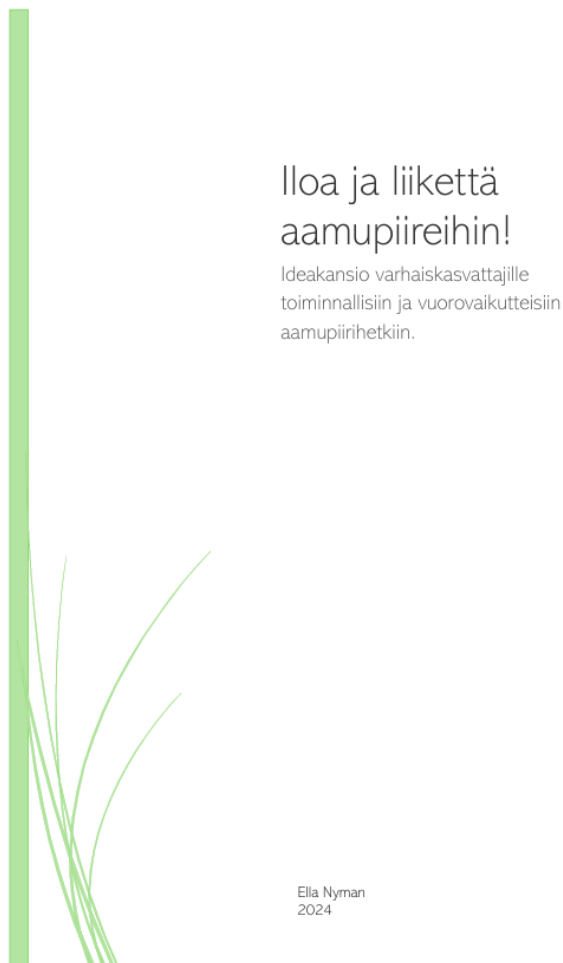
Kuva 1. Ideakansion kansilehti.

Kehittämistyöraportin ohella julkaistaan erillisenä tiedostona valmis ”Iloa ja liikettä aamupiireihin!” -ideakansio. Materiaalikansio koostuu 12 sivusta: kansilehdestä, sisällysluettelosta, ohjeista varhaiskasvattajille, oppimisen alueittain ryhmitellyistä 23 toimintatuokiosta ja lähdeluettelosta. Alla on kuva ”Iloa ja liikettä aamupiireihin!” -ideakansion kansilehdestä (Kuva 1.).