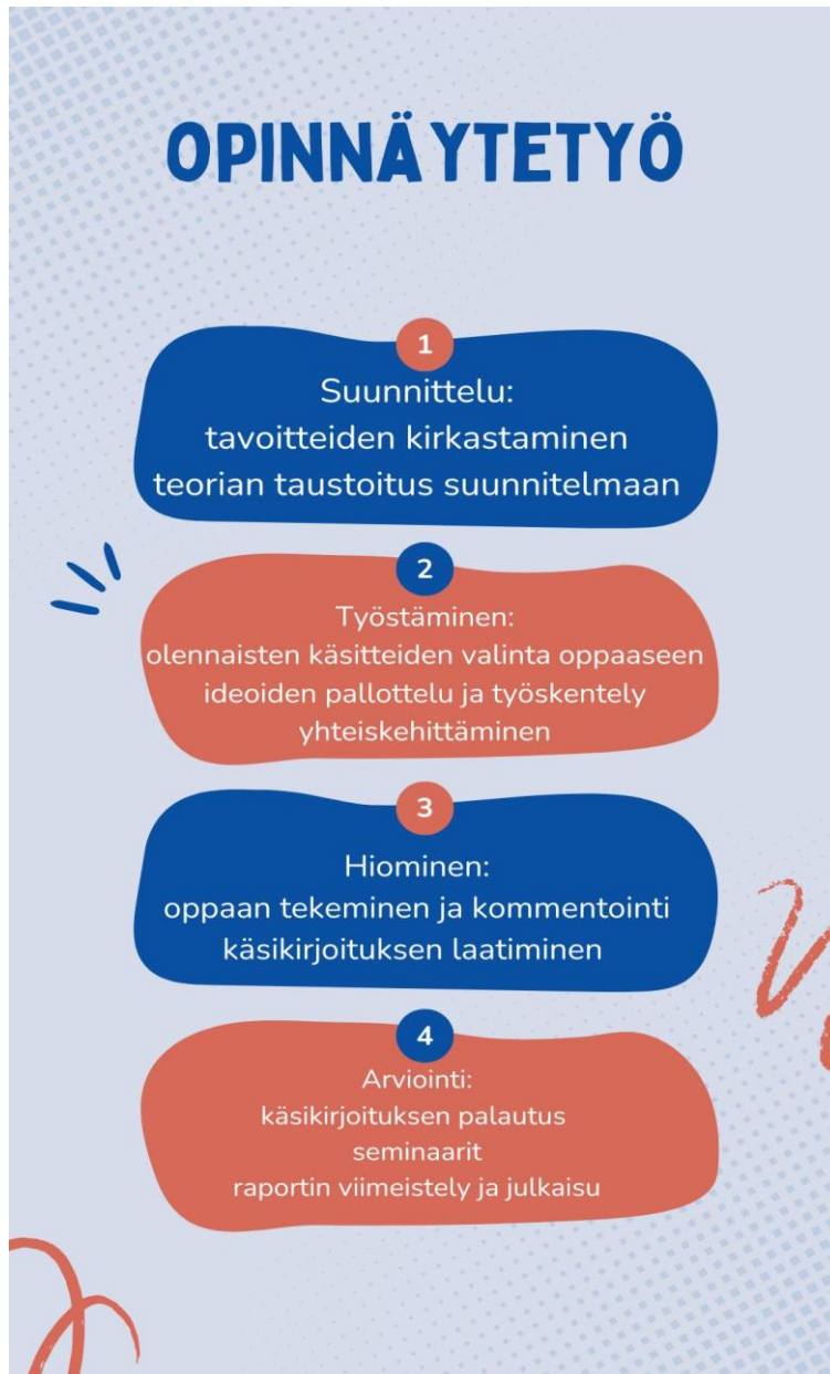
Kuva 2. Kooste opinnäytetyöni prosessin etenemisestä