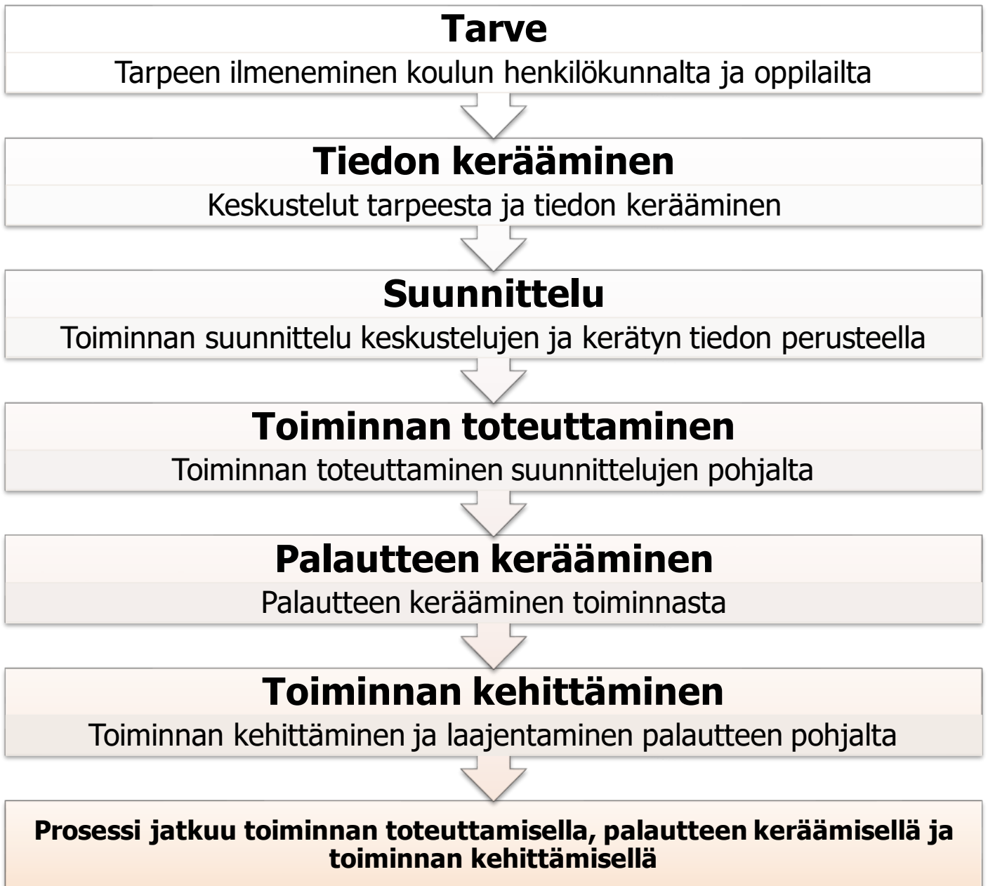
Kaavio 1. Havainnointikaavio opinnäytetyön prosessista.

Opinnäytetyön prosessissa on nähtävissä suurta yhtäläisyyttä Lewinin kehittämään spiraalimalliin (Heikkinen ja Jyrkämä 1999). Kaikki alkaa tarpeen tai ongelman ilmenemisestä. Tätä ongelmaa lähdettiin työstämään opettajilta ja ohjaajilta tiedon keräämisellä, sekä kerätyn tiedon pohjalta toiminnan suunnittelulla. Kerättyjen tietojen pohjalta tehdyn suunnittelun kautta päädyttiin järjestettyyn toimintaan, josta kerättiin myös palautetta. Kerätyn palautteen kautta pyritään kehittämään toimintaa. Tätä samaa prosessia jatketaan, kunnes olemme saaneet järjestettyä sen kaltaisen toiminnan, minkä koemme palvelevan kohderyhmää parhaalla mahdollisella tavalla.