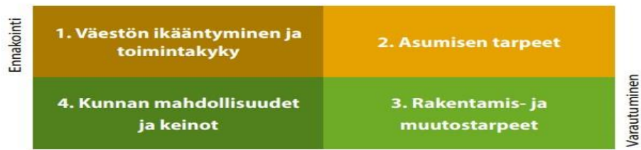
Kuva 1. Tarkasteluviitekehyyksen näkökulmat