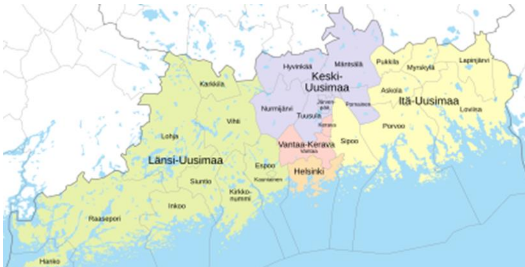
Kuva 2. Keski-Uudenmaan hyvinvointialueen sijainti Uudenmaan alueella violetilla (Wikipedia 2024).

Opinnäytetyön toimintaympäristöksi valikoitui Keski-Uudenmaan hyvinvointialue ja sen alueella olevat kunnat. Kuuden kunnan alueella asuu noin 200 000 asukasta. Alueen väestö asuu pääsääntöisesti kaupunkitaajamissa sekä kunta- ja kyläkeskuksissa, joihin on rakentunut monimuotoinen asuntokanta. Myös haja-asutusalueella asuu iso joukko väestöstä. Kuntien asuin- ja palveluympäristöjen kirjo on suuri, mutta kokonaisuudessaan ne vaihtuvat sopusoinnussa taajamista maaseutumaisemiin. Keski-Uudenmaan sote-kuntayhtymän toiminta aloitettiin vuonna 2019 ja omistajakuntina toimivat Hyvinkää, Järvenpää, Mäntsälä, Nurmijärvi, Pornainen ja Tuusula. Alueelliset muutokset sosiaali- ja terveystalouden järjestämisen osalta jatkuivat vuoden 2023 alusta, kun Keski-Uudenmaan hyvinvointialue aloitti toimintansa. Nykyinen hyvinvointialue rakentui pääosin samanmuotoisena kuin se kuntayhtymän aikana oli. Muutoksena aikaisempaan kokonaisuuteen alueen pelastustoimi, koulujen kuraattorit ja psykologit, Eteva-kuntayhtymän palveluita ja Ridasjärven päihdehoitokeskus liittyivät hyvinvointialueen toimintaan. (Keski-Uudenmaan hyvinvointialue 2024b.)