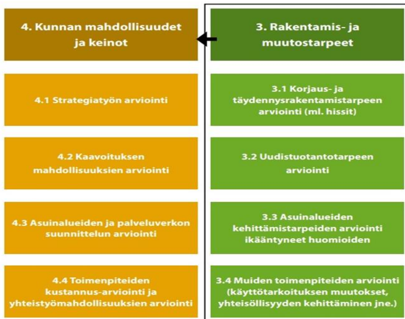
Kuva 3. Rakentamis- ja muutostarpeiden arvioinnissa huomioitavat tekijät