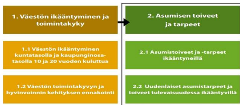
Kuva 2. Ikääntyneiden asumisen toiveet ja tarpeet