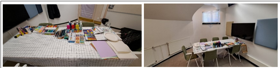
Kuva 1. Työskentelytila ja materiaaleja

Toimintaympäristömme sijoittui kirjaston projektihuoneeseen (kuva 1). Tila oli suhteellisen toimiva ja rauhallinen, joskin puutteena oli ikkunallinen ovi toiseen huoneeseen. Ikkunan peitin kankaalla joka tapaamiskerralle. Huoneen sai vuokrata vain yksi tapaamisaika kerrallaan eikä taidemateriaaleja ja välineitä voinut varastoida tilaan, vaan kuljetin ne joka kerta tapaamisiin matkalaukussani. Tilassa ei myöskään ollut mahdollisuutta säilyttää asiakkaani töitä, joten kuljetin niitä myös mukani jokaiselle kerralle. Huone oli riittävän tilava kahdelle hengelle. Huoneessa oli iso työpöytä ja tilaa työskentelyyn riittävästi. Luonnonvaloa pääsi sisään kahdesta pikku ikkunasta.