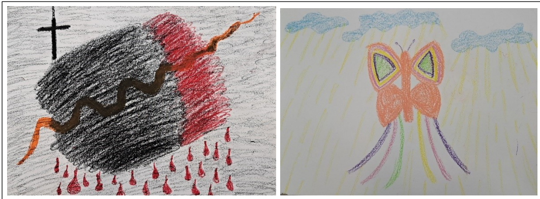
Kuva 6. Asiakkaan kymmenennen kerran työt

perhosen. Taivaalla oli taas unelmien pilviä ja ylhäältä loisti keltaisia säteitä. Asiakkaan mieliala koheni istunnon aikana ja puhuimme, miten on hyvä päästää negatiiviset asiat pois ja irrottautua niistä. Lapsuuskodin ihmiset saivat edelleen pilattua hänen mielialansa ja arkinsa. Keskustelimme myös omien rajojen merkityksestä ja ennen lähtöä hän jo pohti tulevaisuuden ammattia itselleen. Hän oli tietoinen luonteensa vahvuuksista.