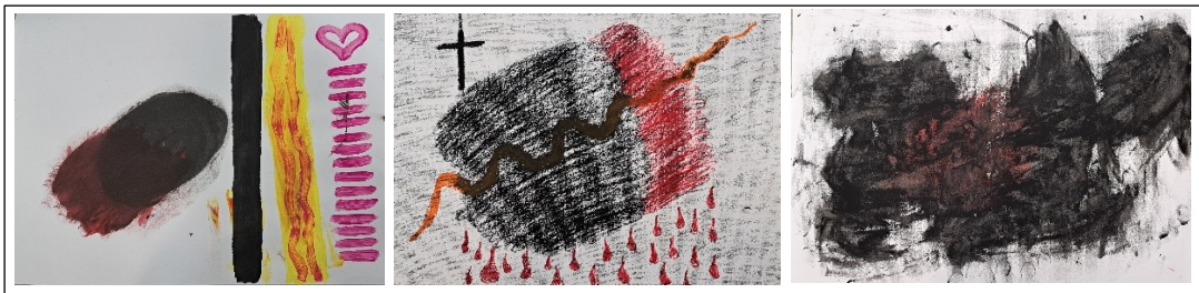
Kuva 14.A Prosessin alkupuolen kuvia

Prosessi on myös osoitus nähdä ja kuulla tulemisen tarpeesta ja luovuuden voimasta. Taidetyöskentely antoi mahdollisuuden irti päästämiseen, tuskallisten ja vaikeiden tunteiden ulkoistamiseen, käsittelyyn ja esteiden poistamiseen. Ulkoistettuna vaikeiden tunteiden käsittely oli helpompaa. Taideilmaisuus oli keino löytää uudelleen kekseliäisyys ja luovuus, vaikka taideilmaisuus ilman terapeutista suhdetta ei yksinään korjaisikaan menneisyyden puutteita. (Robbins, 2007, s.119). Asiakkaan kuvissa on nähtävissä muutoksia prosessin aikana. Negatiivisissa tunnekuviissa etenkin tapaamistemme alkupuolella (kuva 14) oli paljon mustaa ja punaista, mutta kuvat muuttuivat värimaailmaan kirkaammiksi ja mukaan tulivat metallinhoitoiset akryylimaalit ja kimallehipuset (kuva 15). Kuvien koko myös vaihteli ja muuttui isommiksi.