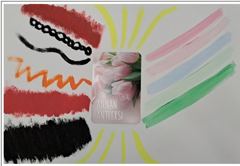
Kuva 5. Asiakkaan yhdeksännen tapaamiskerran kuva

Kymmenennellä kerralla asiakas kertoi kuluneella viikolla kohdanneensa todella ikäviä asioita läheistensä kanssa. Hän koki taas uudelleen ja uudelleen tulleensa hyljättyksi ilman myötätuntoa ja ymmärrystä. Hän oli pettynyt myös omaan käytökseensä ja oli vihaisen ja ärtyneen oloinen. Pyysin häntä ulkoistamaan nämä tunteensa paperille (kuva 6). Määrätietoisesti hän maalasi öljypastelliliiduilla värittäen suuren mustapunaisen kuvion, joka muistutti silmät kiinni tehtyä kuvan muotoa. Tuosta kuviosta valui punaisia pisaroita ja vasemmallalla ylhäällä oli musta risti. Taustan hän halusi vielä täyttää haalean mustaksi kevyesti värittäen. Hän työskenteli määrätietoisesti ja hiljaa keskittyen. Työ valmistui suhteellisen nopeasti.