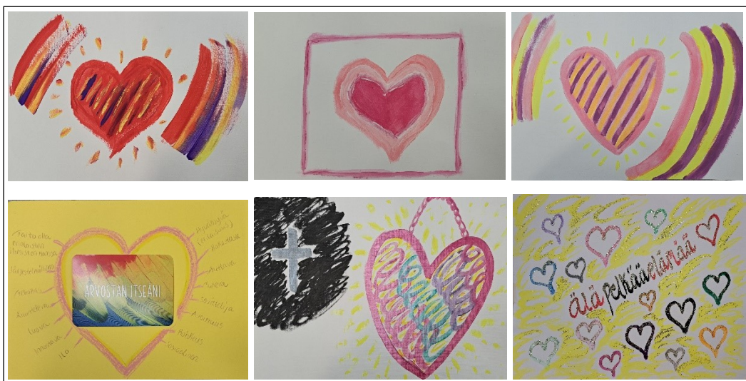
Kuva 13. Sydän- symbolien muuttuminen

Monissa kuvissa asiakas symboloi itseään sydämellä, mutta loppupuolella hän kuvasi kahdessa kuvassa itseään myös ihmisen muodossa. Sydän symboli esiintyi kahdeksassa työssä yhteensä 25 työstä. Sydän kuvat muuttuivat prosessin aikana (kuva 13), mikä heijastui myös hänen tunteuksiinsa ja kehonkieleensä. Useassa työssä hän käsitteli sydämen täyttämistä. Siellä oli alkuun pieni violetti, sisäinen lapsi, mutta sydämen täyttäminen tuntui useassa kuvassa tuskalliselta. Siihen tarvittiin itsensä arvostamista, irti päästämistä, lempeyttä, rajoja, turvaa ja anteeksi antoa. Sydän täyttyi lopulta leikkillisillä kiha-roilla, ilolla ja huumorilla.