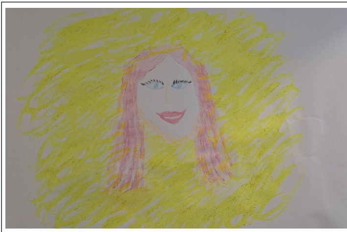
Kuva 9. Asiakkaan kuva ilman vankilan kaltereita

Katsoimme työtä pitkään. Se tuntui hänestä hiukan oudolta ja hämmentävältä. Edellinen työ kaltereiden sisällä tuntui hänestä enemmän omalta, kuten hän asian ilmaisi. Vankina hän on rauhallinen samoin kuten tilanteessa, jolloin hän vaikenee eikä saa puhuttua. Suu on kiinni, ei ole vaihtoehtoja. Hän kuvaili tätä olotilaa lamaantumisena, jolloin ei näe, kuule eikä tunne. Nyt kuitenkin uudessa teoksessa oli iloa ja energiaa, jonka voimin lähdettiin taas uuteen viikkoon.