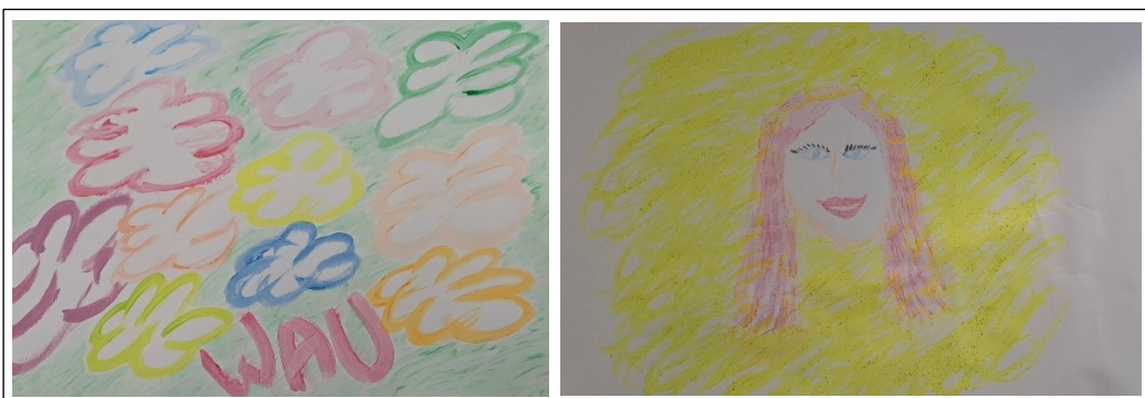
Kuva 15. Prosessin loppupuolen kuvia

Asiakkaan muutokset ovat näkyneet myös kehonkielessä prosessin aikana. Tunteita on ulkoistettu paperille maalaten ja paperia jopa repien. Kehollisuus