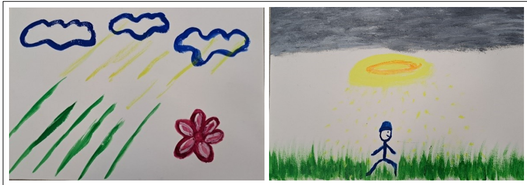
Kuva 4. Asiakkaan kuvat viidenneltä ja seitsemänneltä kerralta

häntä häirinnyt, vaikka tämän kerran teos ei vastannutkaan täysin hänen kokemustaan. Tämä muistutti kuitenkin häntä siitä tunnelmasta ja tilanteesta.