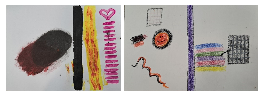
Kuva 3. Asiakkaan kolmannen ja neljännen kerran teokset

Viidennellä tapaamiskerralla asiakkaan mieli oli täynnä painavia asioita ihmissuhteista, hyljätyn ja ohitetun tulemisesta ja huonoista kohteluista. Hän mietti, miten hänen pitäisi muuttua. Hänen miehensä oli ainoa, kenelle hän pystyi puhumaan näistä vaikeista asioista minun lisäksi. Asiat olivat hänelle raskaita ja mietin omaa toimintaani, etten tuottaisi asiakkaalle taas ohitetun tulemisen tunnetta vaan lisäisin myötätuntoa ja lempeyttä. Edellisillä kerroilla on käsitelty raskaita asioita, joten ajattelin lepokuvan olevan tarpeen tuomaan iloa ja positiivisuutta tähän hetkeen. Raskaiden tunteiden ja vaiheiden jälkeen lepokuvat voivat tuoda taideterapiaprosessiin lepoa, rauhaa ja mahdollisuutta reflektoida etäisyyteen. On hedelmällistä käyttää erilaisia menetelmiä, näkökulman vaihtamista, kuvan rajaamista, materiaalikokeiluja tai leikkilistä työtappaa. (Rankanen, 2007, s.117.)