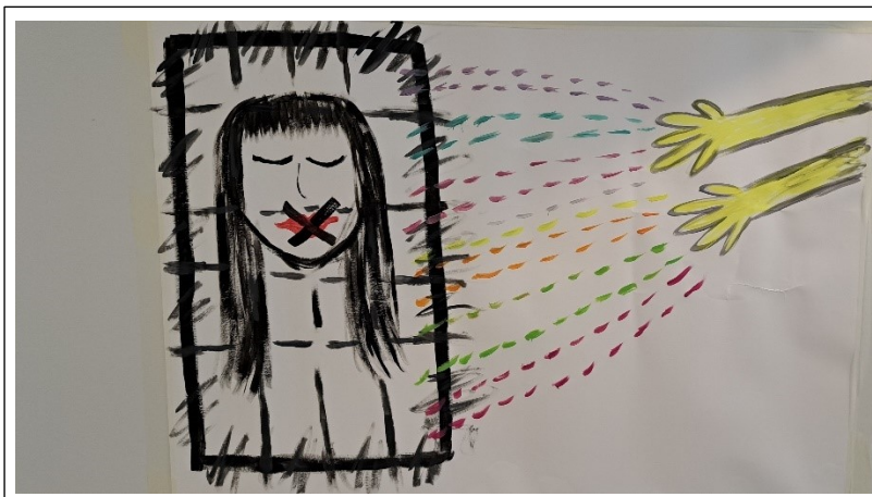
Kuva 8. Asiakkaan kuva kaltereiden katkaisusta

Hän oli erittäin innostunut työstään, eikä osannut odottaa, että saisi tämän mielikuvan tuotua niin vaikuttavasti esiin. Siinä ei tarvittu paljon sanoja kuvaa katsoessamme. Kehonkieli tuli näkyviin taidetyöskentelyssä materiaaleja käsiteltäessä, mutta myös työn katsominen vaikutti kehon aistimukseen. Seistessä hän käytti kehoa laajemmin. Koko kroppa liikkui enemmän ja vapautuneemmin ja oli kokonaisvaltaisemmin mukana työnteossa. Hänen käden liikkeensä olivat laajemmat ja akryylimaali liukui hyvin. Hän tarkasteli työtä välillä kauempaa katsoen. Kauempaa katsoessaan hän tokaisi: ”En kestä, miten hyvä tästä tuli!” Teos voi välittää katsojalleen kehollisia viestejä värein, viivoin, muodoin ja symbolein. (Rankanen, 2007 s.42.)