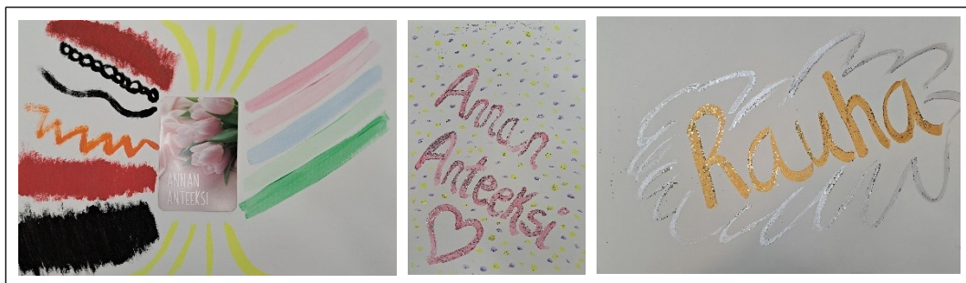
Kuva 14. Anteeksianto ja rauha

Asiakas toi esiin prosessimme loppupuolella, kuinka hän on havainnut asioiden hyväksymistä ja myötätuntoisempaa suhtautumista itseä kohtaan. Itsemyötätunnon myötä sallimme itsellemme virheitä ja epäonnistumisia, mikä rohkaisee antamaan itsellemme anteeksi, oppimaan virheistä ja jatkamaan elämää. Tämän myötä otamme terveellisiä riskejä emmekä jää olosuhteidemme uhriksi emmekä anna muiden hallita itseämme. Asenteemme on tämän jälkeen valoisampi. (Buchalter, 2020.) Asiakas käsitteli kuvan kautta anteeksi antamista itseään rohkaisten. Viimeisimmät kuvat ilmaisivatkin anteeksiantoa ja rauhaa (kuva 14).