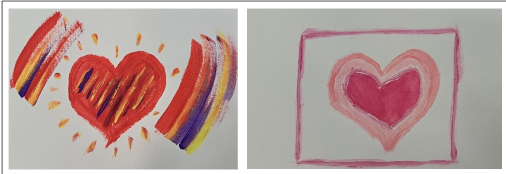
Kuva 2. Asiakkaan ensimmäisen kerran teokset

Toisella tapaamiskerralla asiakas kertoi, kuinka oli ollut hyvä ja keveä olo muutaman päivän tapaamisemme jälkeen. Sen jälkeen mieltä alkoivat painamaan huonot ystävyys- ja vuorovaikutussuhteet. Hän oli vihainen siitä, miten ystävyyssuhteet päättyvät usein samalla tavalla. Hän yrittää toimia oikein ja rehellisesti ja silti hänet ”hyljätään”. Hän ei kykene puolustamaan itseään, vaan menee usein lukkoon. Pohdimme asioita ja pyysin häntä kuvaamaan paperille näitä hänen hyljätynsi tulemisen tuntemuksiaan.