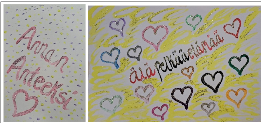
Kuva 12. Asiakkaan viimeisien kertojen teokset

Kuva oli samantyylinen kuin muutamat aikaisemmatkin työt sisältäen tekstiä. Hän kirjoitti akryylimaalilla paperille tekstin ”älä pelkää elämää!” Tekstin ympärillä oli pieniä eri värisiä sydämiä. Kaikki värit kuuluvat elämään ihan kuin kaikki tunteetkin. Elämä on monenlaista. Kuvan taustan hän teki keltaisella akryyli värillä samanlaisin pensselin liikkein kuin vankilasta vapautuneen tytön kuvassa. Tämä oli hänelle kuin turva- ja tsemppilause tulevaan. Viimeinen kerta oli tunteita ja kiitollisuutta täynnä. Sain asiakkaalta lahjoja ja kukkia kiitokseksi tästä prosessista.