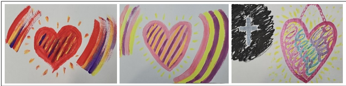
Kuva 7. Asiakkaan sydän kuvien muuttuminen

15. tapaamiskerralla asiakas puhui kuulumisistaan huomattavasti vähemmän aikaa, eikä hän puhunut enää ongelmallisista tilanteista ja ahdistavista vuorovaikutusasioistaan. Sen sijaan hänelle oli tullut mielikuva, kuinka hän on omassa vankilassaan kaltevereiden takana ja haluaisi käsitellä ja katkaista kalterit kuvanteon avulla. Mielikuvat kiinnittyvät syntyviin kuviin ja kuvat taas synnyttävät uusia mielikuvia. Mielikuvia voidaan yleensä ilmentää paremmin kuvien kuin sanojen avulla. Niihin liittyvät tunteet, aistimukset ja ajatukset välittyvät kuviin, joita voidaan työstää taiteellisesti. Elävät mielikuvat auttavat luovan prosessin eteenpäin menemisessä. (Mantere, 2007 s.14.)