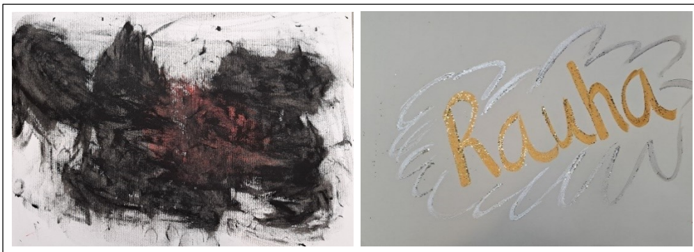
Kuva 10. Asiakkaan vastakohta kuvat 17. tapaamiskerralla

Tämän jälkeen tehtiin tälle tunteelle vastakuva. Mitä tuntee nyt, kun ärsyyntyminen on ulkoistettu paperille. Hän kovasti mietti, mitä se on ja miltä se tuntuu. Hän mietti mielessään mietelauseita tai sanaa, jonka löysi korttien avulla. Hän yhdisteli kolmen tärkeimmän kortin asiat yhteen sanaan ”rauha”. Kultaisella akryylivärillä hän kirjoitti paperille rauha-sanan ja maalasi hopeisella akryylivärillä sanan ympärille ikään kuin pilvenmuotoiset ääriviivat. Kuvan päälle hän sirotti vielä kultaista ja hopea hilettä. Kuva oli kaunis, ilmava, kevyt ja rauhallinen. Nyt oli kaksi kuvaa, toistensa vastakohtat (kuva 10) ja asiakas oli taas kovin vaikuttunut aikaansaannoksestaan, miten upeita töitä hän oli tehnyt. Mieli ja olemus olivat huomattavasti parempia ja rauhallisempia kuin tapaamisemme alussa.