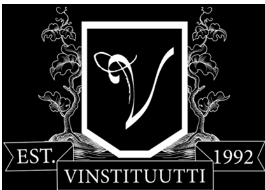
Vinstituutin uudistettu logo mustalla pohjalla