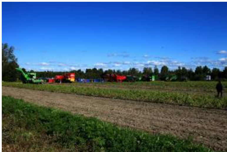
Figur 3: Potatisupptagnings demonstration

Övriga arbetsdemonstrationer som pågick på området bestod av olika typer av jordbearbetningsmaskiner. t.ex. jordfräsar, alvluckrare och olika kupformare och -fräsar. (se figur 4)