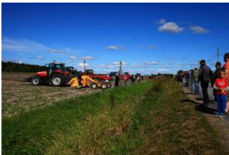
Figur 4: Jordbearbetningsmaskiner

Övriga arbetsdemonstrationer som pågick på området bestod av olika typer av jordbearbetningsmaskiner. t.ex. jordfräsar, alvluckrare och olika kupformare och -fräsar. (se figur 4)