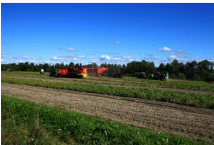
Figur 2: Potatisupptagnings demonstration

På fältdagen var det en lång rad av olika företag och organisationer som ställde ut.