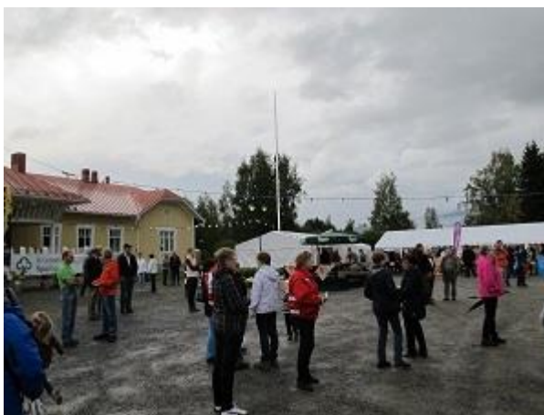
Figur 5: Festivalområdet

En rad olika företag, organisationer och föreningar kommer att få ställa ut på festivalområdet. Under evenemanget var det en mängd olika program. Det fanns t.ex. olika smakprover, en rad olika kockar presenterade olika potatismåltider. En mängd olika föreläsningar om potatis ägde rum under dagen. Det hölls även olika tävlingar så som en potatiskonst tävling för barn samt en matlagningstävling. På kvällen hade det ordnats en stor skördefest med dans och middag.