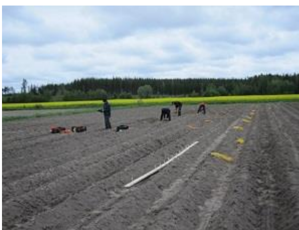
Figur 1: Plantering av sortförsöket

Syftet med föreningen Dagsmark Potato är att försöka lyfta fram alla odlare, företag, organisationer och föreningar som direkt eller indirekt har något att göra med potatisbranschen i Dagsmark och dess omnejd. Föreningens officiella namn är Dagsmark Potato byaförening r.f.. I folkmun kallas föreningen Dagsmark Potato eller bara Potato.