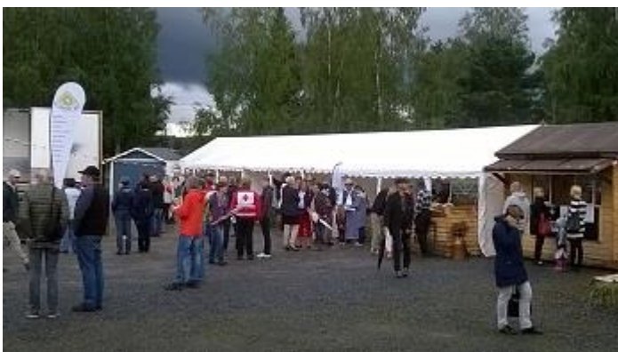
Figur 7: Festivalområdet

Från och med februari började styrelsen att ordna ”byamöten” där arbetsledare utsågs. Arbetsledarna fick då i uppgift att skaffa sig en arbetsgrupp. Dessa arbetsgrupper hade egna ansvarsområden. Totalt delades hela arrangemanget upp i