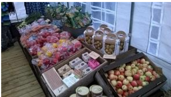
Figur 8: Gårdsbutiken

Utomhus fanns det uppbyggt tält som fungerade som utställningsmontrar åt de olika utsädeshusen. Gårdsbutiken var även den uppbyggt av ett stort tält. En del av produkter som fanns i gårdsbutiken kan ses i figur 8. Arenan (utescen) bestod av en lastbilskärra. Det fanns både en barnpark och en djurpark. Ytterligare fanns det några försäljare med egna marknadsstånd.