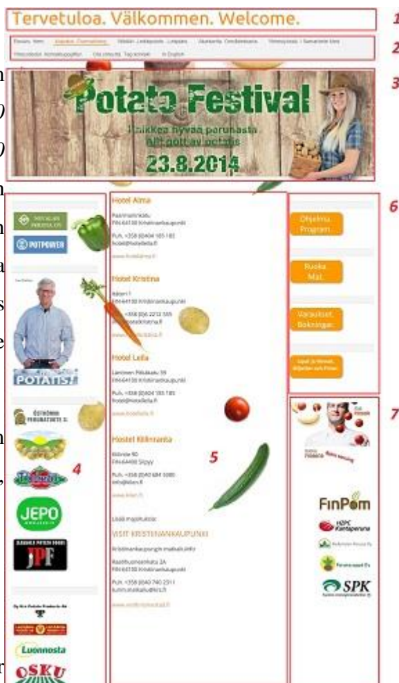
Figur 10: Hemsidan

Menyerna är uppdelade i två olika menyer en huvud- och en sidomeny. Huvudmenyn länkar till artiklar som innehåller mer