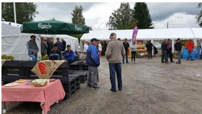
Figur 6: Festivalområdet

Ytterligare hade jag som uppgift att skapa en kort frågeenkät att dela ut under festivalen åt besökare. Enkäten ska sedan sammanfattas och presenteras åt Dagsmark Potato.