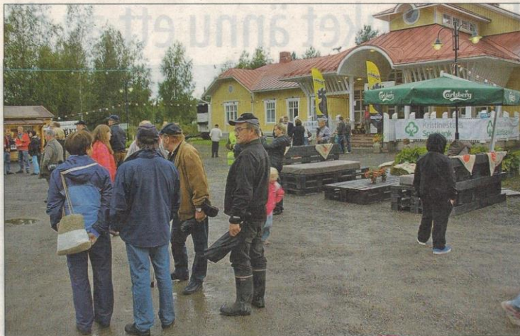
Det bjöds på potatis i olika former under Potato Festival i Dagsmark förra helgen. Regnet öste ner, men det hindrade inte hundratals besökare från att komma och se vad festivalen bjöd på.