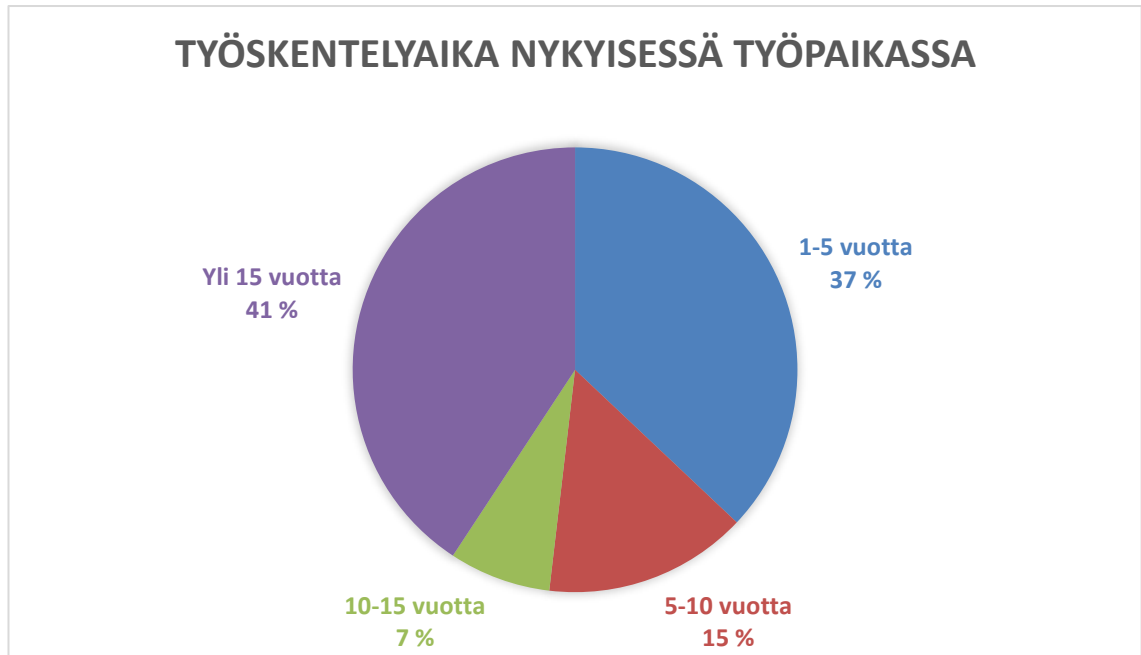
Kuvio 2. Vastaajien jakauma nykyisessä työpaikassa.