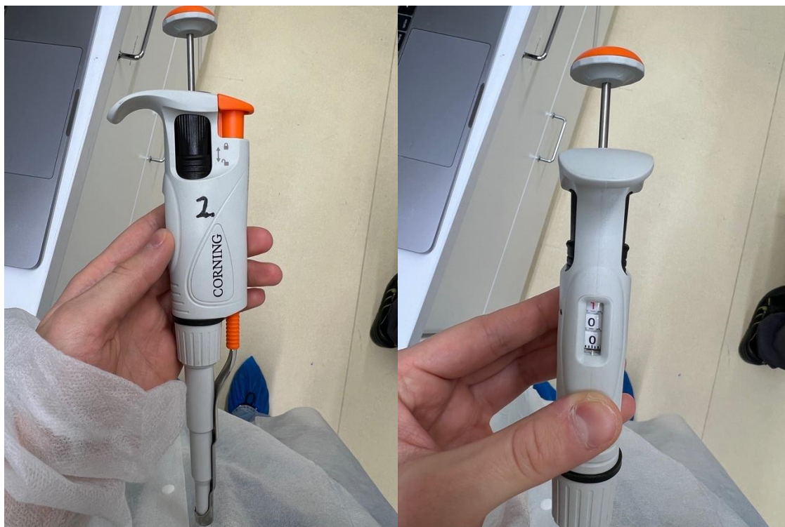
Kuvassa 2 koon pipetti, joka on säädetty 1ml:aan.