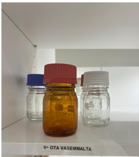
Kuvassa steriloitu 80 ml mittapurkki.