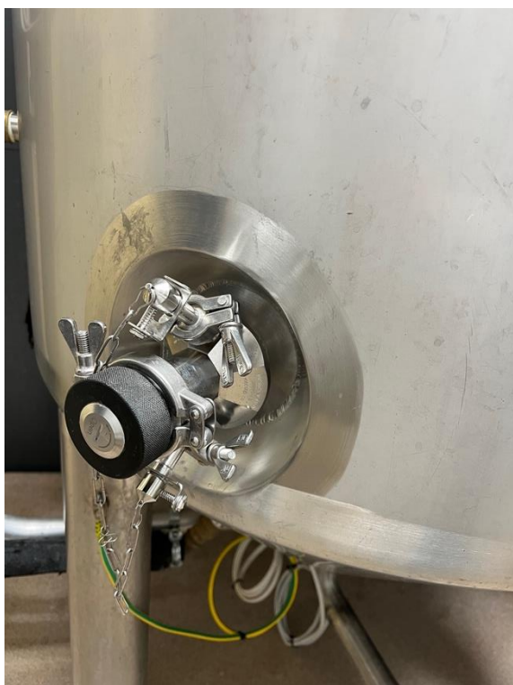
Kuvassa tankin näytteenottohana.