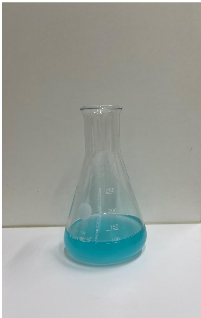
Kuvassa valmis liuos.