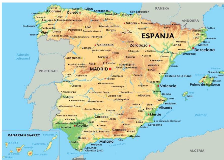
Kuva 2. Espanjan kartta (Albatros Travels, 2024).

Espanja on yksi Välimeren alueen 21 maasta, ja siihen kuuluu myös useita Välimeren alueen saaria. Espanjan tunnetuimpia saaria ovat esimerkiksi Ibiza, joka tunnetaan bilesaarena sekä Mallorca, joka on suomalaisten perheiden suosima lomakohde. (Välimeri ja sen matkakohteet, n.d.) Espanjan pääkapunki Madrid sen sijaan houkuttelee kaupunkimatkailijoita ihastelemaan kaudista arkkitehtuuria, kulttuuria sekä espanjalaista ruokaa. Espanjalaisten urheilukulttuuri on erityisen vahvaa Madridissa jalkapallon takia, Madridissa on nimittäin kahden huippujoukkueen jalkapallostadionit, Real Madridin Estadio Santiago Bernabéulle sekä Atlético de Madrid Estadio Vicente Calderón. (Apollomatkat, n.d.)