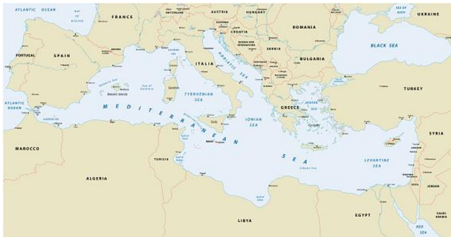
Kuva 1. Välimeren alueen maiden kartta.

Kun puhutaan Välimeren alueesta, tarkoitetaan maa-alueita, jossa yhdistyy kolme manteretta sekä 21 maata. Välimeren alue houkuttelee turisteja erityisesti risteilyjen sekä historiallisten rakennusten vuoksi. (YSO, 2016.) Välimeren alueella vallitseva ilmasto sijoittuu sen rannikkoalueisiin. Rannikkoalueiden ilmastolle on tyypillistä, että on tuuliset, leudot ja kosteat talvet, kun taas kesät ovat tyyniä, kuumia sekä kuivia. Kevään ilmasto vaihtelee siirtymäkautena sekä syksy on lyhyt. (Salah & Boxer, n.d.)