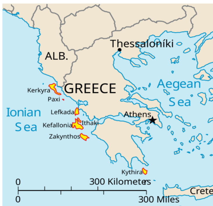
Kuva 4. Kreikan kartta (Matkaoppaat, 2024).

Kreikka on suosittu matkakohde sen kauniiden kaupunkien ja saarien, upea historian ja myyttien ansiosta. Esimerkiksi Knossos tuo matkailijoille mieleen kreikkalaisesta mytologiasta tunnetun minotauruksen, jossa yhdistyi ihmisen ruumis härän päällä ja hännällä. (Välimeren matkakohteet, n.d.) Ateena on Kreikan pääkaupunki, joka tarjoaa sinne matkailijoille antiikin raunioita, kulttuuria sekä kaupunkielämyksiä. Museot tarjoavat kulttuuria Troijan sodasta sekä kuninkaiden naamioista. (Kosonen, n.d.)