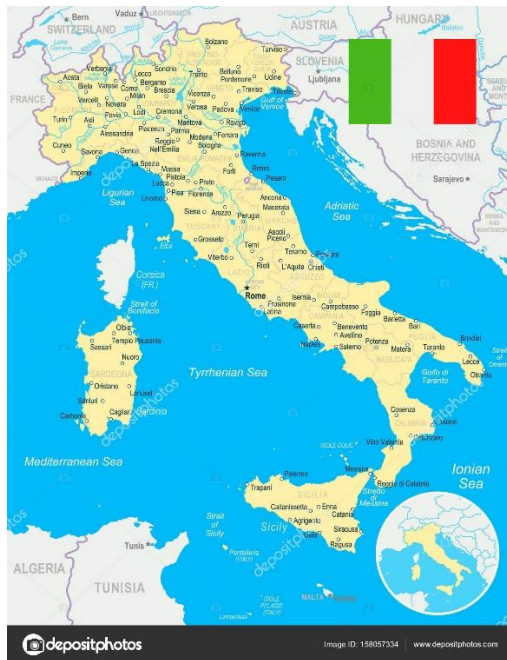
Kuva 3. Italian kartta.

Italian ilmasto poikkeaa osittain myös Välimeren normaalista ilmastosta. Kesät ovat kuumia ja kuivia valtaosassa Italiaa, mutta Pohjois-Italiassa talvet ovat sateisia ja kylmiä. Alpeilla vallitsee vuoristoilmasto, jolloin kesät ovat viileitä ja talvet todella kylmiä. Kielen ja kulttuurinen jakautuminen näkyy maassa eri alueilla. Luoteis-Italia toimii liikevaihdon keskuksena, sillä sieltä löytyy Torino, joka on maan suurin teollisuuskaupunki. Koillis-Italia sen sijaan painottuu ruokaan sekä kauniiseen Venetsiaan. Historiallisena alueena pidetään luonnollisesti Roomaa ja tämän Colosseumia sekä Etelä-Italian Napoliä, josta matkailijat voivat löytää Pompeijin rauniot. Sisiliasta matkailijat löytävät maukasta ruokaa sekä arkeologisia kokemuksia. (Välimeri ja sen matkakohteet, n.d.)