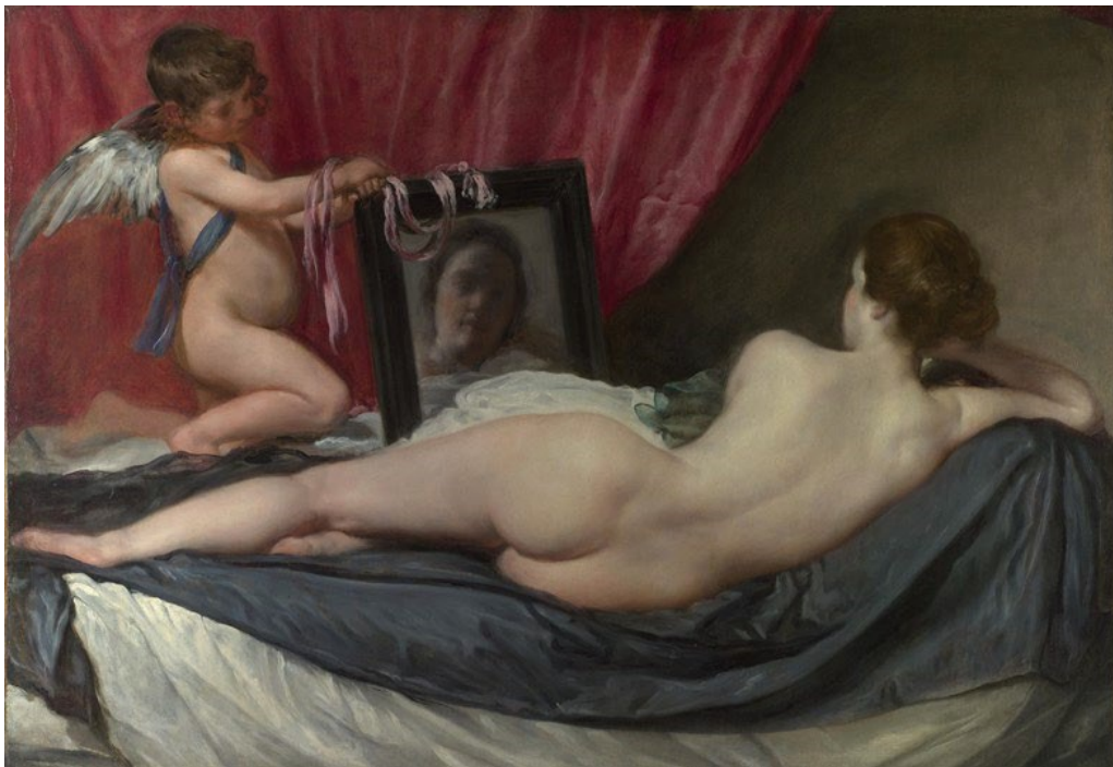
Kuva 5. Diego Velasquez: Rokeby Venus (1651)