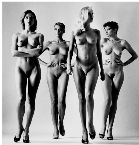
Kuvat 6 ja 7 Helmut Newton Sie Kommen Naked and dressed

Helmut Newton pukee mallinsa voimakkaasti, silloin kuin heillä on vaatteet päällä. Tätä kutsutaan muotimaailmassa termillä power dressing eli voimapukeutuminen. Newton esimerkiksi kuvasi 1980-luvulla Vogueen kuvasarjan Sie Kommen, Naked and Dressed , (kuvat 6&7) jossa mallit ovat pukeutuneina jakkupukuihin ja korkokenkiin, sekä toisessa kuvassa samassa asetelmassa ilman vaatteita, vain korkokengät jaloissaan. (Halmesmaa 2014, 31.)