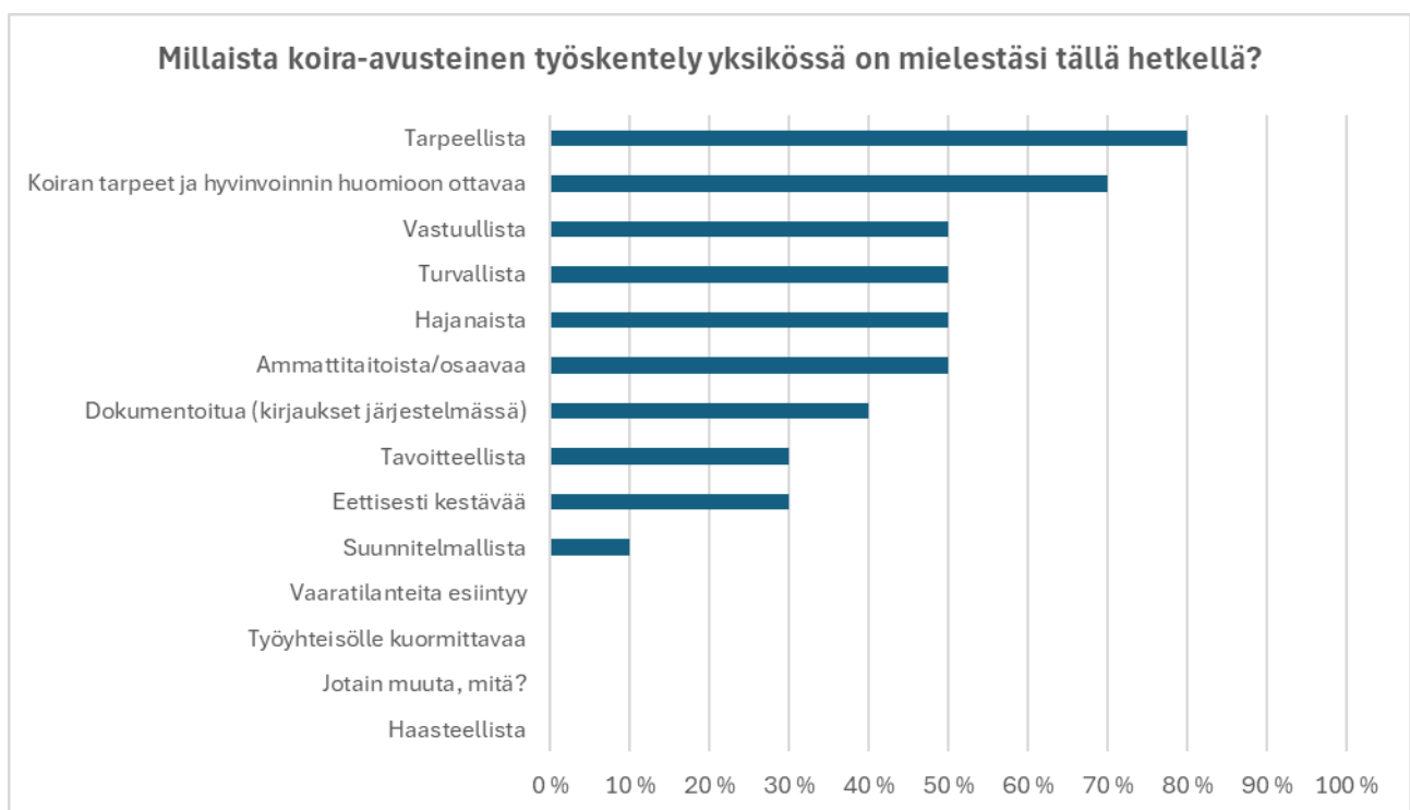
Kuvio 4. Kokemukset koira-avusteisen työskentelyn nykytilasta.

Tuloksia arvioitaessa tulee kuitenkin huomioida, että vastaajan näkemys vastausvaihtoehtojen tulkinnasta on vastaajan subjektiivinen näkemys ja perustuu vastaajan omaan tulkintaan siitä, mitä vastausvaihtoehto hänelle itselleen merkitsee.