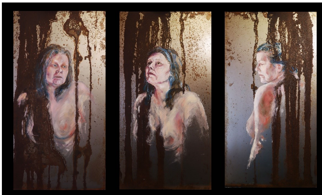
Kuva 1. Portraits of losing myself 2024.

Käyttäessäni epätavallisia maalauspohjia joudun tekemään valintoja ja pohtimaan materiaalien soveltuvuutta maalauspohjaksi. Esiin nousee kysymyksiä teosten säilymisestä ja muuttumisesta ajan saatossa. Teoksessani Portraits of losing myself (kuva 1) maalauspohjana on käytetty ruostutettua peltiä. Ruostutetut pellit ovat kulkeneet mukani jo useamman vuoden. Vuosien saatossa ne ovat muuttaneet mukani kodista toiseen. Vaikka peltien ruosteinen pinta inspiroi, kesti pitkään ennen kuin ne päätyivät teokseksi asti.