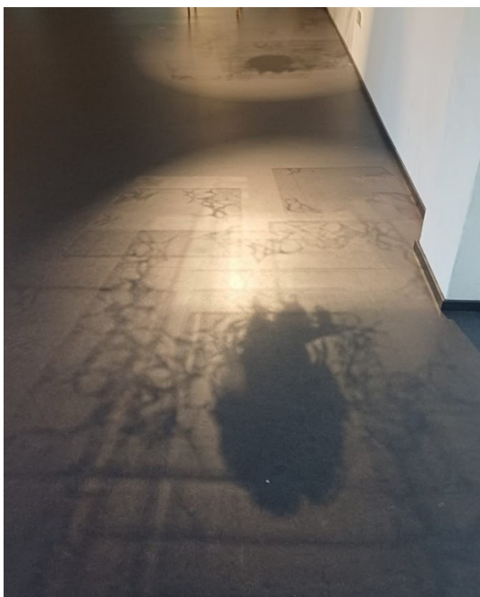
Kuva 4. Perintö 2024, installaation varjoja.