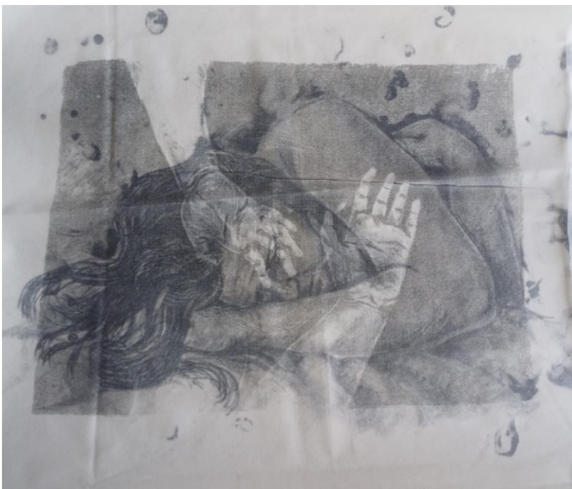
Kuva 2. Nimetön 2024 (litografiakokeilu).

Litografian tekniikka antaa paljon mahdollisuuksia teeman käsittelyyn. Kalkkikivelle voidaan esimerkiksi piirtää, maalata tai sille voidaan siirtää valokuvia. Tekniikka mahdollistaa myös saman teoksen toiston useille eri materiaaleille. Eri materiaalien avulla voidaan tuoda lisämerkityksiä teoksen sisältöön ja ohuille materiaaleille vedostetut kuvat mahdollistavat kerroksellisuuden hyödyntämisen. Litografian parissa tehdyt materiaalikokeilut vahvistivat ajatusta kerroksellisuuden käyttämisestä ylisukupolvisuuden teeman käsittelyssä. Erityisesti itseäni kiehtoi ajatus eri materiaaleille painettujen kuvien yhdistämisestä yhdeksi teokseksi. (Kuva 2)