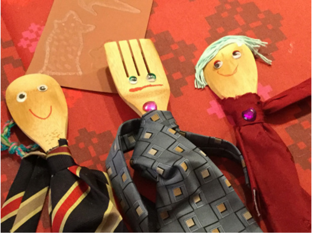
Kuva 2. Puisista keittiövälineistä ja omista tekstiileistä (kravatit) askarrettiin fantasiahahmoja esineteatteriin.

Tekstiilit voivat toimia myös materiaalina yhteisöllisessä työskentelyssä, jossa osallistujien omien pienten panostusten summa voi olla iso yhteinen tuotos: aitaverkosta muotoiltu ja pujotetuilla tekstiileillä koristettu maja päiväkodin pihalle tai tekstiiliseinämä ryhmän tilaan. Työpajassa kokeiltiin yhteisen tuotoksen valmistamista pujotellen omia leikattuja ja revittyjä tekstiilisuikaleita verkkoon sekä askarrettiin arkisista keittiövälineistä (kapustat, kauhat, paistinlastat) tekstiilejä ja muita askartelumateriaaleja hyödyntäen omia fantasiahahmoja. Hahmojen inspiroimana syntyi spontaaneja teatteriesityksiä. Myös kapustanukke voi toimia hahmona, joka johdattelee yhteistyöhön perheiden kanssa.