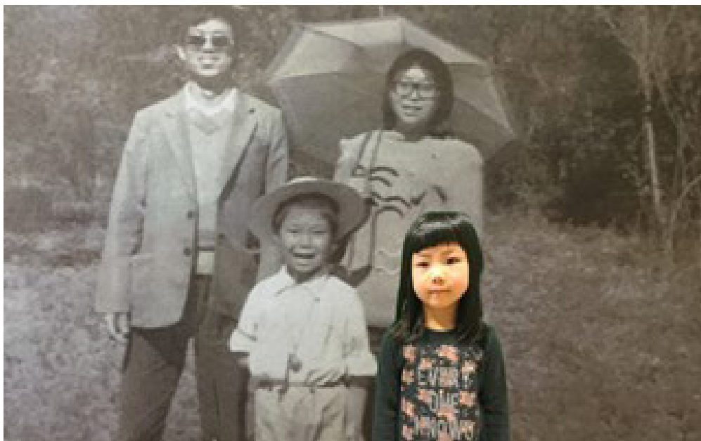
Kuva 3. Vanha ja uusi valokuva on yhdistetty Greenscreen-tekniikan avulla kuvaksi, jossa sukupolvet kohtaavat, tyttö ja tytön isä samanikäisinä.

Työskentely oli intensiivistä ja herätti tunteita. Osallistujat reflektoivat jälkeensä kokemustaan työpajasta. Muistojen kautta löytyi uusi näkökulma lapsuuteen. Mieleen palautui muistoja, joita ei ollut ajatellut pitkään aikaan. Aikaisemmin tylsänä ja tavallisena näyttäytyneestä lapsuudesta löytyi aarteita.