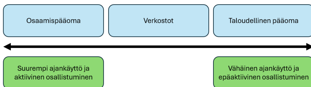
Kuva 3. Sijoittajan pääomat ja ajankäyttö. (FiBAN 2015)

Enkelisijoittaminen eroaakin merkittävästi mm. pörssisijoittamisesta siinä, että riskisijoittamisessa sijoittaja pyrkii usein osallistumaan aktiivisesti yrityksen toimintaan. Mentorointi ja kontaktit voivatkin olla yritykselle tärkeämpiä kuin raha. Suurimmiksi osaamistarpeeseen kohdeyhtiöt ovat luetelleet mm. strategisen suunnittelun, yrityksen kansainvälistymisen, kontaktien ja lisärahoituksen hankkimisen. (FiBAN 2015)